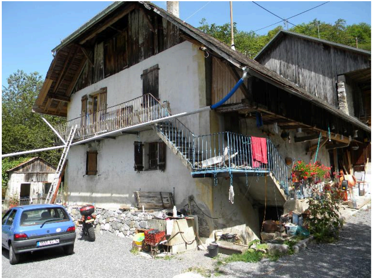
Vue du mur pignon de la ferme.