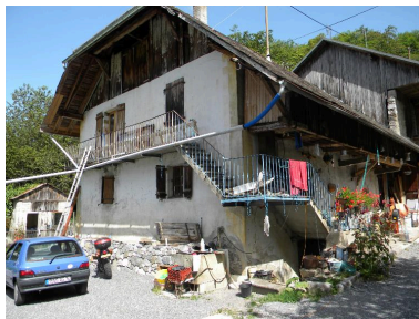
Vue du mur pignon de la ferme.