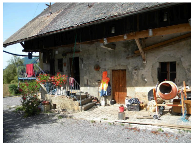
Vue de la façade principale de la ferme. IVR82_20137401130NUCA