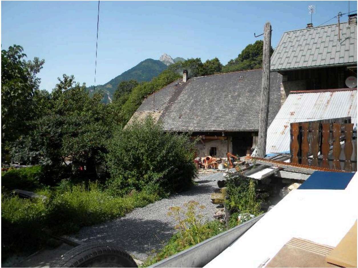
Vue de la ferme depuis le chemin d'accès.