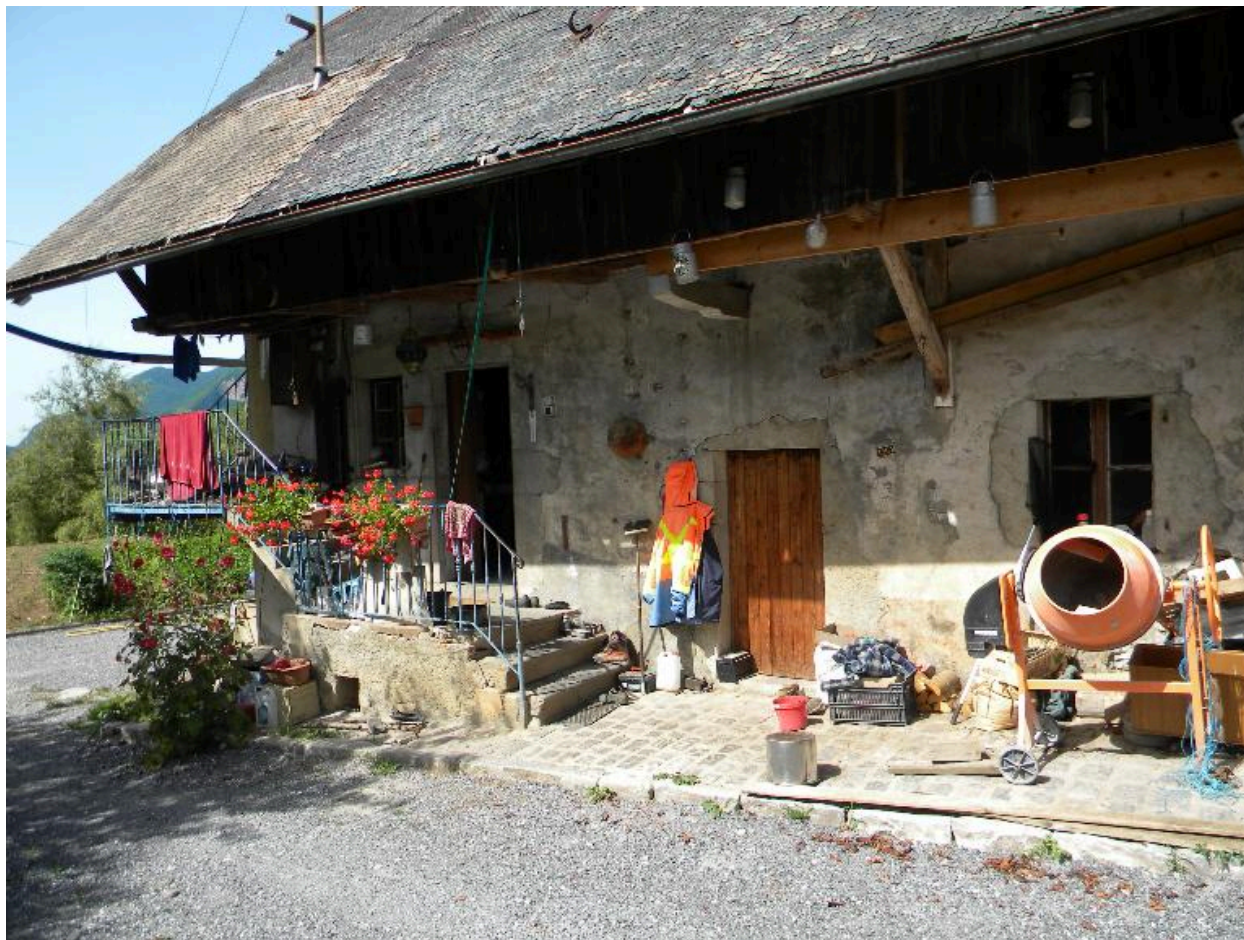
Vue de la façade principale de la ferme.