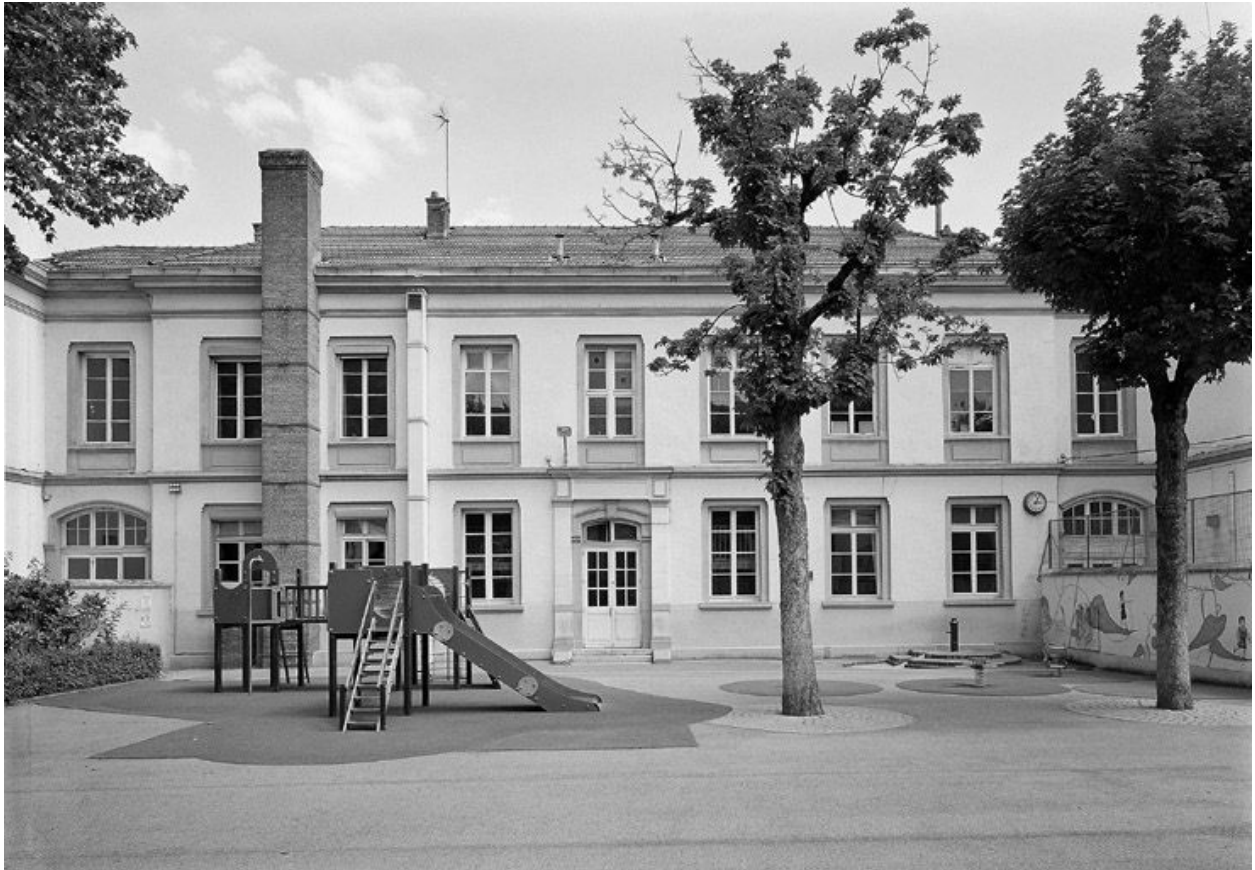
Ecoles primaires : partie centrale de l'élévation postérieure