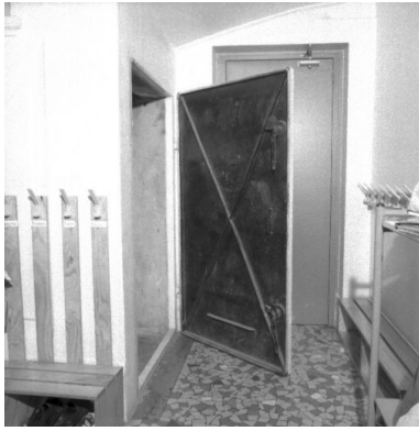
Ecole maternelle : porte d'accès aux caves située sous l'escalier principal