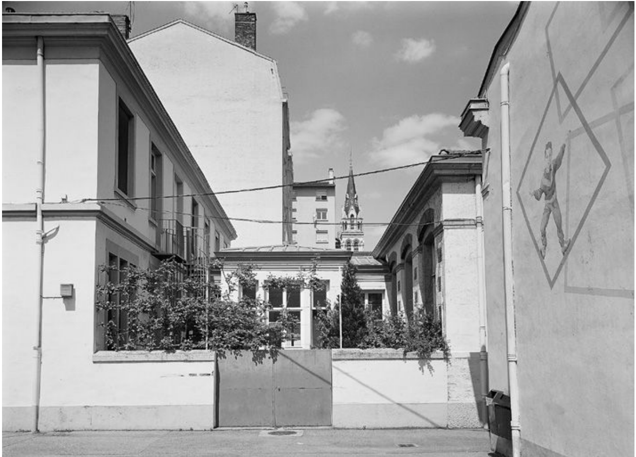
Ecole maternelle : vue des bâtiments prise depuis la cour sud-ouest. A l'arrière-plan, le clocher de l'église Sainte-Blandine