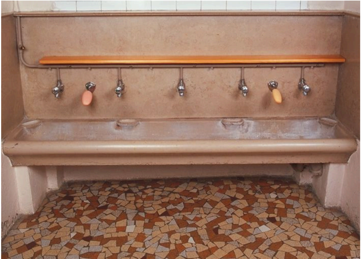
Ecole maternelle : les lavabos destinés à l'usage des enfants, rez-de-chaussée