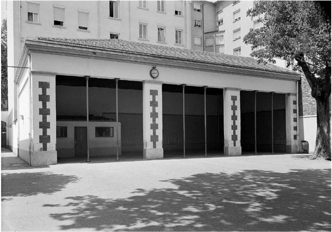
Ecoles primaires : préau situé dans la cour Nord