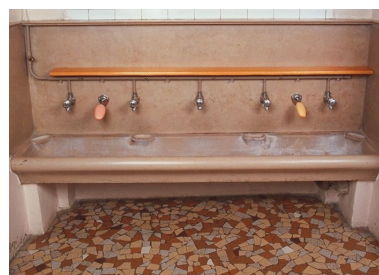
Ecole maternelle : les lavabos destinés à l'usage des enfants, rez-de-chaussée