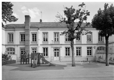
Ecoles primaires : partie centrale de l'élévation postérieure IVR82_20016901098P