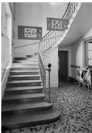
Ecole maternelle : l'escalier IVR82_20016902234P