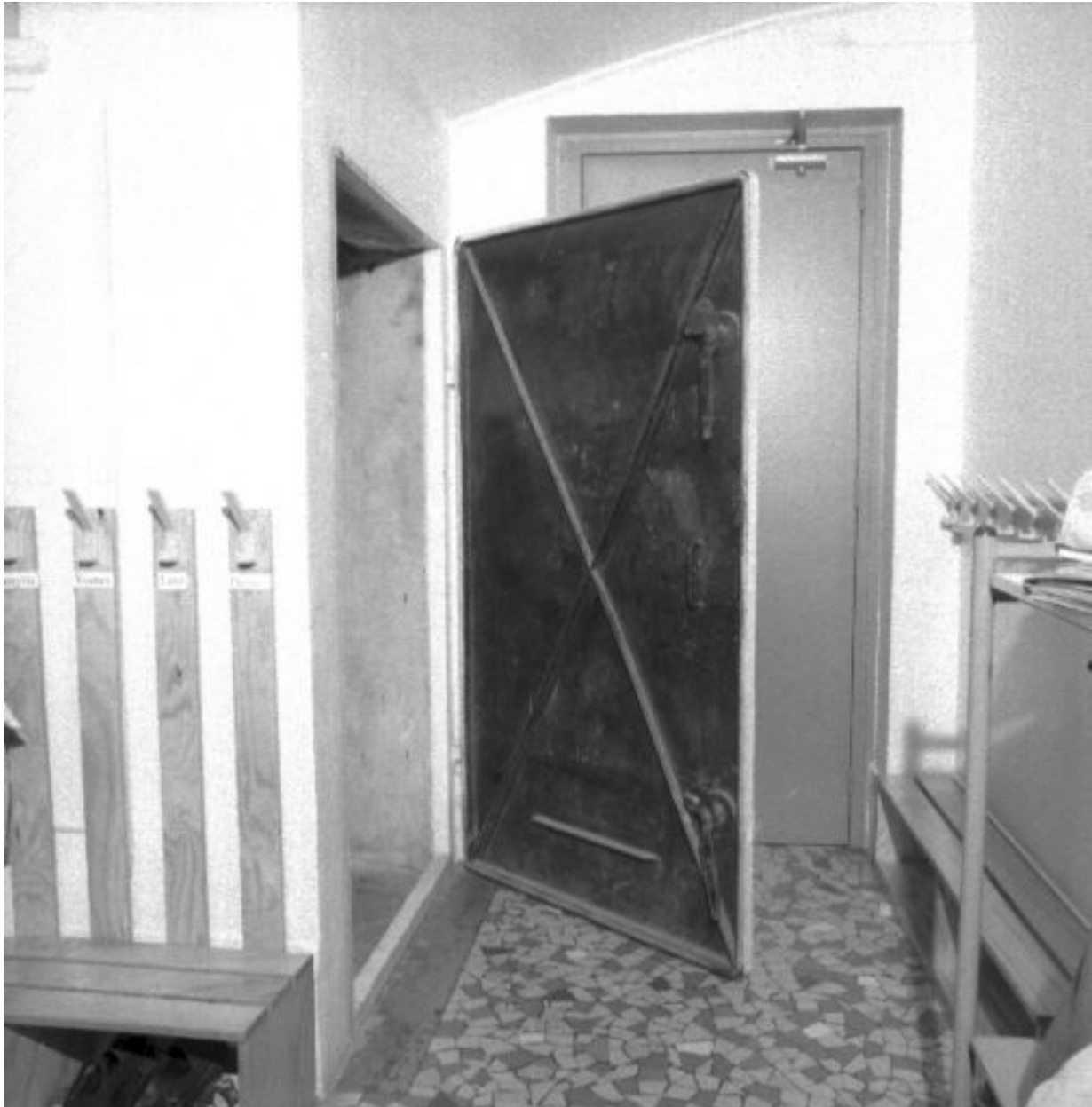
Ecole maternelle : porte d'accès aux caves située sous l'escalier principal