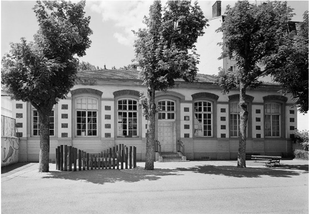
Ecole maternelle : élévation postérieure