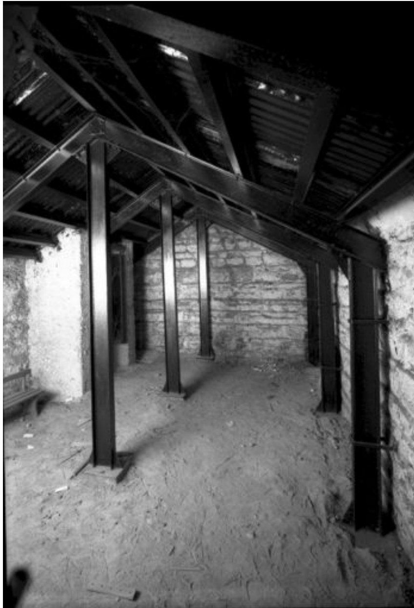
Ecole maternelle : vue partielle d'une cave construite en pierre et renforcée par une charpente métallique