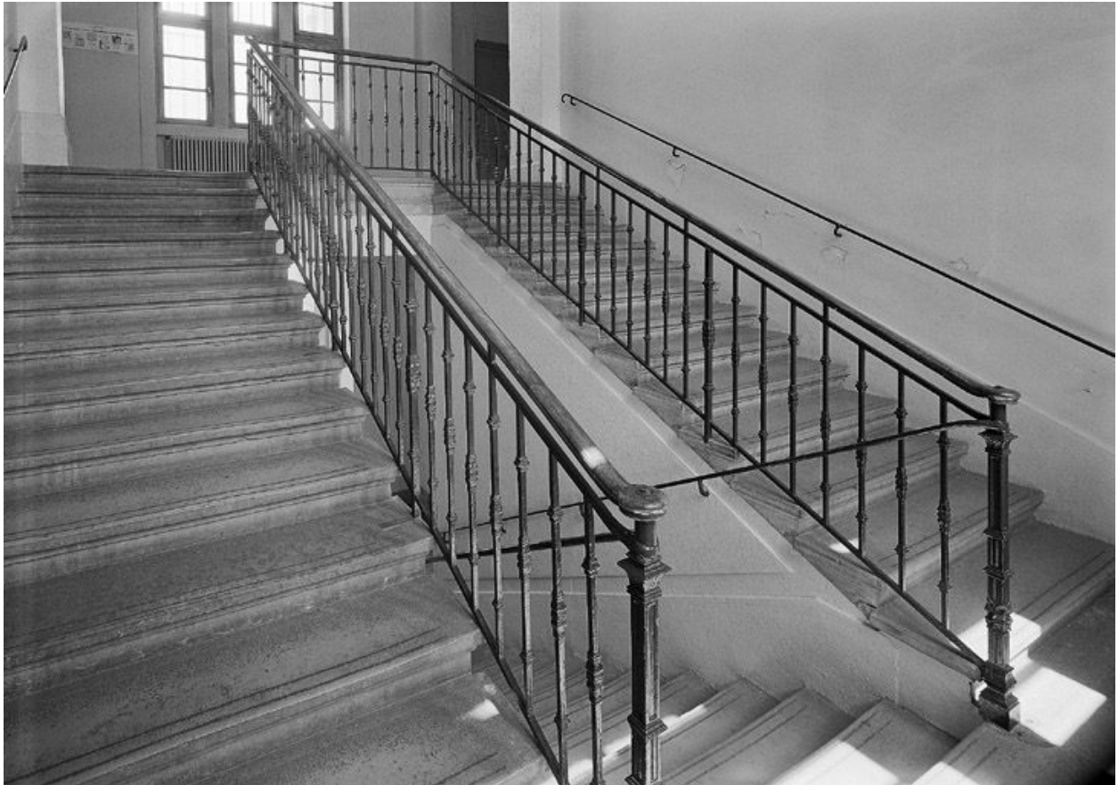
Ecoles primaires : vue de l'escalier tournant à deux volées droites desservant l'aile sud depuis le repos