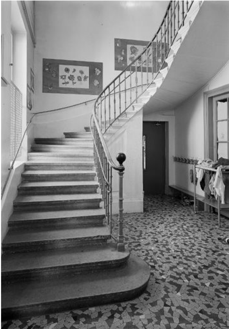
Ecole maternelle : l'escalier