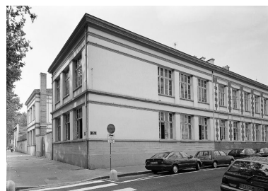
Ecoles primaires : élévation sud et vue partielle de l'élévation Est