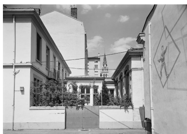
Ecole maternelle : vue des bâtiments prise depuis la cour sud-ouest. A l'arrière-plan, le clocher de l'église Sainte-Blandine IVR82_20016902233P