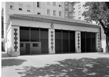
Ecoles primaires : préau situé dans la cour Nord IVR82_20016901099P