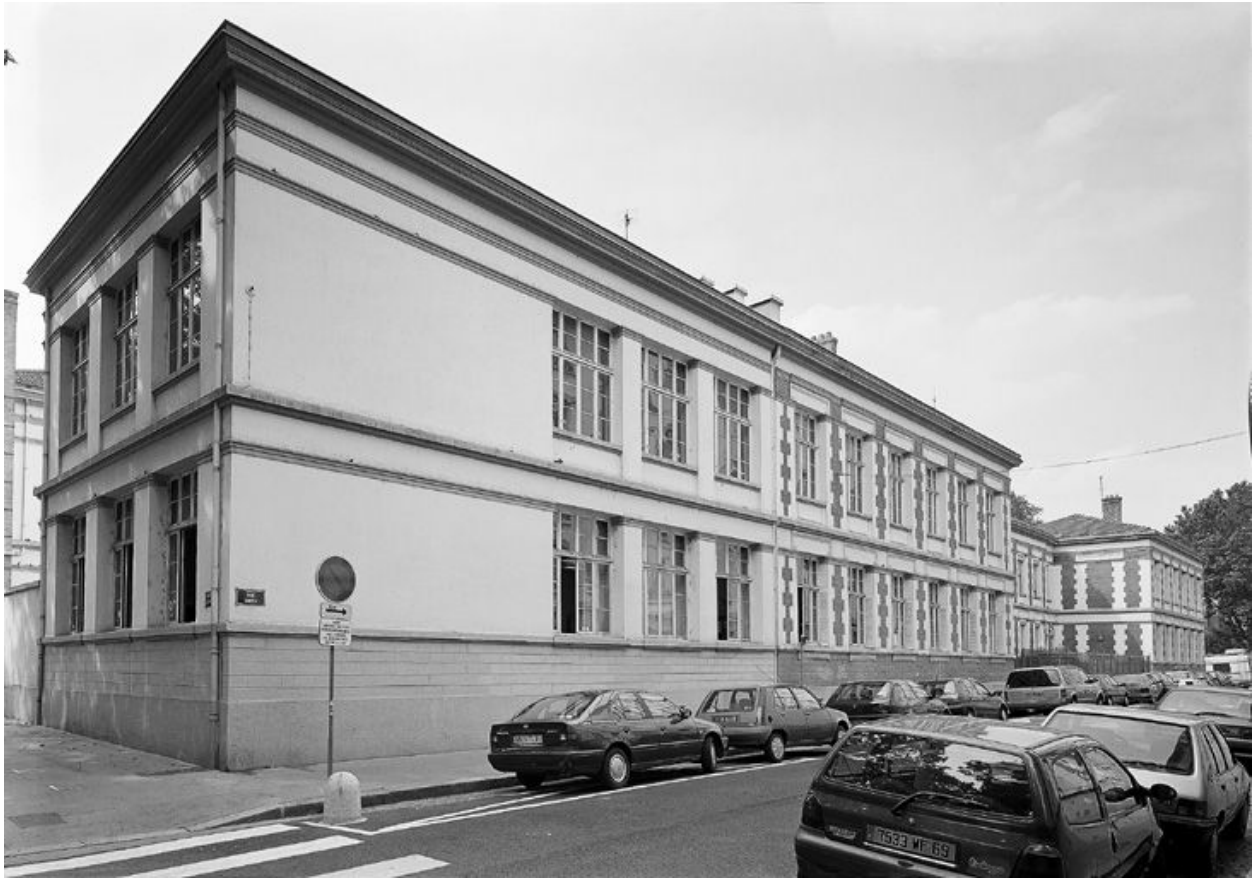
Ecoles primaires : élévation antérieure