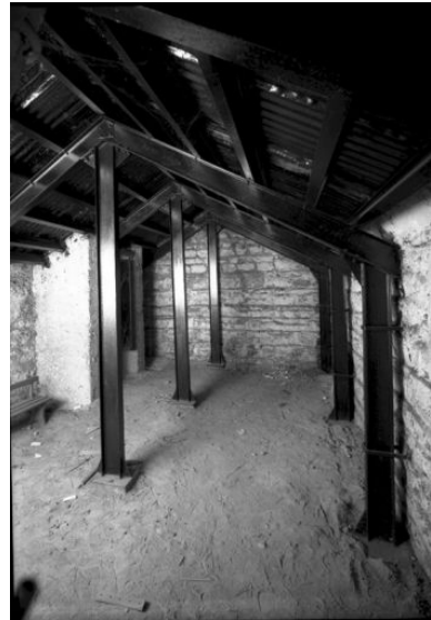
Ecole maternelle : vue partielle d'une cave construite en pierre et renforcée par une charpente métallique IVR82_20016902299P