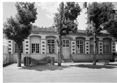
Ecole maternelle : élévation postérieure IVR82_20016902232P