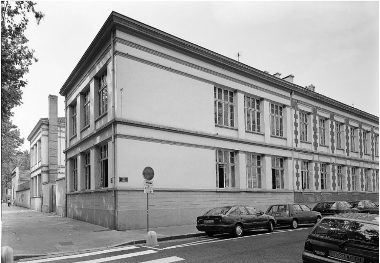
Ecoles primaires : élévation sud et vue partielle de l'élévation Est