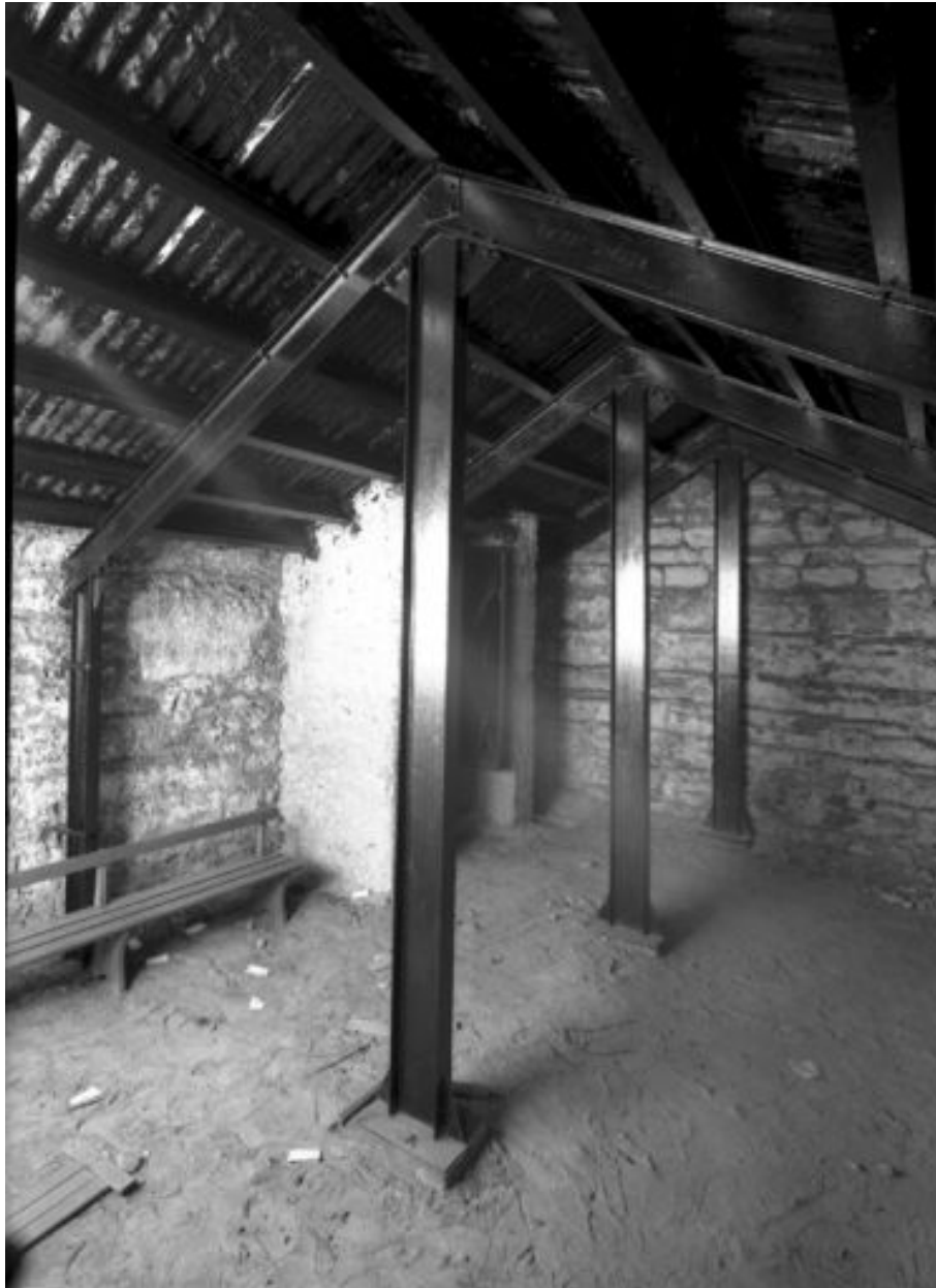
Ecole maternelle : vue partielle d'une cave construite en pierre et renforcée par une charpente métallique