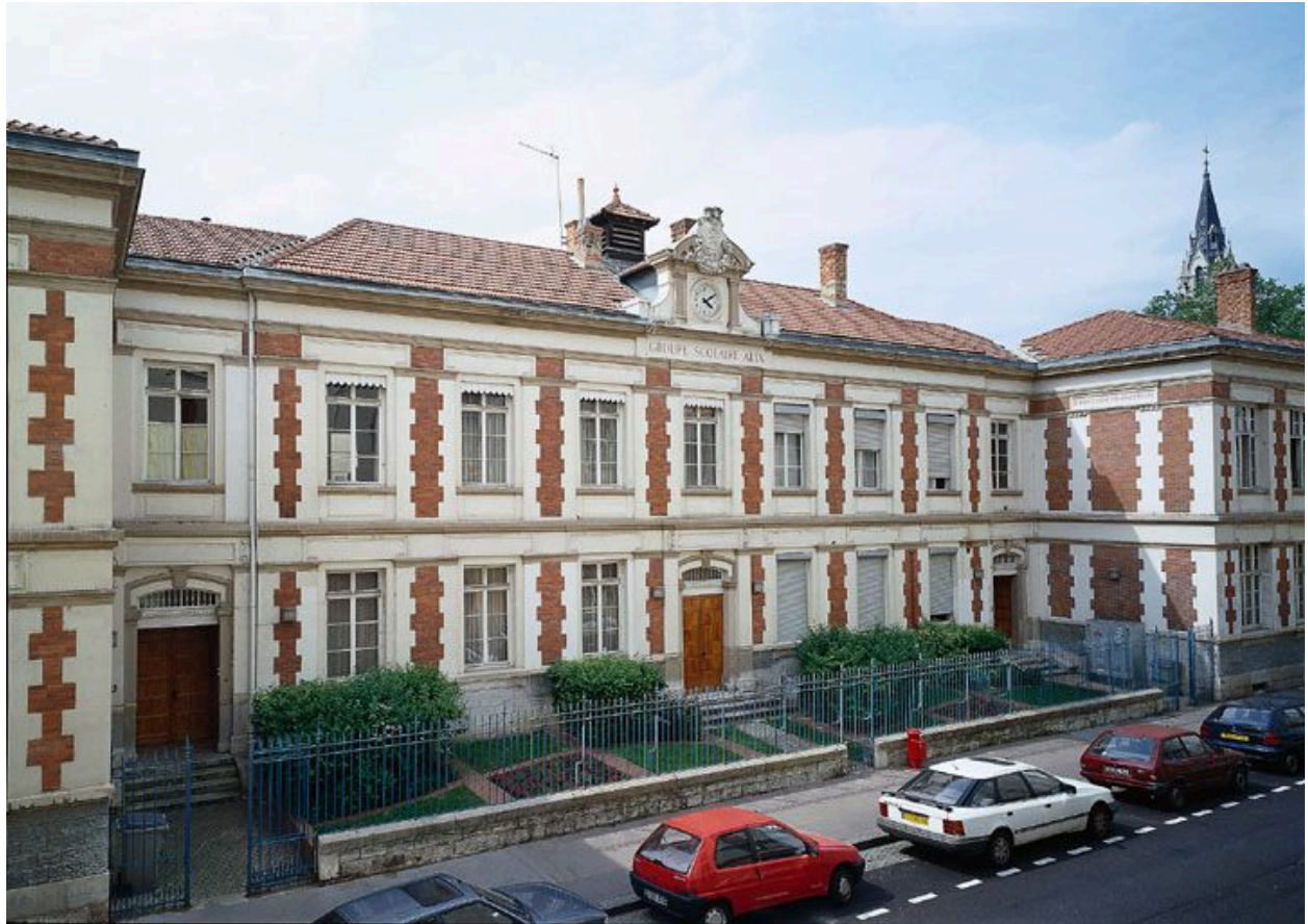
Ecoles primaires : partie centrale de l'élévation antérieure