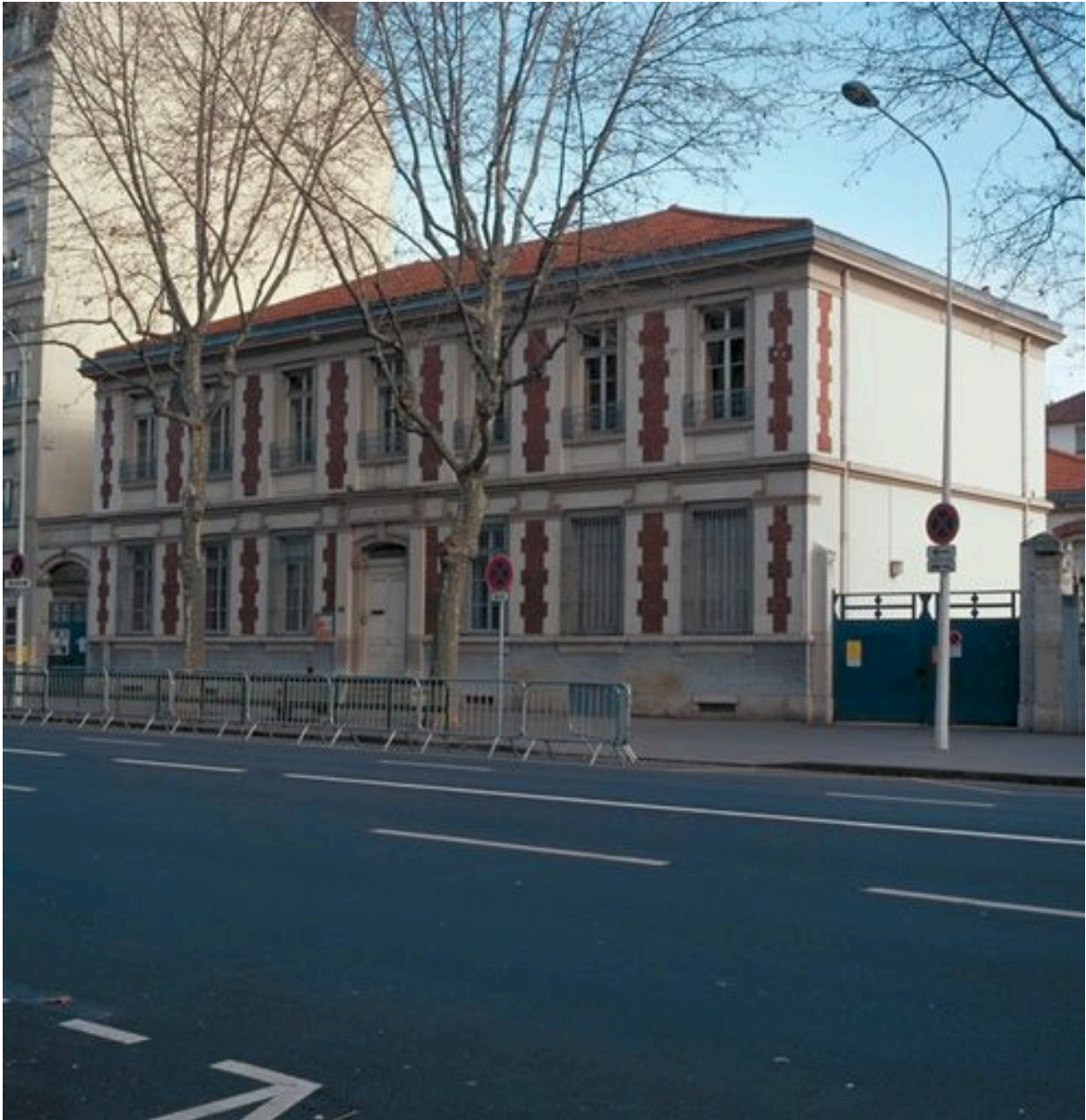
Ecole maternelle : élévation antérieure