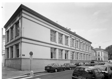
Ecoles primaires : élévation antérieure