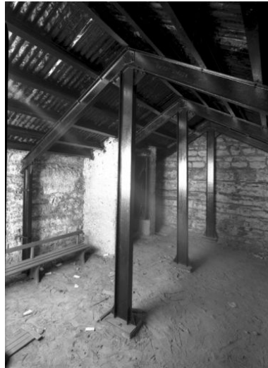
Ecole maternelle : vue partielle d'une cave construite en pierre et renforcée par une charpente métallique IVR82_20016902298P