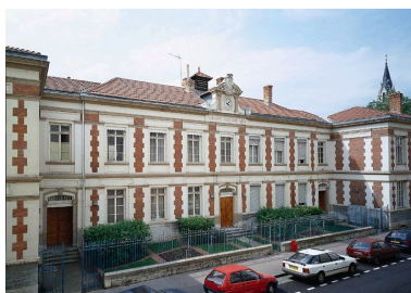
Ecoles primaires : partie centrale de l'élévation antérieure IVR82_20016901096PA