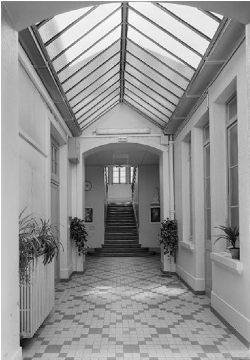
Ecoles primaires : première volée centrale de l'escalier tournant à deux volées droites desservant l'aile sud