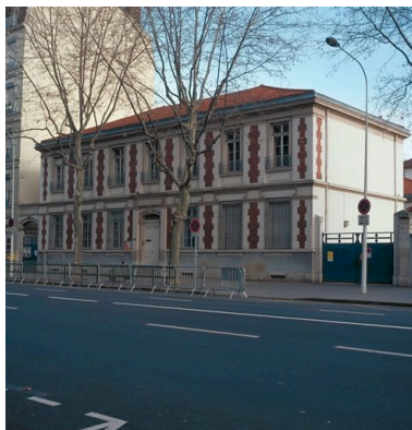
Ecole maternelle : élévation antérieure IVR82_20026900321XA