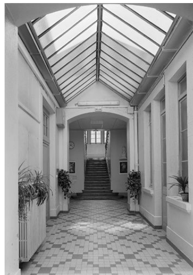
Ecoles primaires : première volée centrale de l'escalier tournant à deux volées droites desservant l'aile sud IVR82_20016901100P