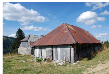
Vue d'ensemble depuis le sud-est. IVR84_20167306726NUCA