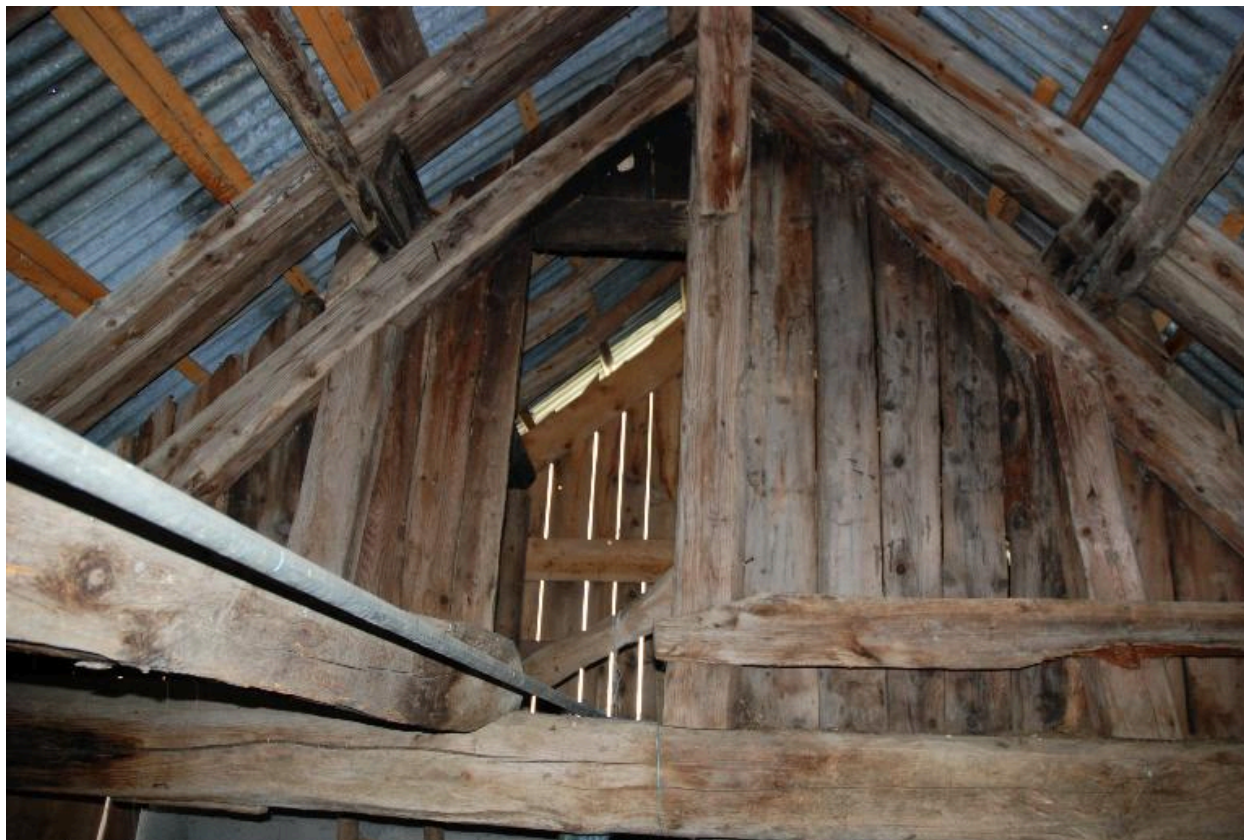
Vue de la charpente de l'étable.