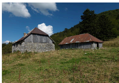
Vue d'ensemble des chalets.