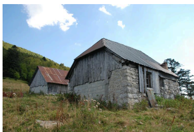
Vue d'ensemble depuis le nord-ouest. IVR84_20167306723NUCA