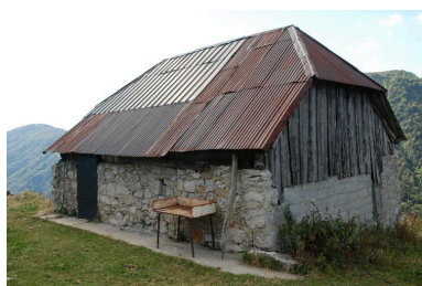
Vue de la façade principale du logis.