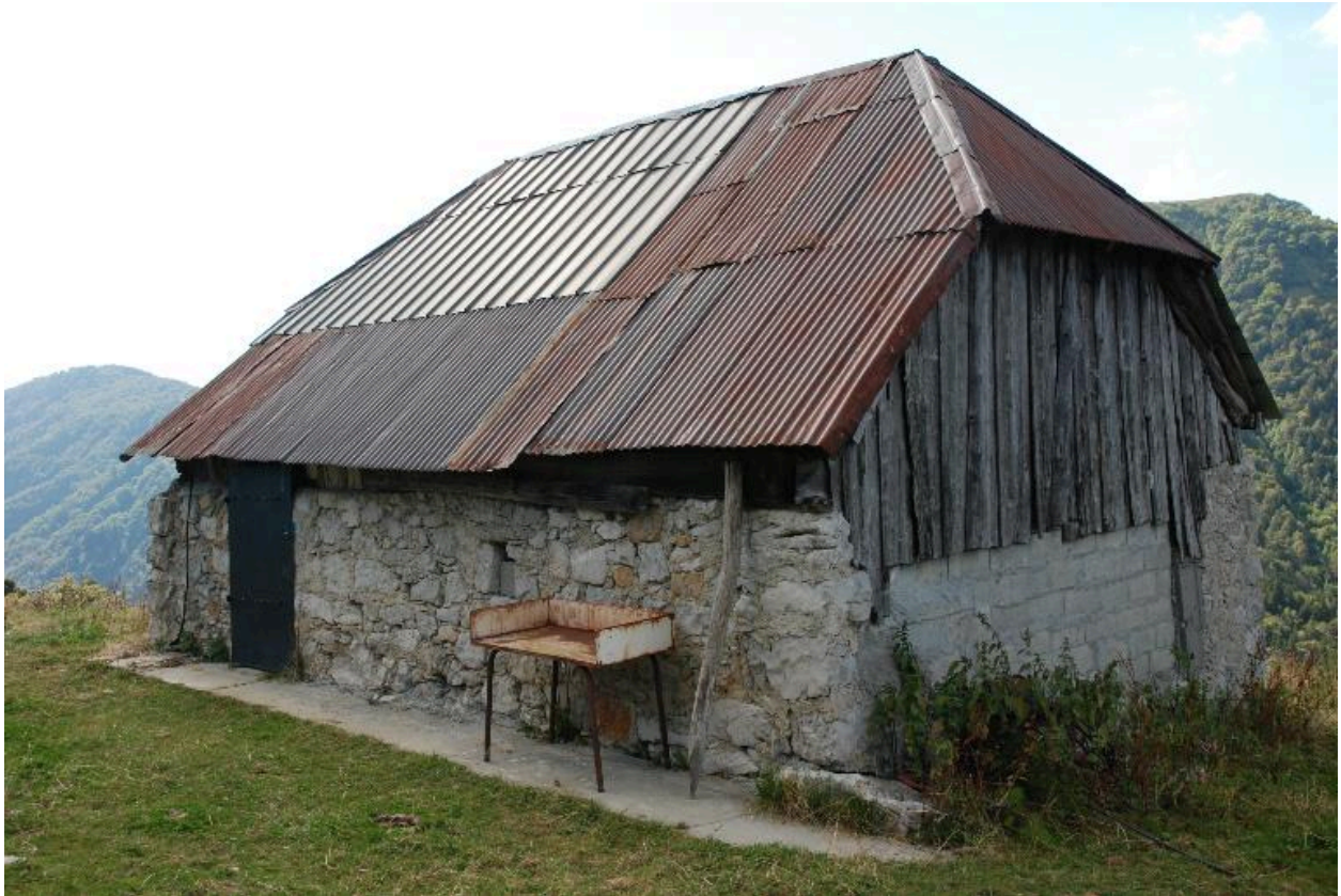
Vue de la façade principale du logis.