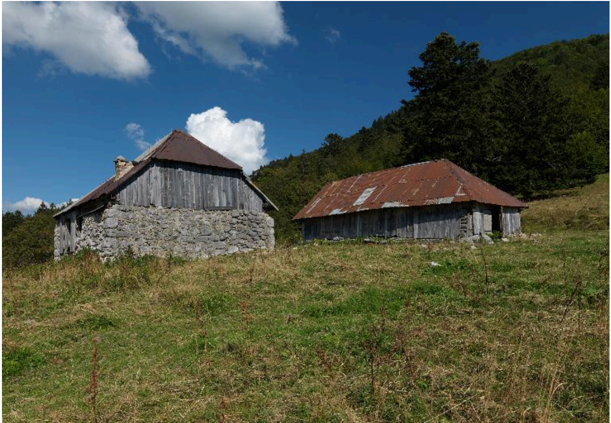
Vue d'ensemble des chalets.