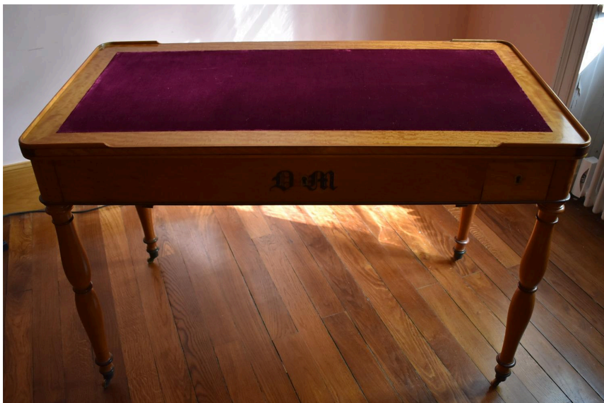
Vue générale - fermée