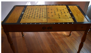
Vue générale - ouverte IVR84_20216301073NUCA