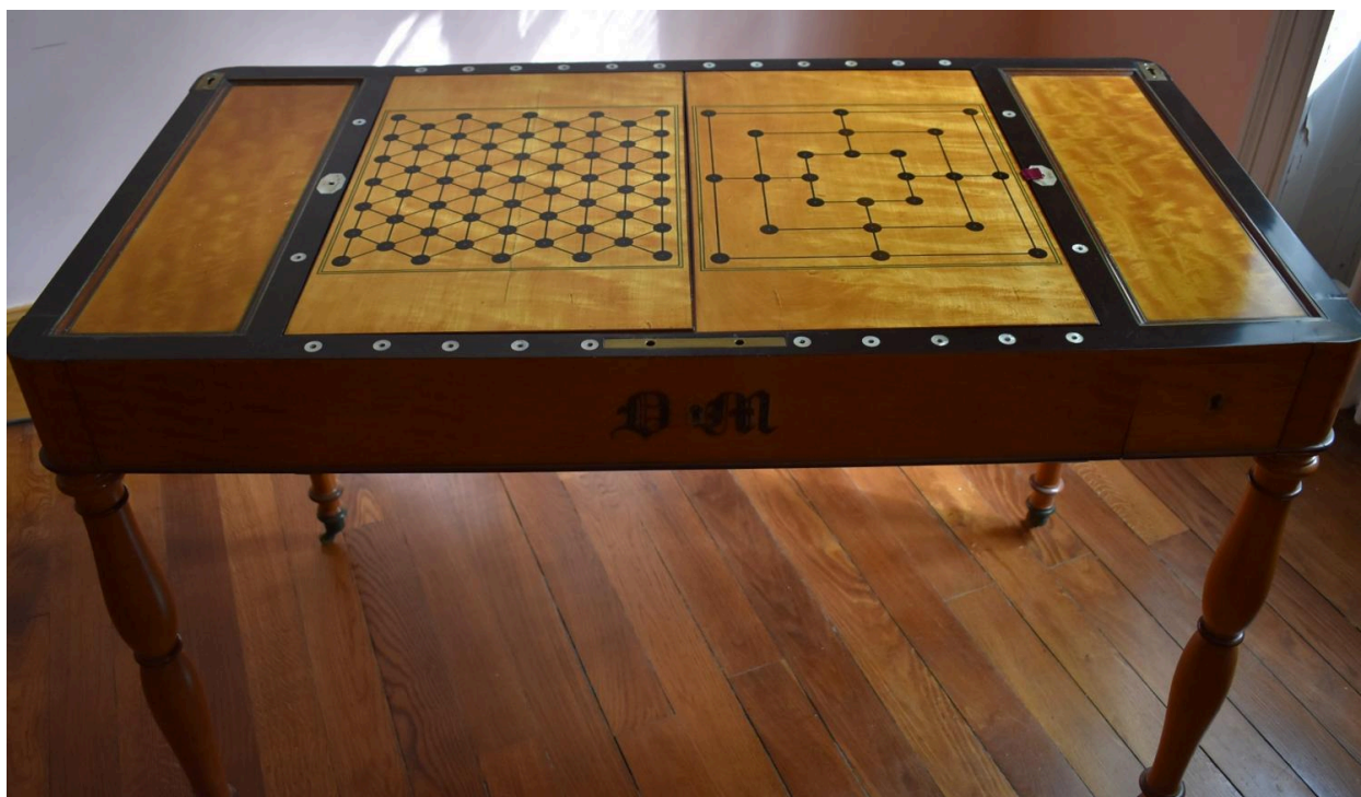
Vue générale - ouverte