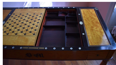
Vue générale - ouverte IVR84_20216301074NUCA