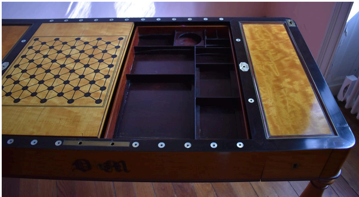
Vue générale - ouverte