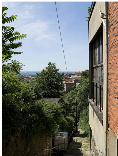
Le chemin, ancienne "croze" utilisée autrefois par les ouvriers de la coutellerie, vu depuis le haut à son départ de la rue de Lyon. IVR83_20116300590NUC4A