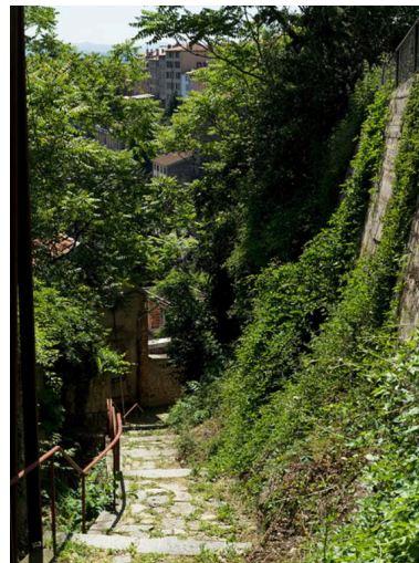
Le chemin, dans sa moitié inférieure. IVR83_20116300568NUC4A