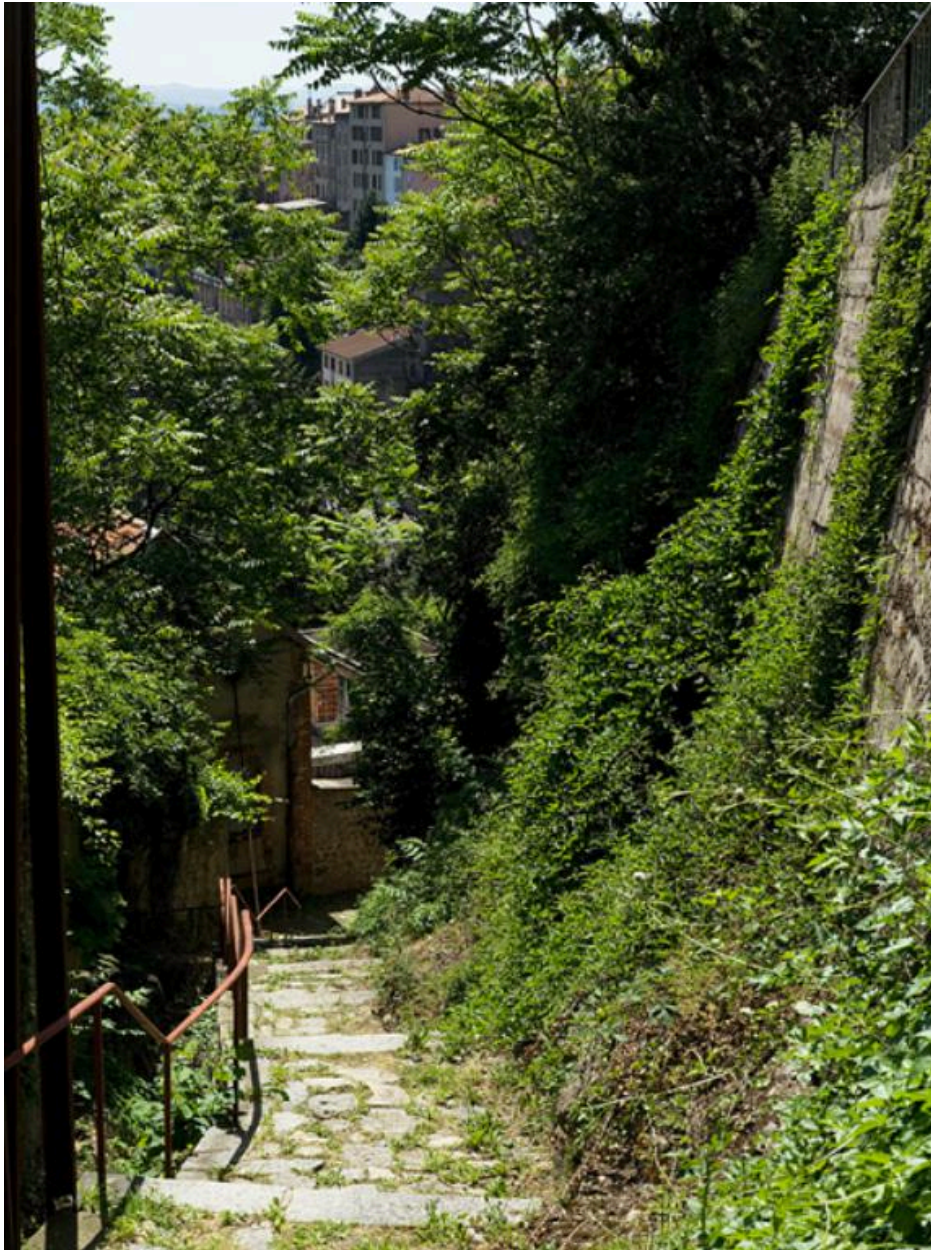
Le chemin, dans sa moitié inférieure.