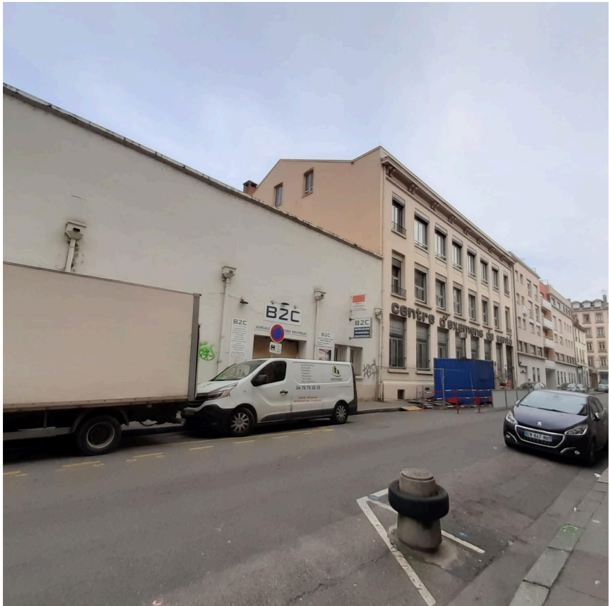
Vue d'ensemble est