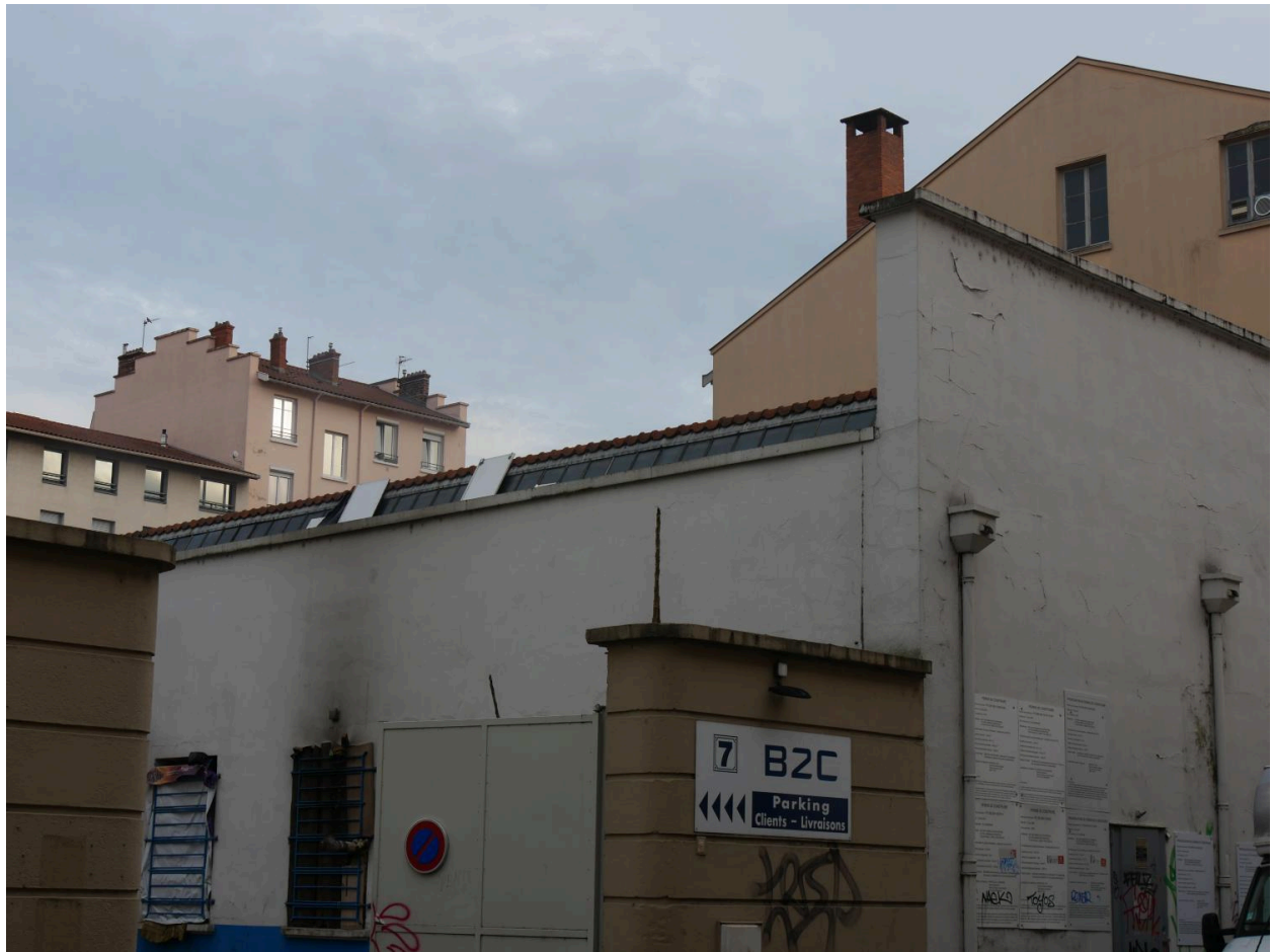
Vue est de la façade