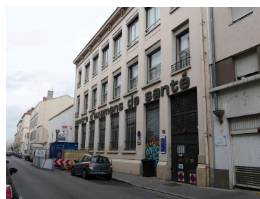
vue d'ensemble façade IVR84_20246900048NUCA