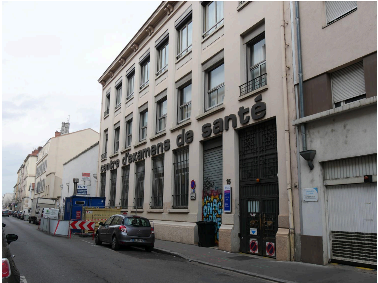
vue d'ensemble façade