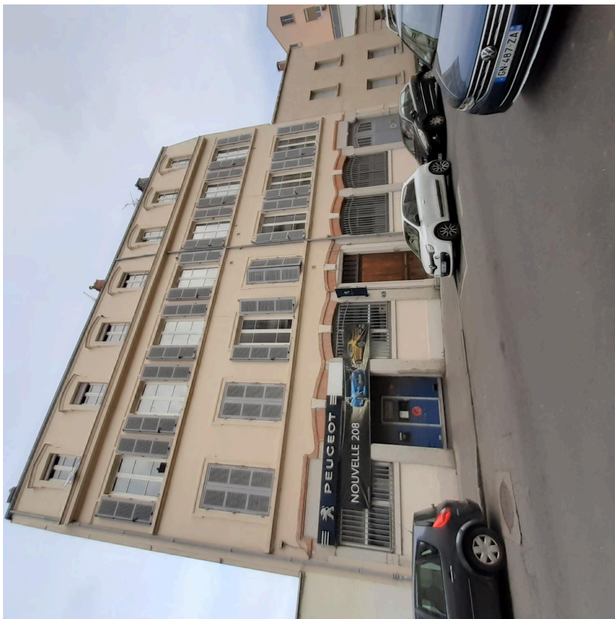
Vue de la façade principale