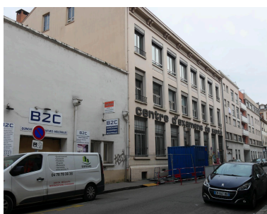
vue d'ensemble façade IVR84_20246900049NUCA