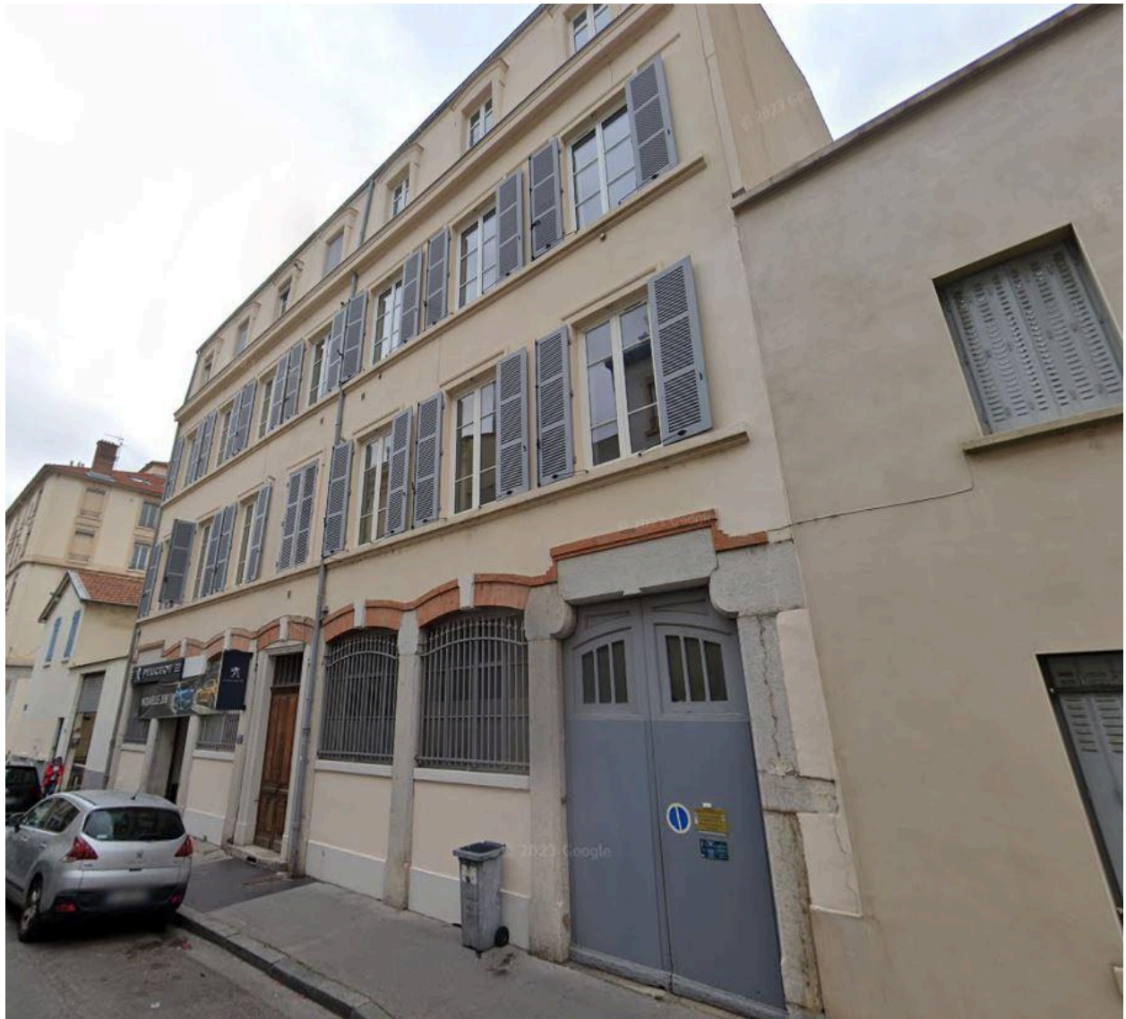
Vue du bâtiment administratif