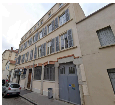
Vue du bâtiment administratif IVR84_20246900018NUCA