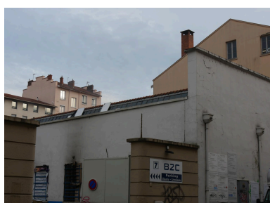
Vue est de la façade