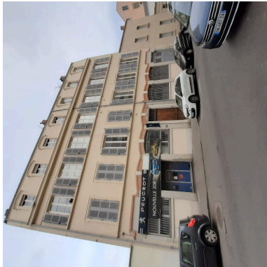
Vue de la façade principale IVR84_20246900053NUCA

IVR84_20246900052NUCA