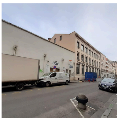
Vue d'ensemble est