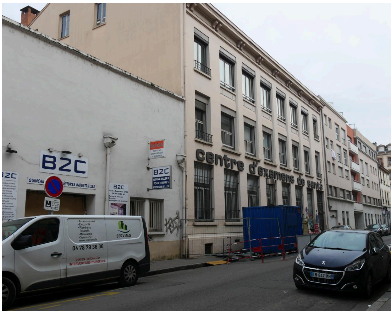
vue d'ensemble façade