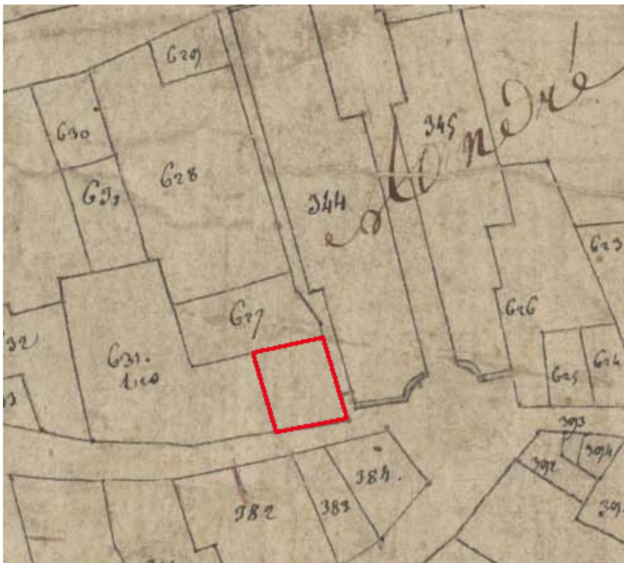
Extrait du plan cadastral de 1809, parcelle E 627.