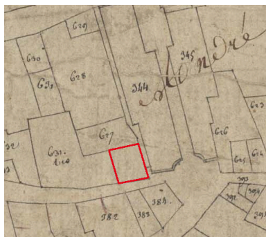
Extrait du plan cadastral de 1809, parcelle E 627.