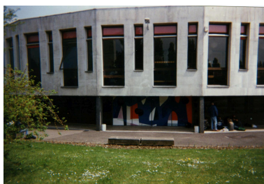
L'oeuvre en 1996. IVR84_20220100339NUCA