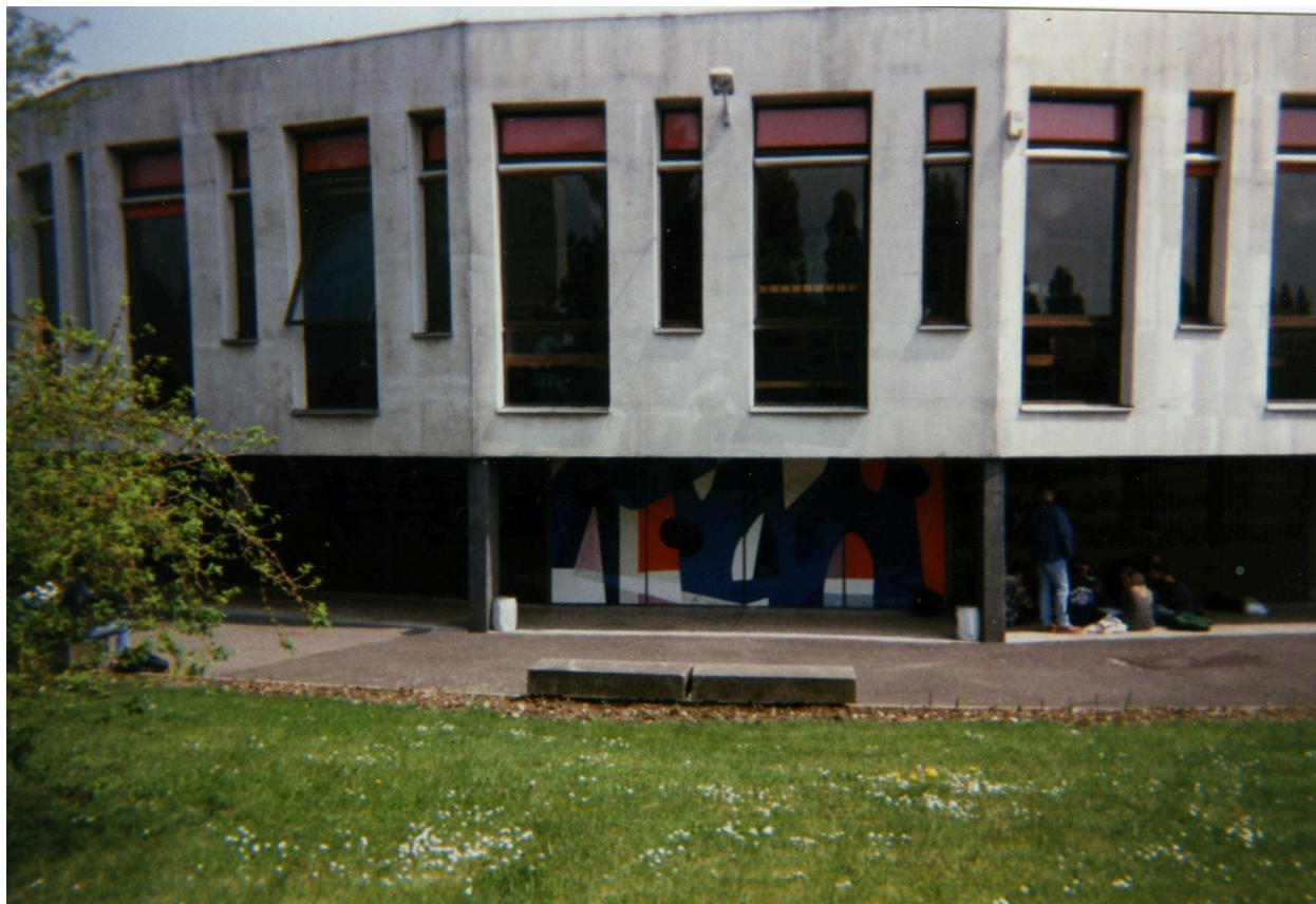
L'oeuvre en 1996.