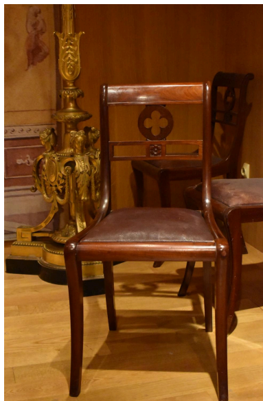
Vue générale d'une chaise IVR84_20216301415NUC4A