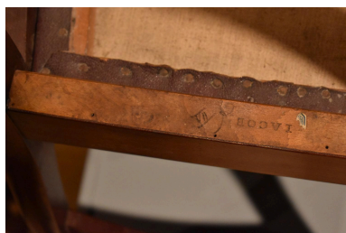
Vue de l'estampille IVR84_20216301418NUC4A