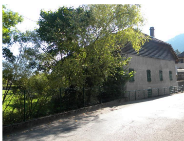
Vue de trois-quarts nord-est depuis la rue IVR82_20157401502NUCA