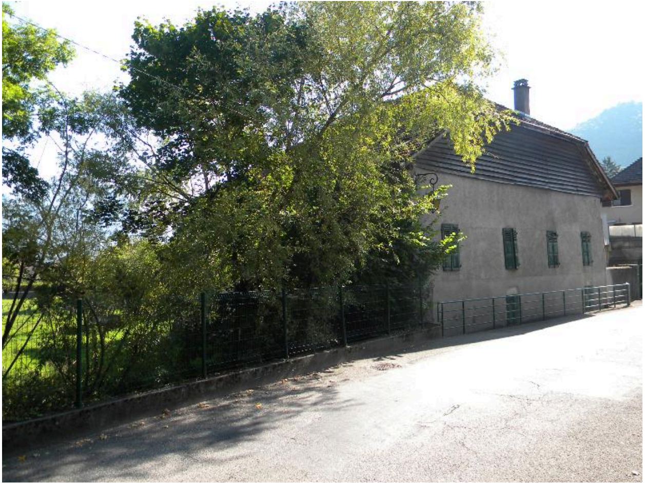
Vue de trois-quarts nord-est depuis la rue