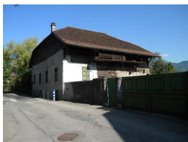
Vue d'ensemble IVR82_20157401501NUCA