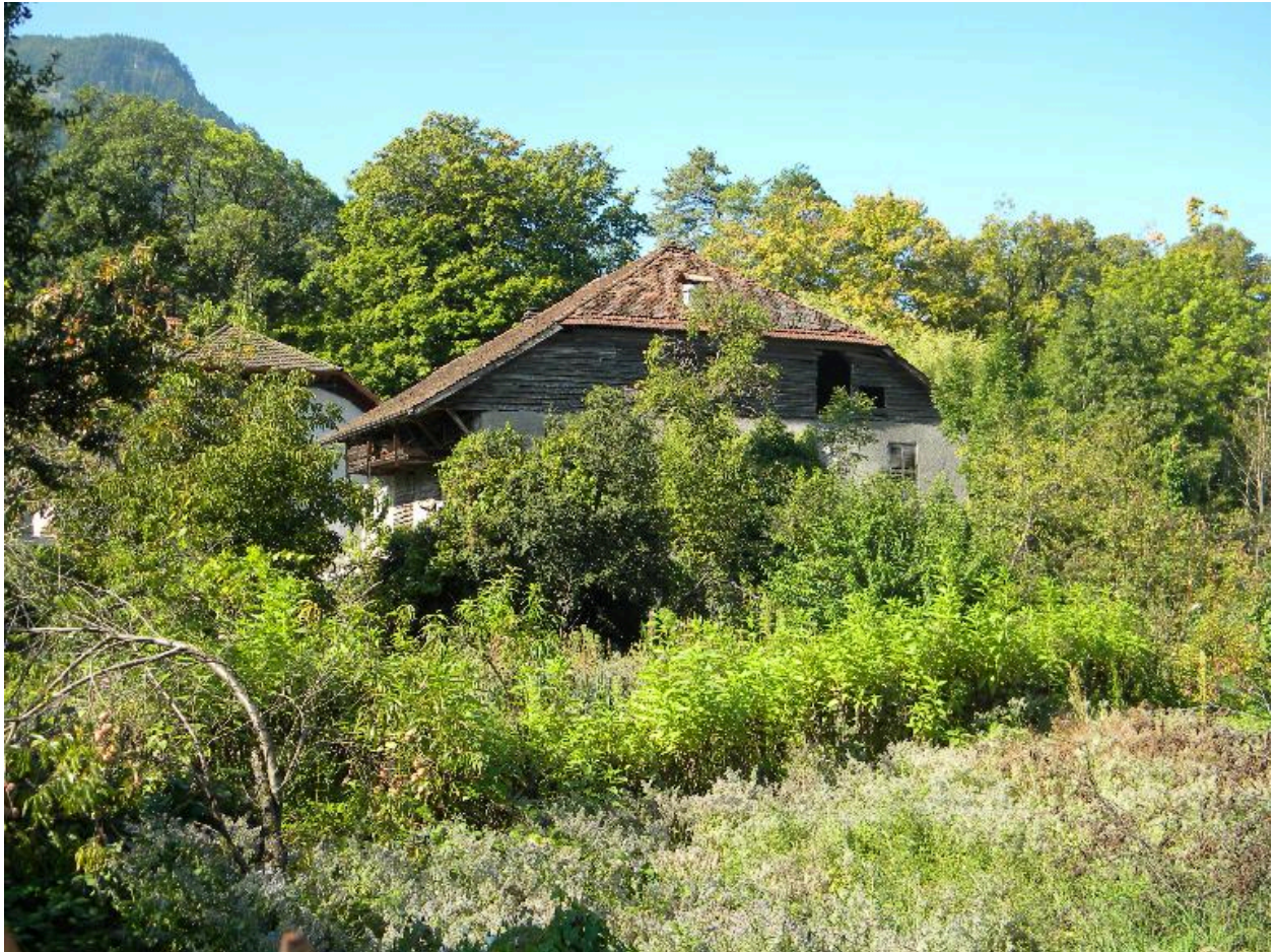
Vue du pignon nord depuis la rue de la gare.