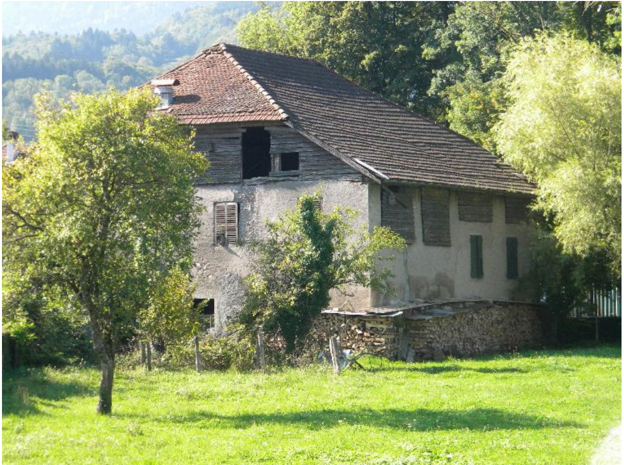
Vue de la façade arrière sur cour.