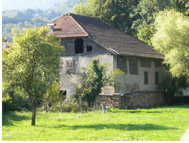
Vue de la façade arrière sur cour. IVR82_20157401504NUCA