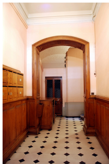
L'allée IVR82_20096904844NUCA