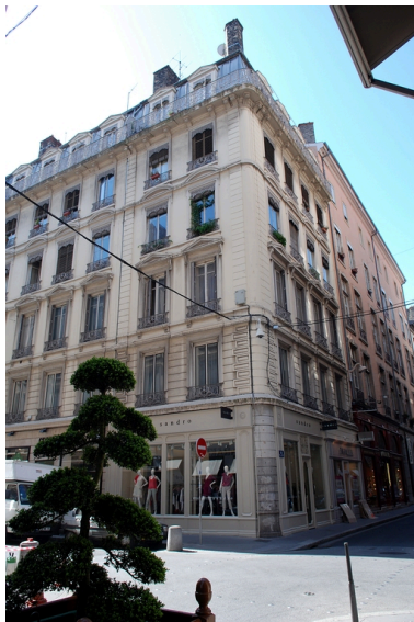
Vue générale depuis la rue Emile-Zola IVR82_20096904841NUCA