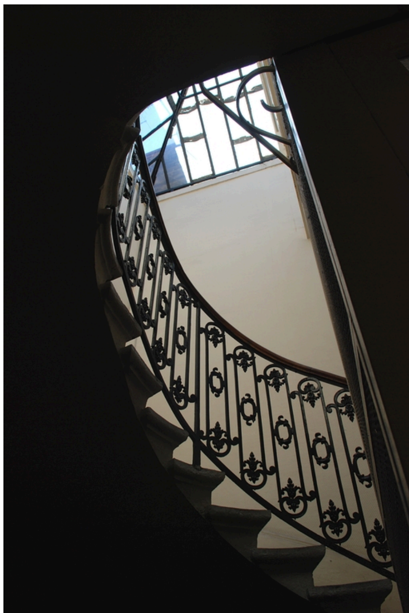
L'escalier : verrière et garde-corps