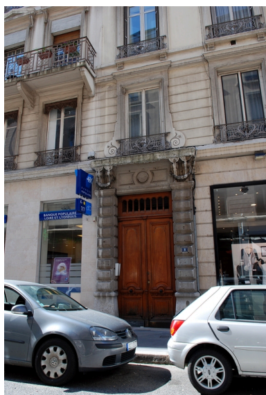
Elévation antérieure : la porte IVR82_20096904842NUCA