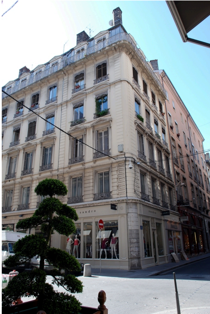
Vue générale depuis la rue Emile-Zola