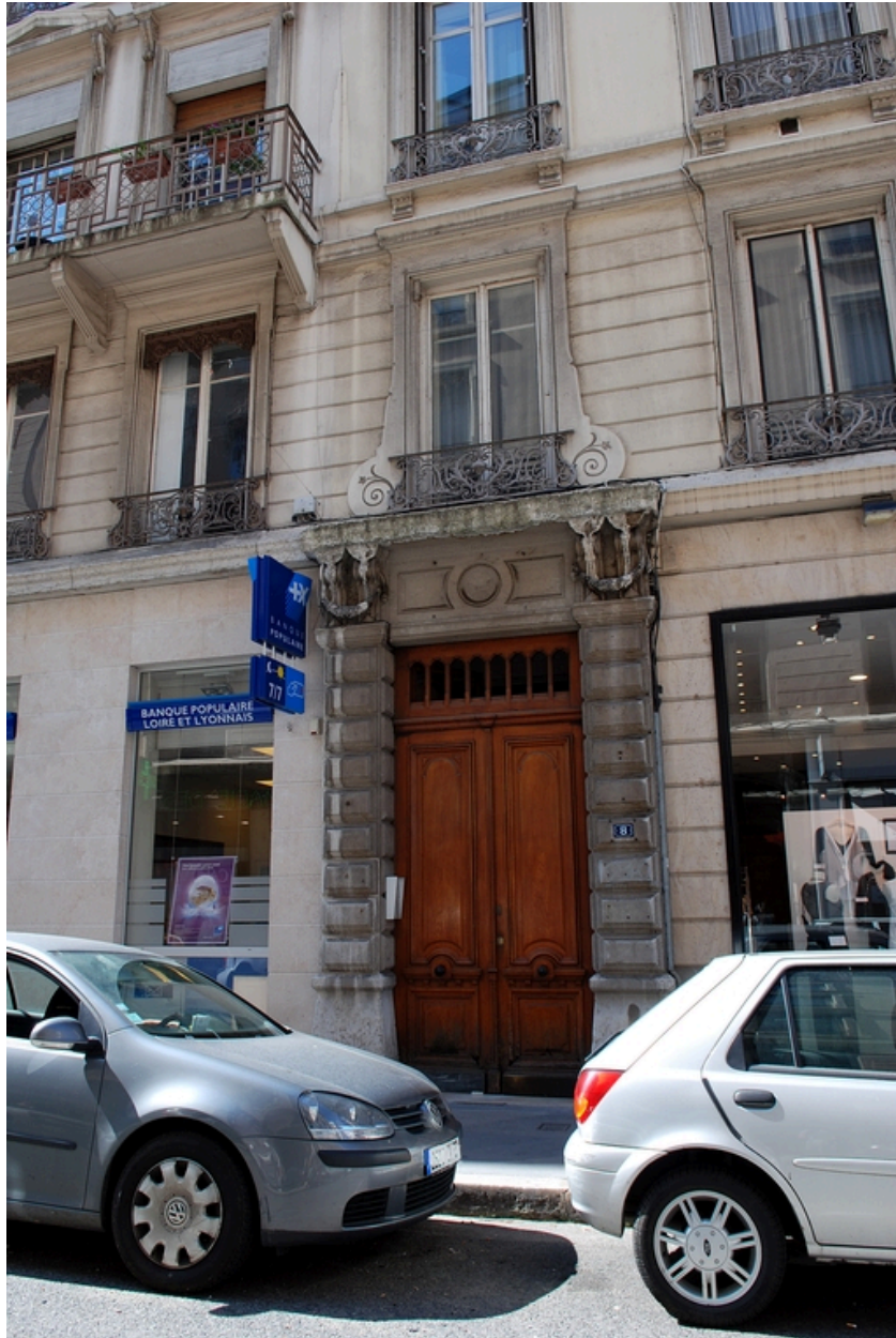
Elévation antérieure : la porte