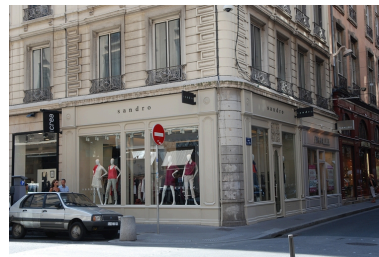
Devanture d'angle IVR82_20096904846NUCA