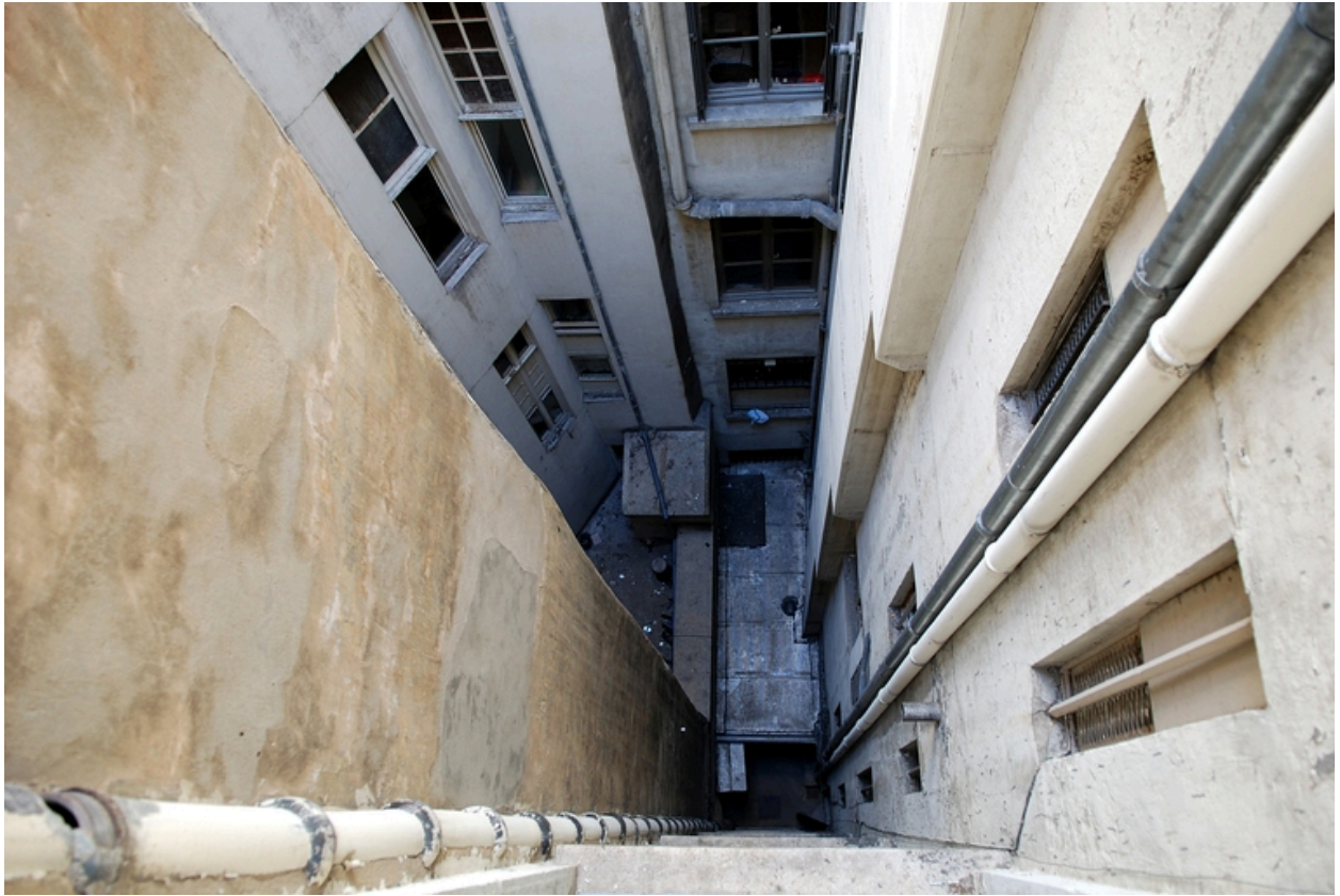
La cour en plongée