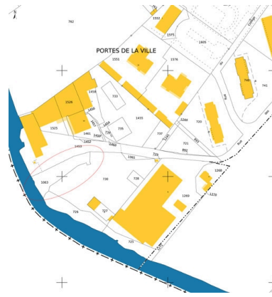
Cadastre actuel, 2007 IVR82_20107300452NUCA