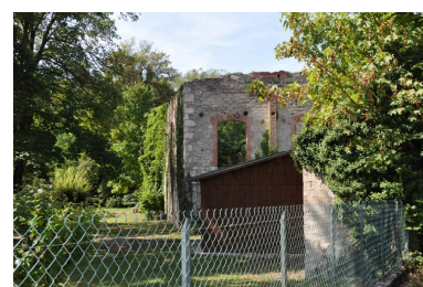
Vue de la façade nord-est IVR82_20107300454NUCA