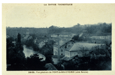
La scierie est au premier plan à droite de la cheminée, carte postale du début du 20e siècle