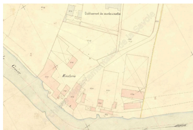
Premier cadastre français, 1909. Cadastre de 1909 AD Savoie. 3P 7200 IVR82_20107300450NUCA