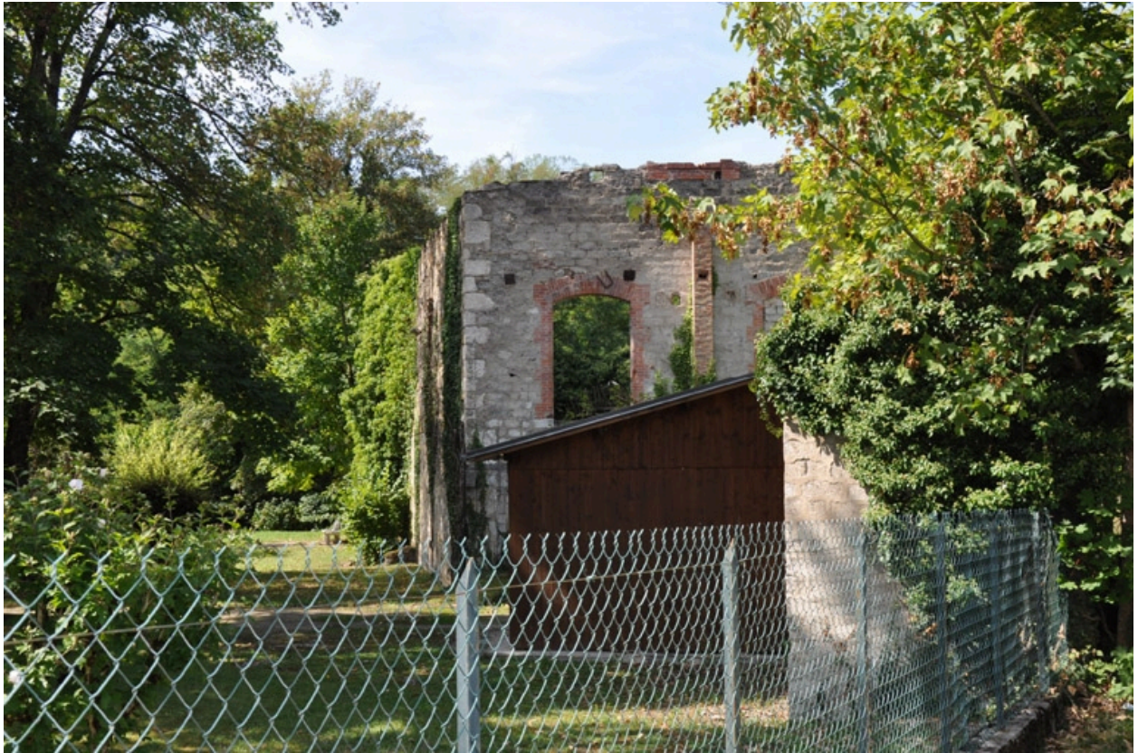
Vue de la façade nord-est