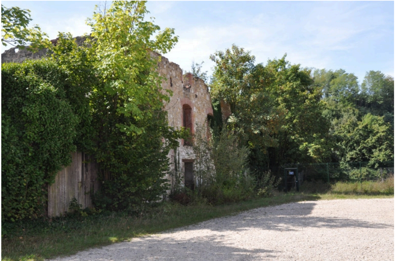
Vue générale de l'ancienne scierie, façade nord-ouest