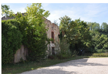
Vue générale de l'ancienne scierie, façade nord-ouest IVR82_20107300453NUCA