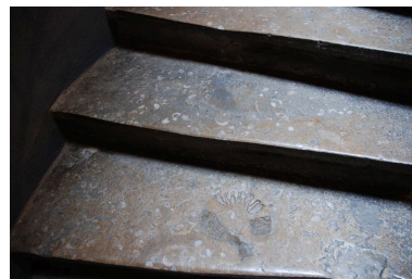
Détail d'une marche : un fossile dans le calcaire. IVR82_20136900038NUCA