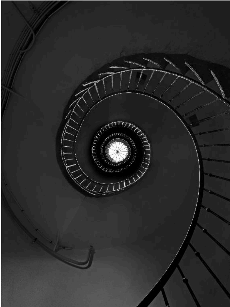
Vue de l'escalier en contre-plongée