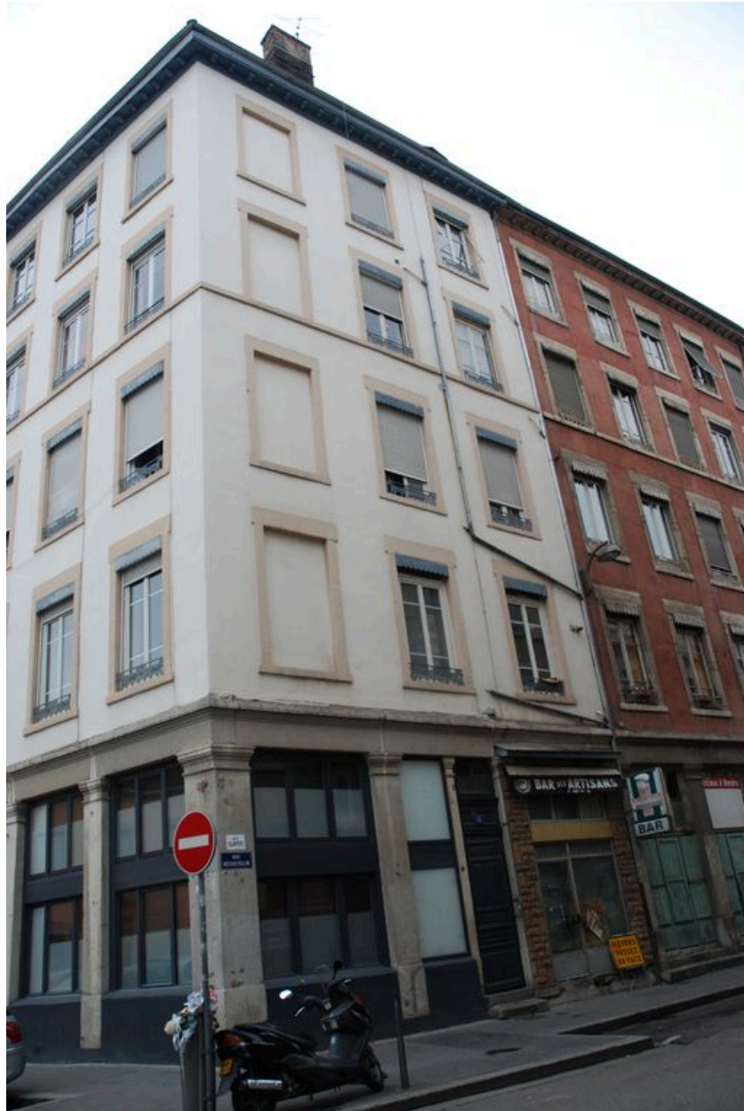
Elévation est, rue Béchevelin