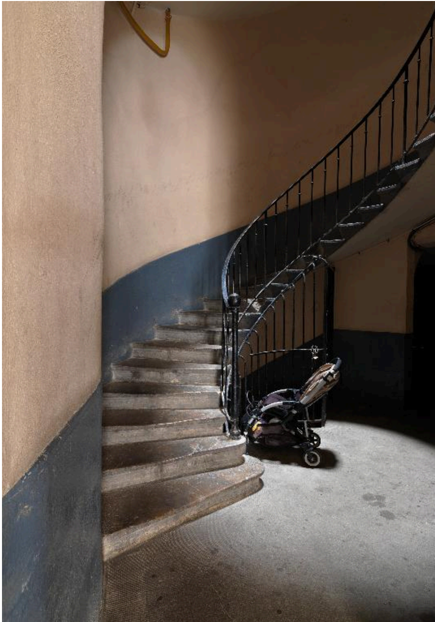
Vue intérieure : le départ de l'escalier