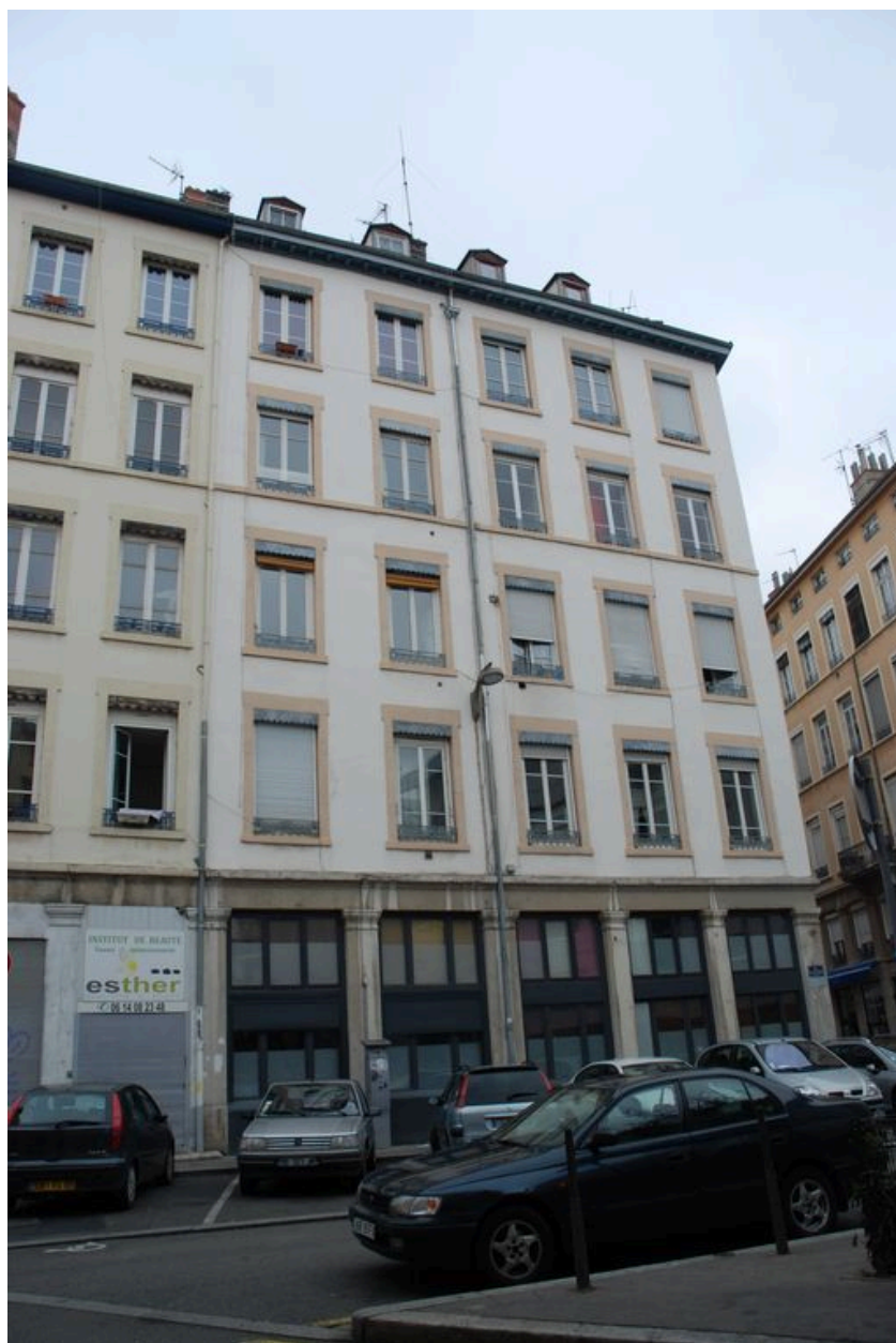
Elévation sud, place du Commandant-Claude-Bulard