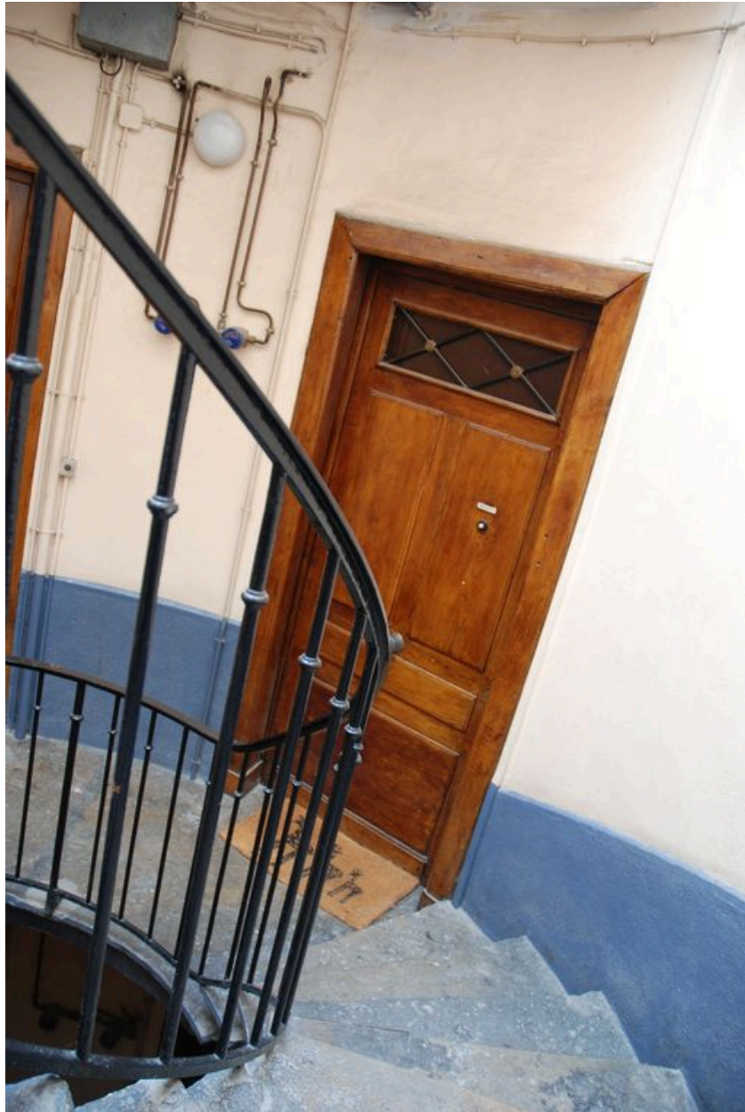
Vue intérieure, une porte palière