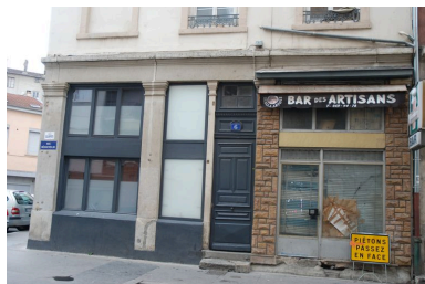
Elévation sur la rue Béchevelin, vue du rez-de-chaussée IVR82_20136900020NUCA