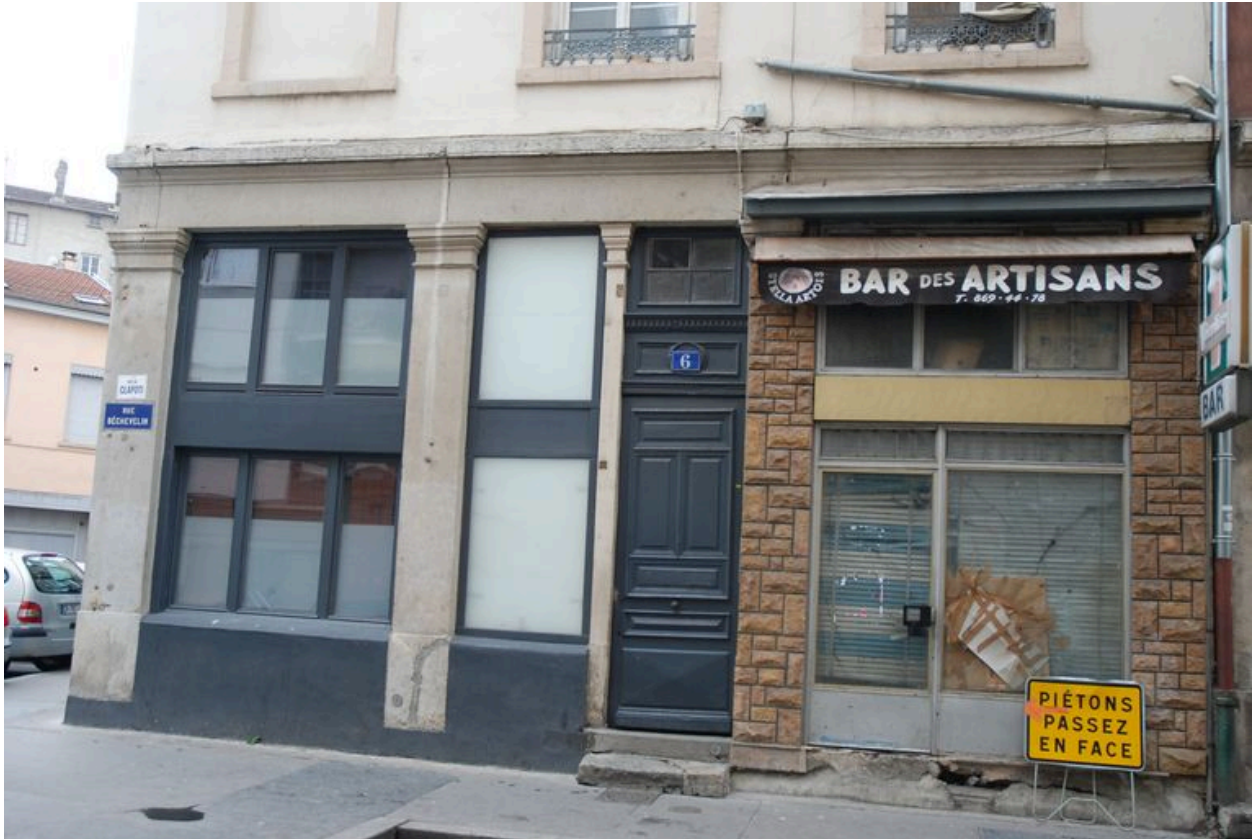
Elévation sur la rue Béchevelin, vue du rez-de-chaussée