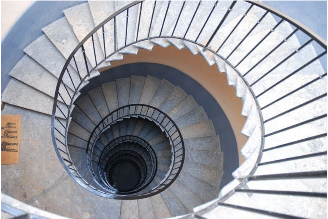
Vue de l'escalier en plongée