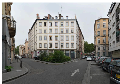
Vue d'ensemble des 4-6 rue Béchevelin, depuis la place du Commandant-Bulard