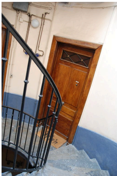
Vue intérieure, une porte palière IVR82_20136900040NUCA