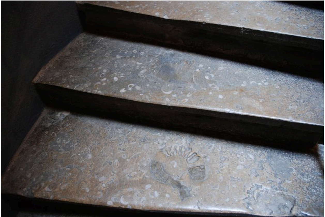
Détail d'une marche : un fossile dans le calcaire.