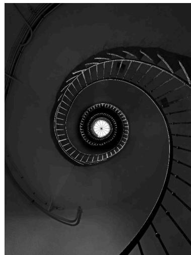
Vue de l'escalier en contre-plongée IVR84_20166901447NUCAQ