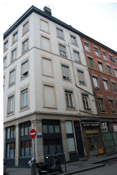
Elévation est, rue Béchevelin