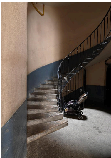
Vue intérieure : le départ de l'escalier IVR84_20166901446NUCA