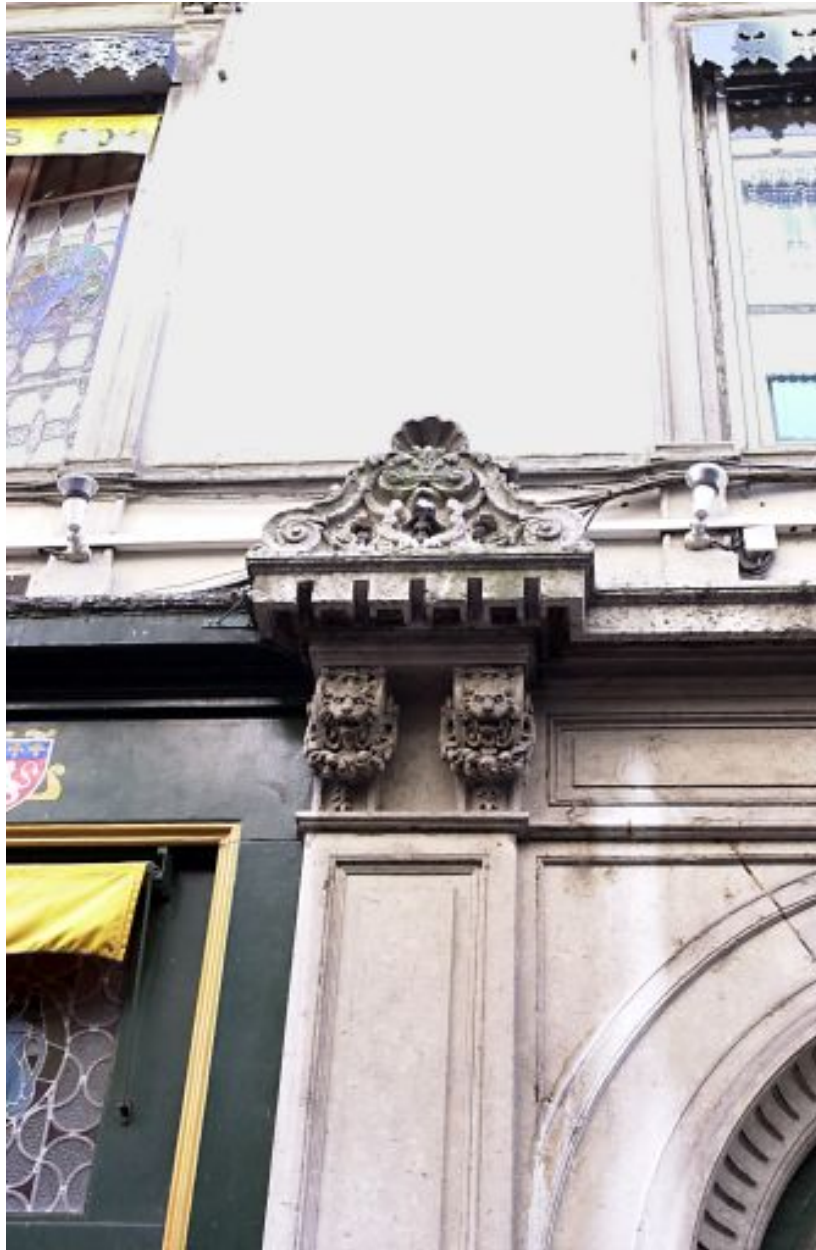
Façade principale, détail de la porte