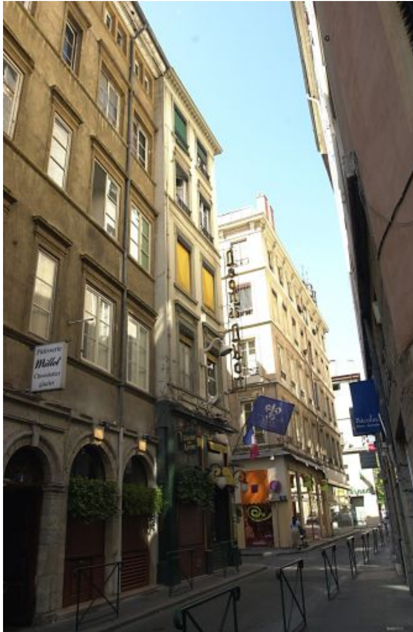
Façade sur la rue du Plâtre