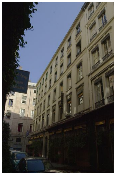
Façade principale sur la rue Pléney, vue générale IVR82_20046900190NUCA