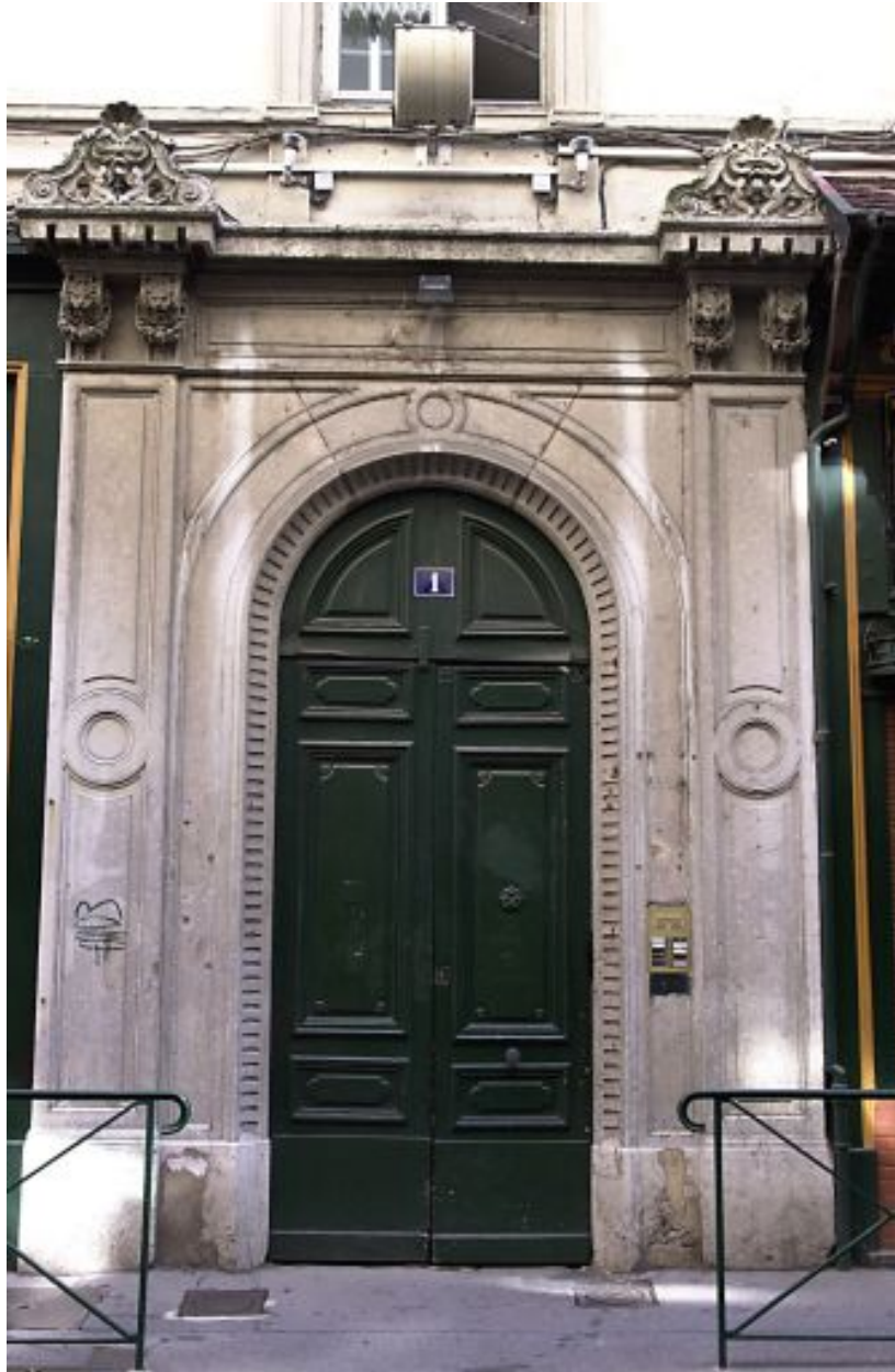
Façade principale, porte