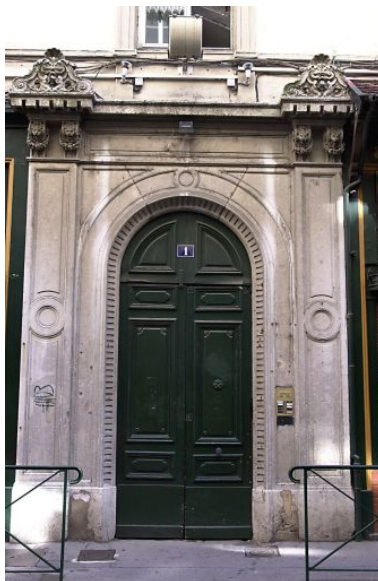
Façade principale, porte IVR82_20046900191NUCA