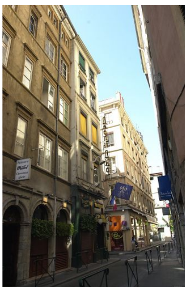
Façade sur la rue du Plâtre