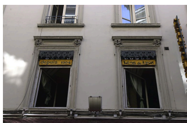
Façade principale, détail de deux fenêtres du premier étage IVR82_20046900193NUCA