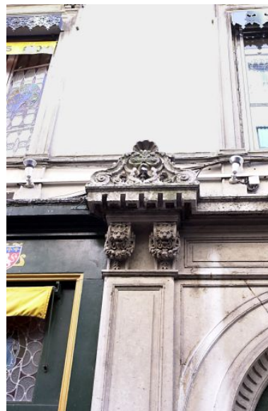
Façade principale, détail de la porte