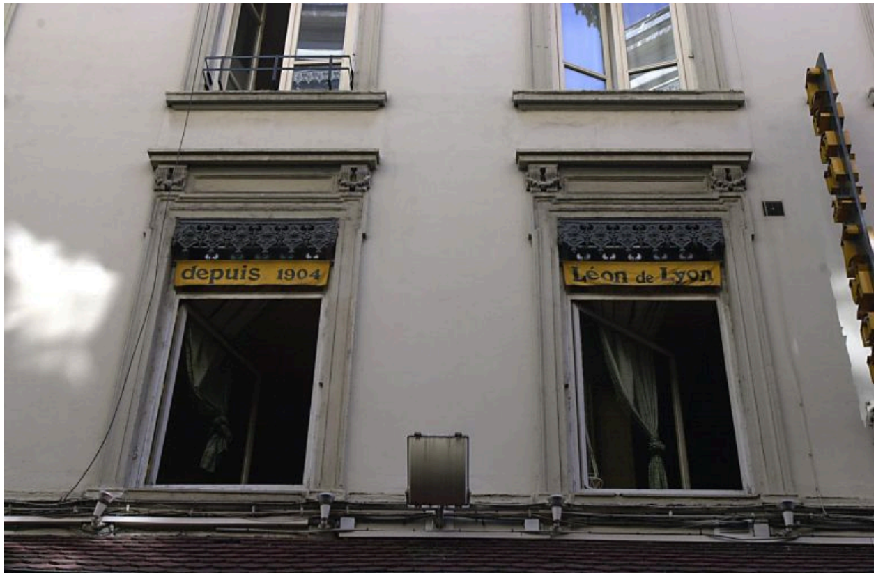
Façade principale, détail de deux fenêtres du premier étage