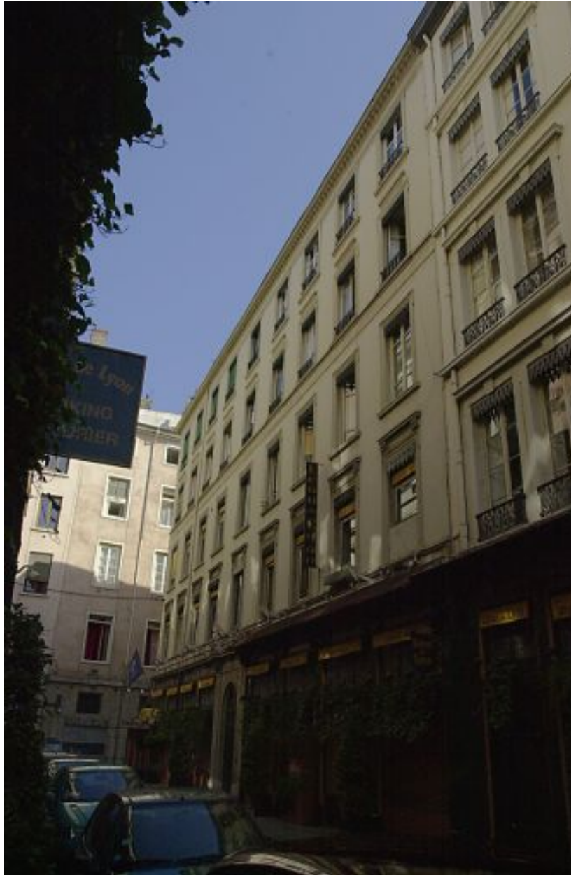
Façade principale sur la rue Pléney, vue générale