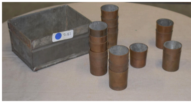
Vue générale IVR84_20226302442NUC4A