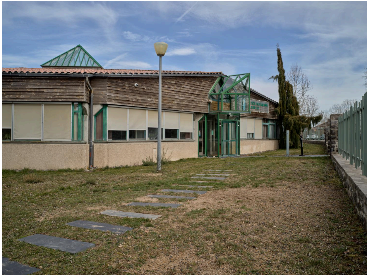
Vue de l'entrée principale