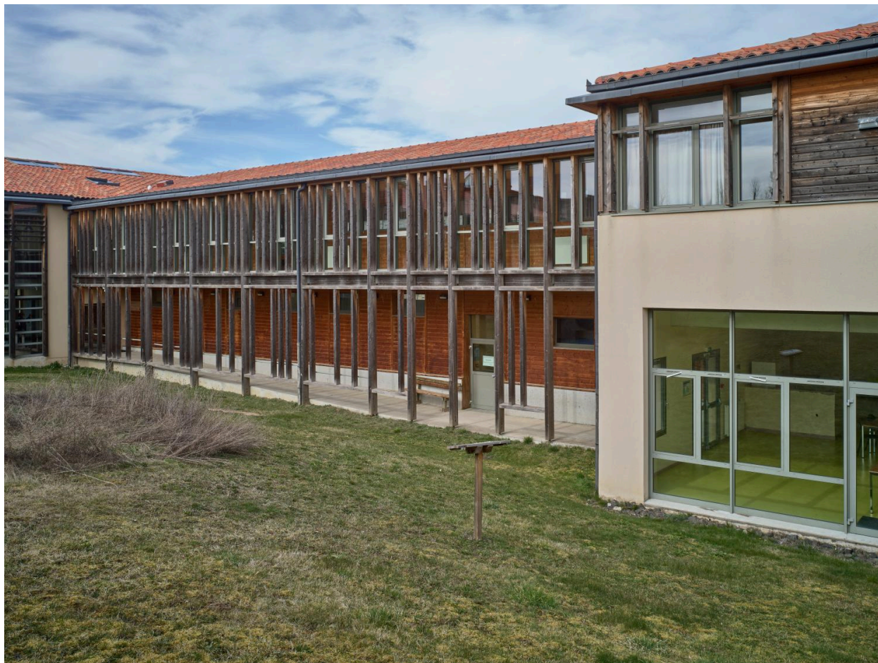
Vue de la galerie extérieure