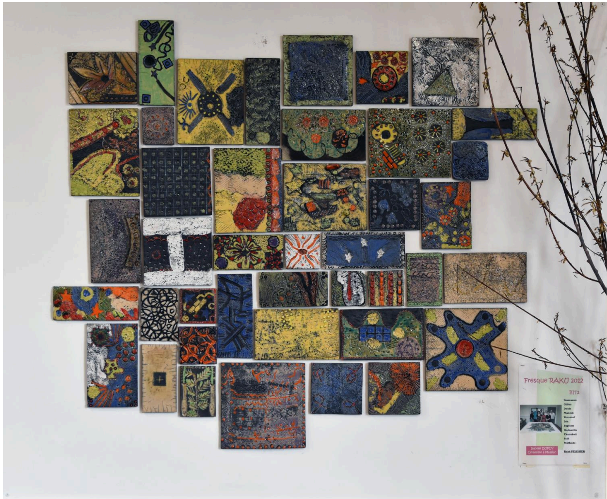
Travaux d'élèves : "Raku", ensemble de plaques de céramique émaillée, 2012 (avec Isabelle Dupuy, céramiste à Massiac)