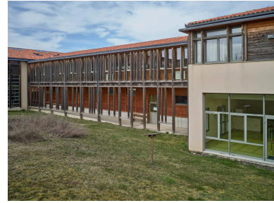
Vue de la galerie extérieure