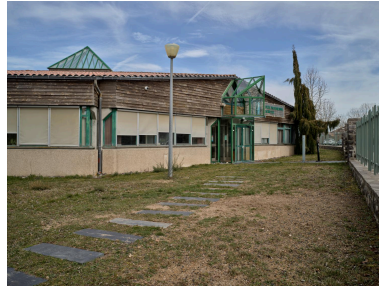
Vue de l'entrée principale