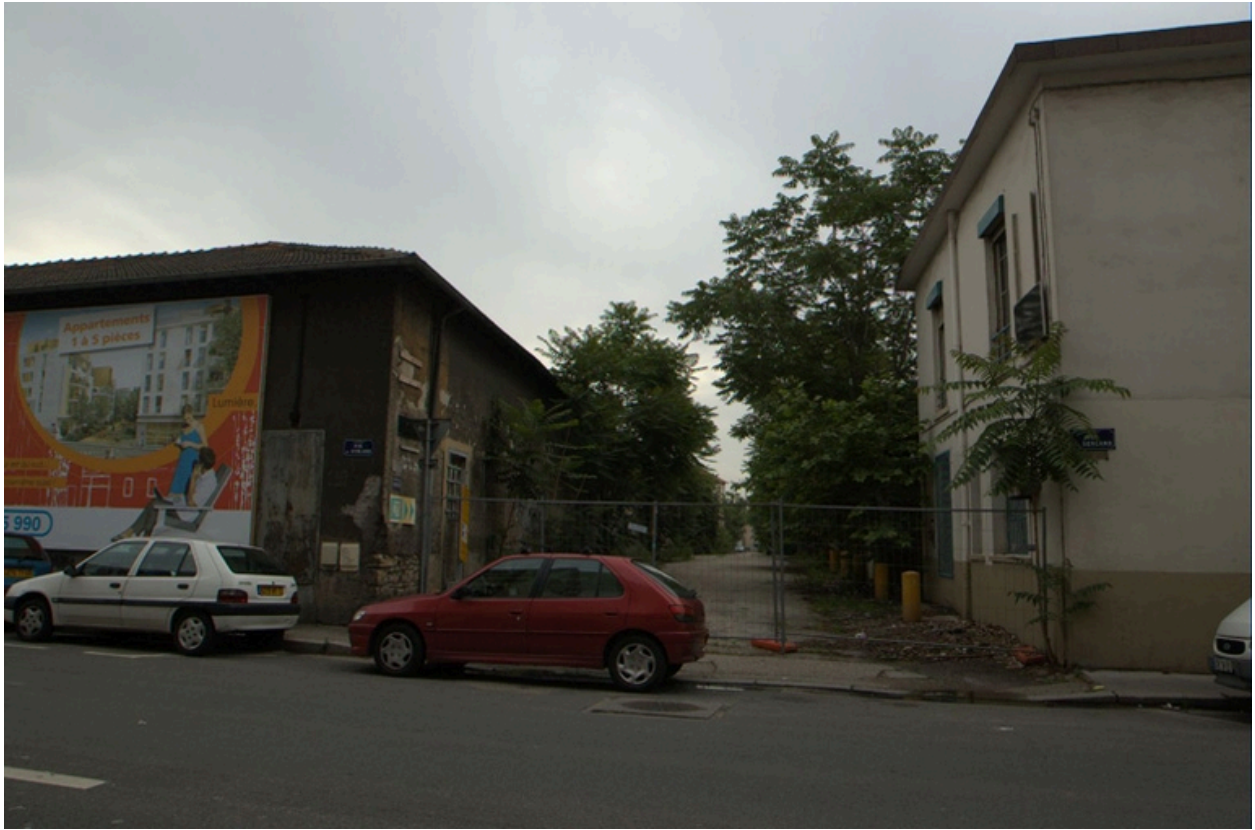
Vue sud-ouest angle avec l'impasse Faugier