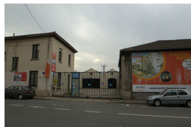
Entrée principale du site, vue ouest