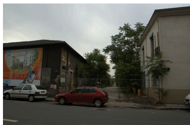
Vue sud-ouest angle avec l'impasse Faugier