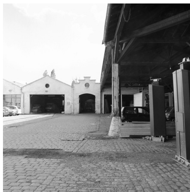
Vue générale ouest, fronton des ateliers et cour pavée IVR82_20026904522X