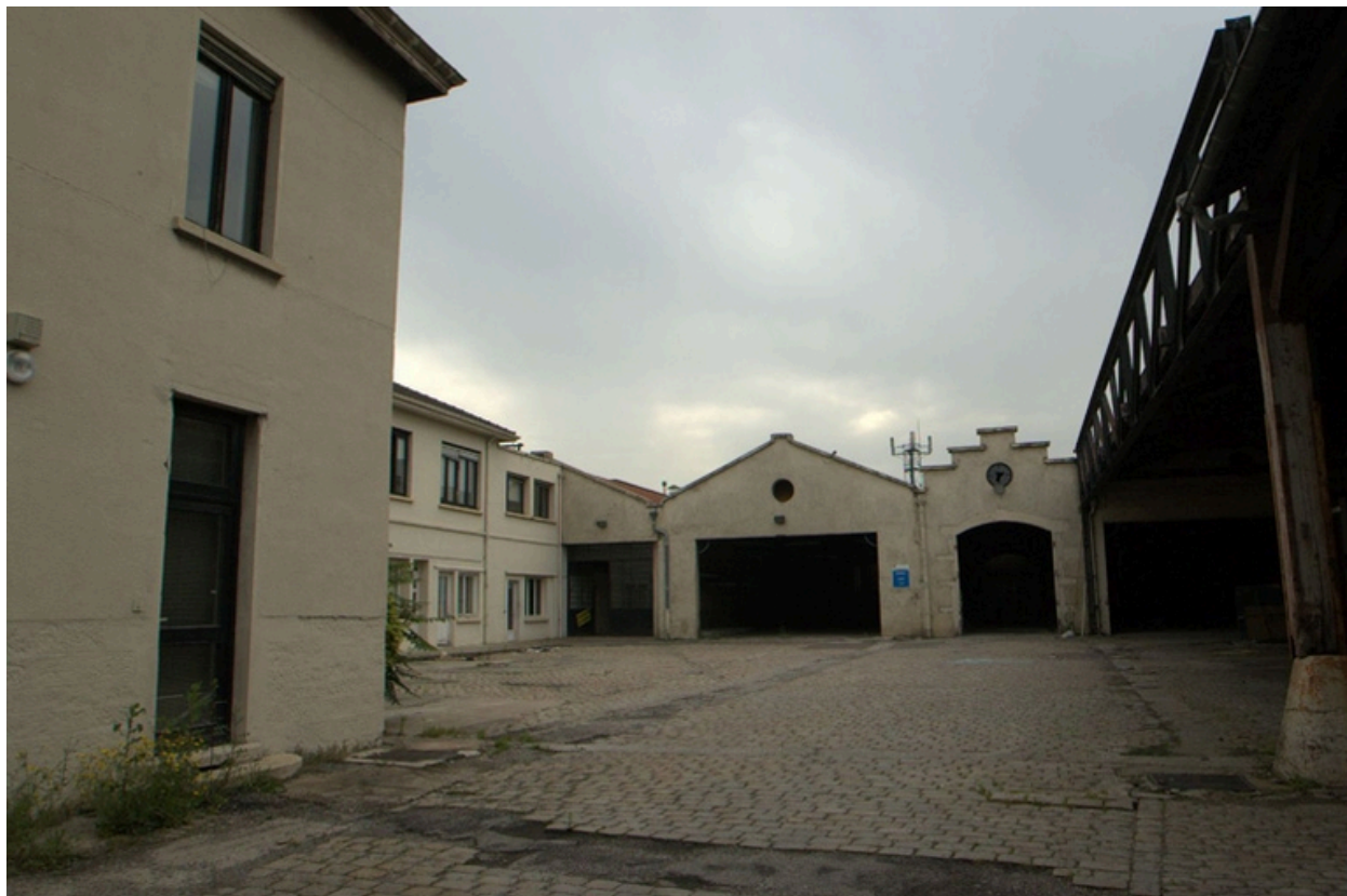
Ateliers et bâtiment administratif, vue sud-ouest