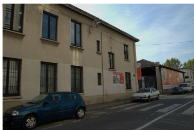
Vue nord-ouest de la façade sur la rue de Gerland IVR82_20086900397NUCA