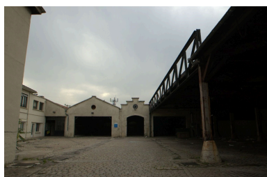
Vue ouest, cour pavée et ateliers IVR82_20086900487NUCA