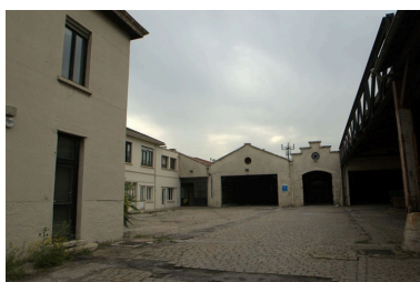
Ateliers et bâtiment administratif, vue sud-ouest IVR82_20086900488NUCA