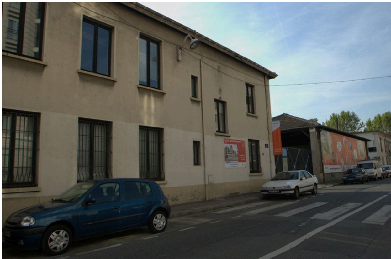
Vue nord-ouest de la façade sur la rue de Gerland