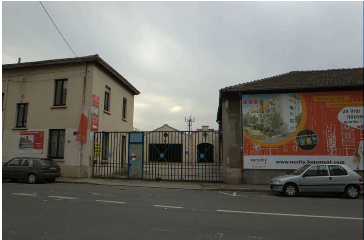
Entrée principale du site, vue ouest