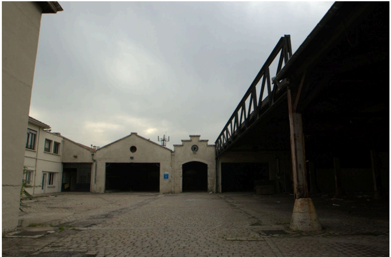
Vue ouest, cour pavée et ateliers