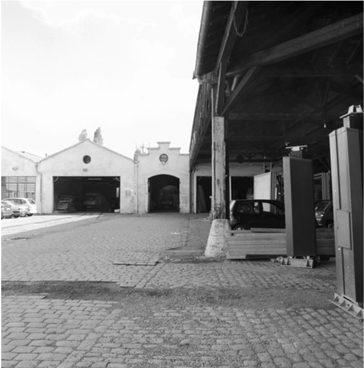
Vue générale ouest, fronton des ateliers et cour pavée