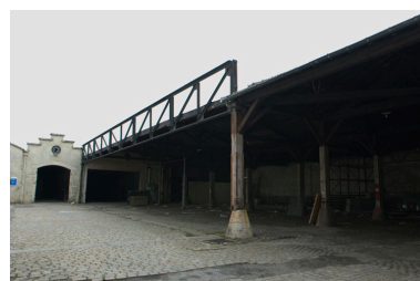
Entrepôt sud IVR82_20086900489NUCA