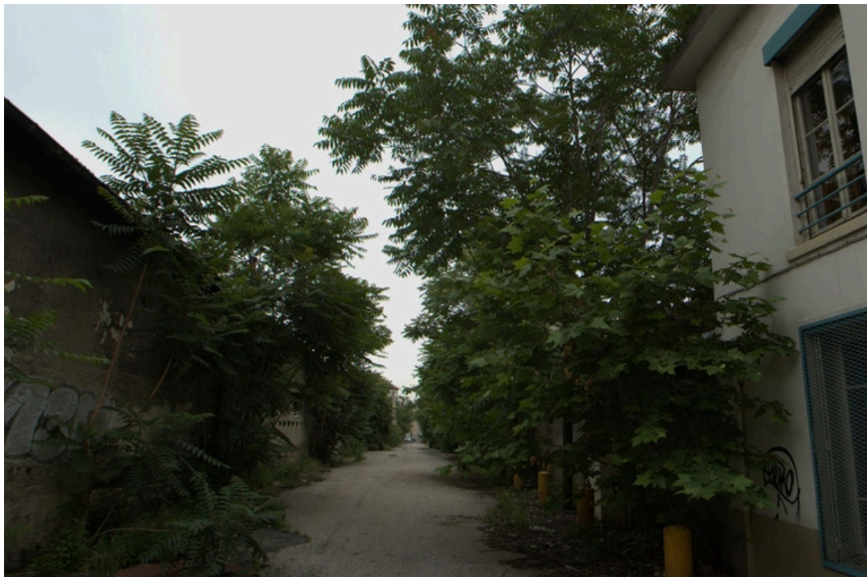
L'impasse Faugier envahie par la végétation depuis la fermeture du site