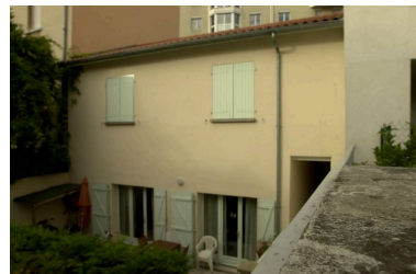
Elévation postérieure IVR82_20086900670NUCA