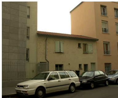
Vue d'ensemble depuis le nord-ouest IVR82_20086900668NUCA