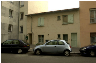
Vue d'ensemble depuis l'ouest IVR82_20086900669NUCA