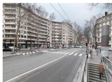
La place vue depuis l'ouest IVR84_20186900178NUCAQ