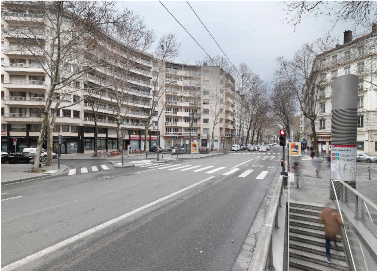
La place vue depuis l'ouest