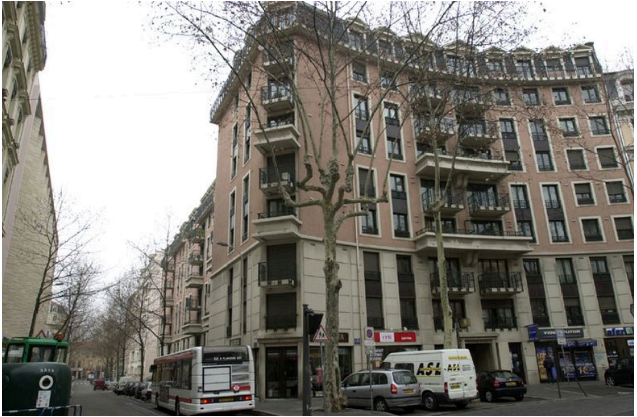
Vue du croisement avec la rue Jean-Marie-Chavant