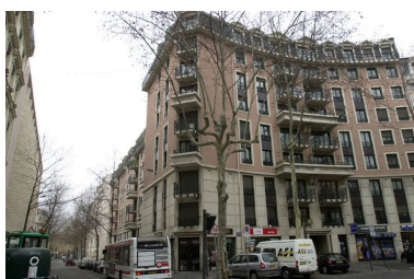
Vue du croisement avec la rue Jean-Marie-Chavant IVR82_20046904325NUCA