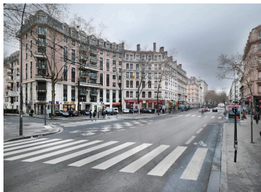
Vue générale depuis le nord IVR84_20186900184NUCAQ