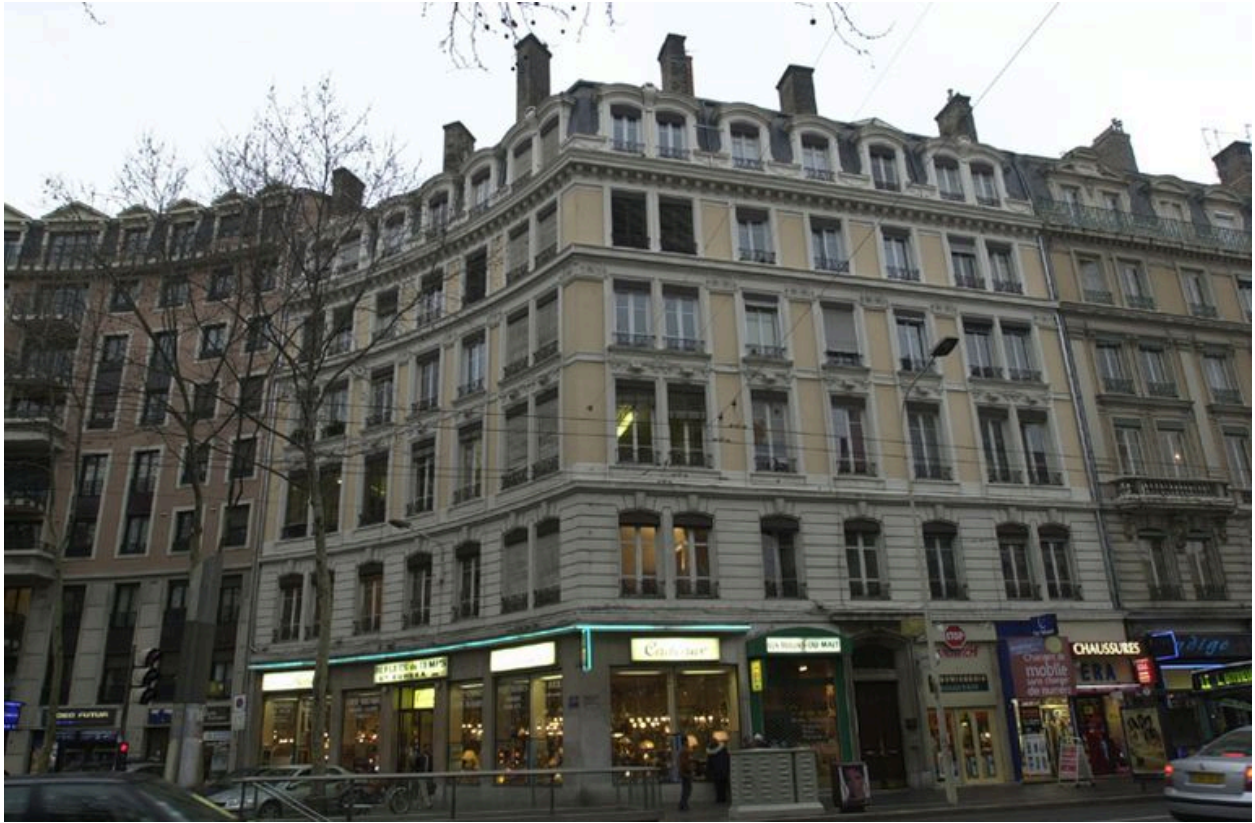
Vue d'e l'angle sud-ouest de la place