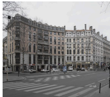
Vue d'ensemble depuis le nord-est IVR82_20056900636NUCA