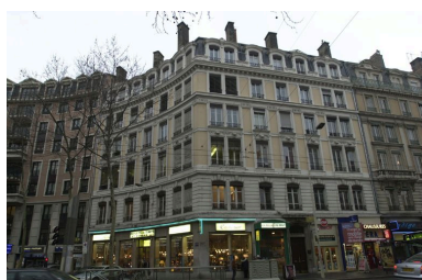
Vue de l'angle sud-ouest de la place IVR82_20046904332NUCA