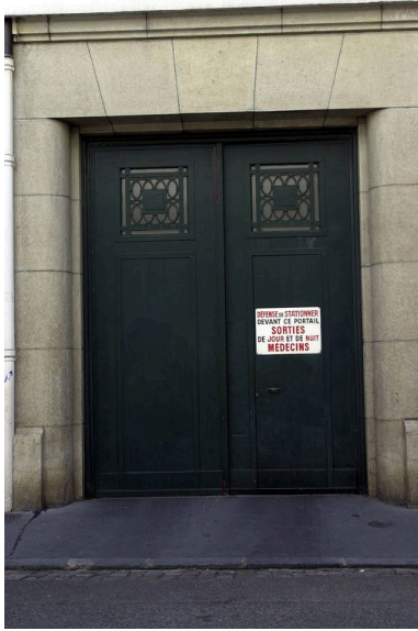
Vue générale de la porte cochère IVR82_20026901527NUCA