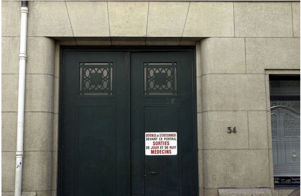
Détail de la partie supérieure des vantaux de la porte cochère