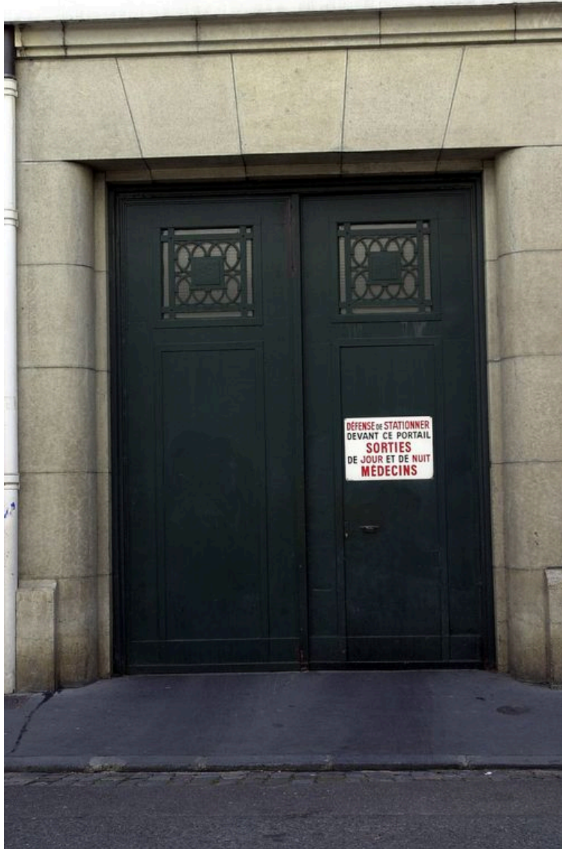
Vue générale de la porte cochère