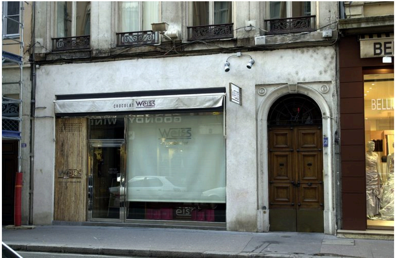
Élévation antérieure : le rez-de-chaussée