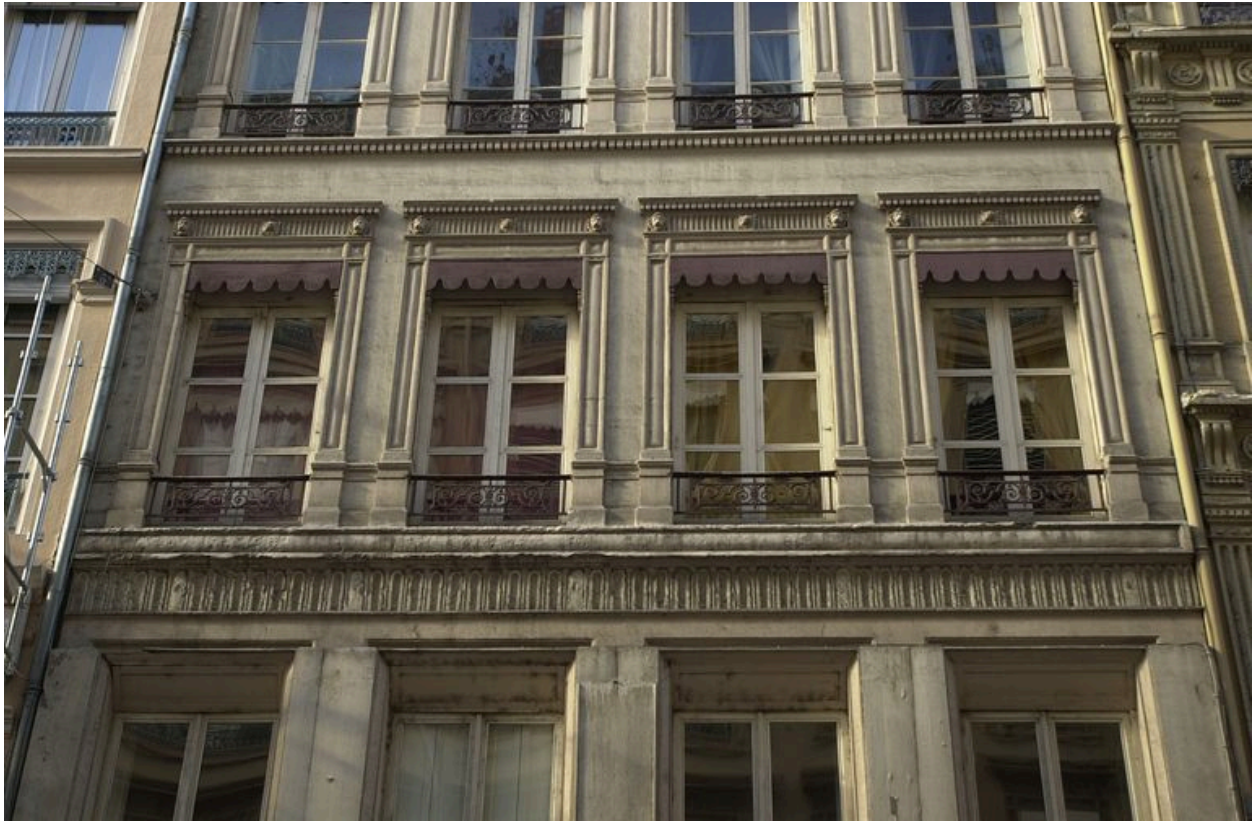
Élévation antérieure : détail des baies