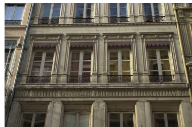
Elévation antérieure : détail des baies IVR82_20076901273NUCA