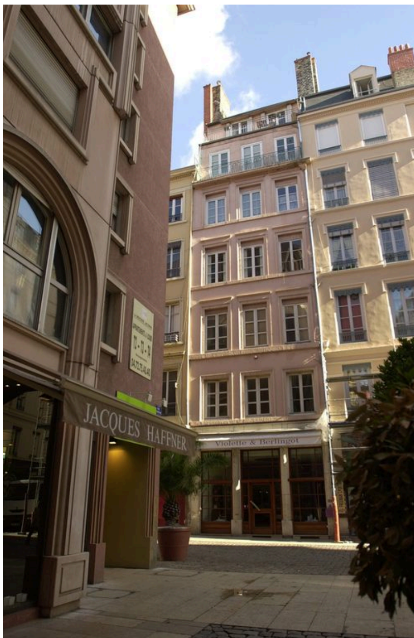
Vue générale rue Mercière