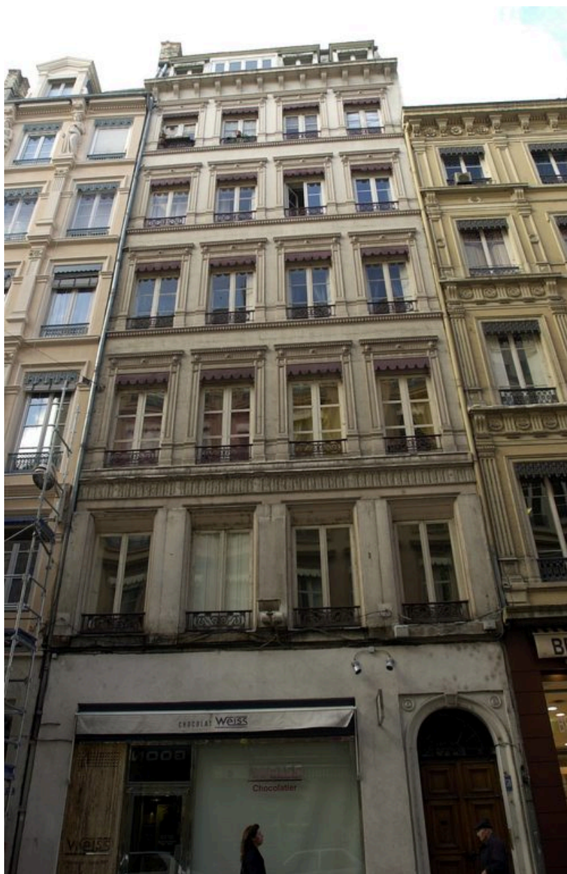
Vue générale rue de Brest