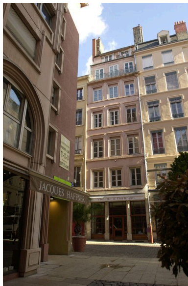
Vue générale rue Mercière IVR82_20076901274NUCA