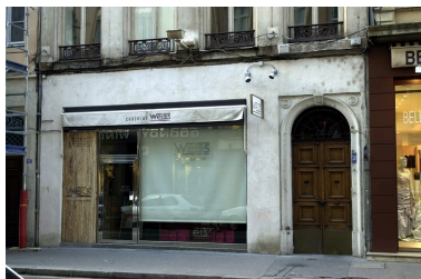
Elévation antérieure : le rez-de-chaussée