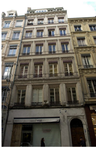
Vue générale rue de Brest IVR82_20076901271NUCA