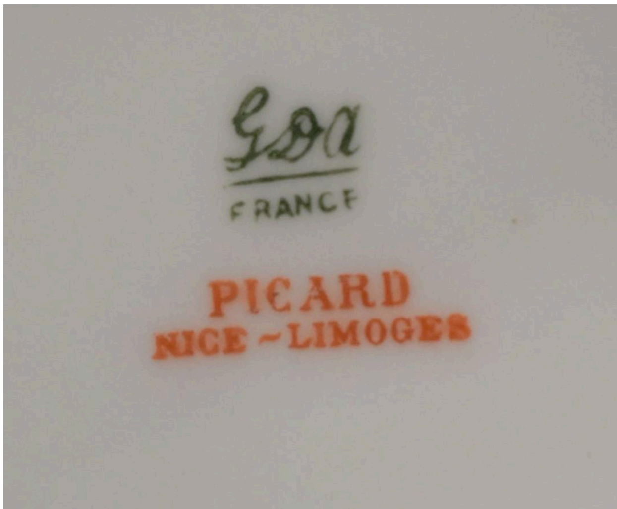
Détail - marque GDA