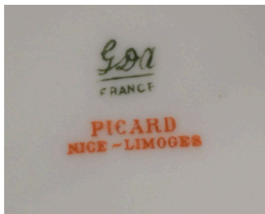
Détail - marque GDA IVR84_20226302693NUC4A