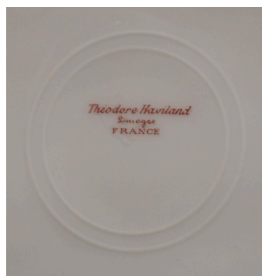
Détail - marque Haviland IVR84_20226302692NUC4A