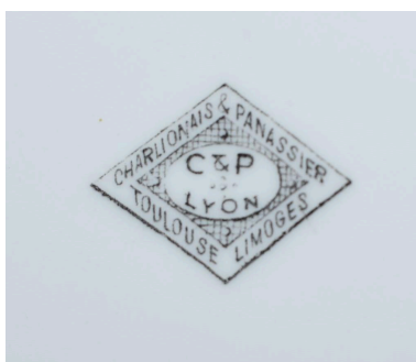
Détail - marque Panassier IVR84_20226302691NUC4A