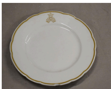
Vue générale IVR84_20226302690NUC4A