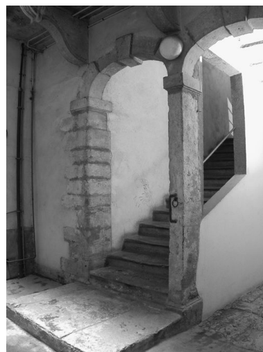
Le départ d'escalier depuis la cour