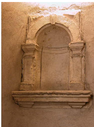
Escalier : niche à lumière permettant d'éclairer les repos IVR82_20046905397NUCA