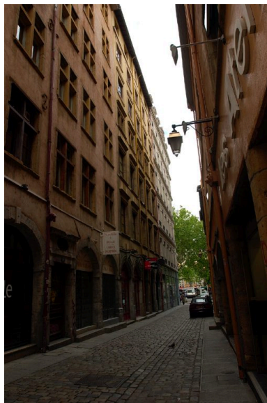
Vue de situation IVR82_20046905386NUCA