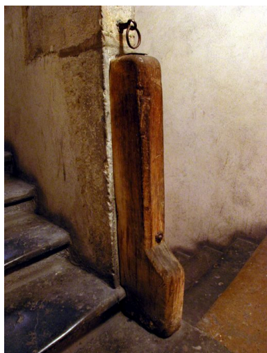
Premier repos de l'escalier : détail