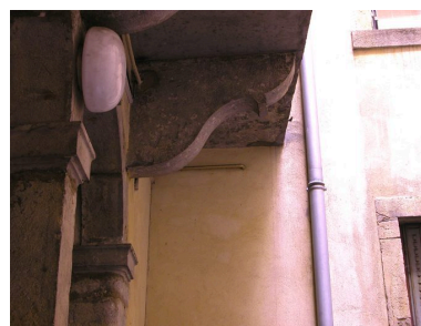
Détail d'une console soutenant les paliers de l'escalier