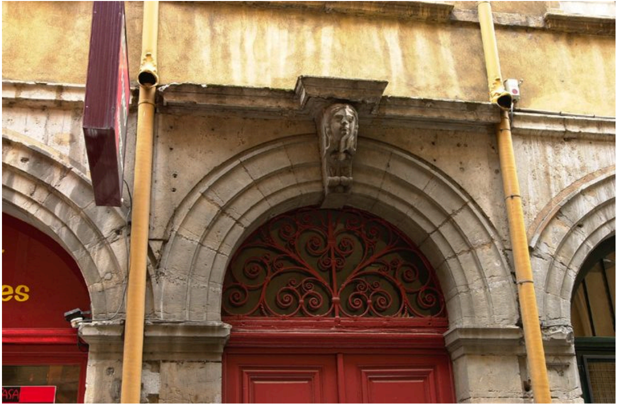
La porte : détail du tympan