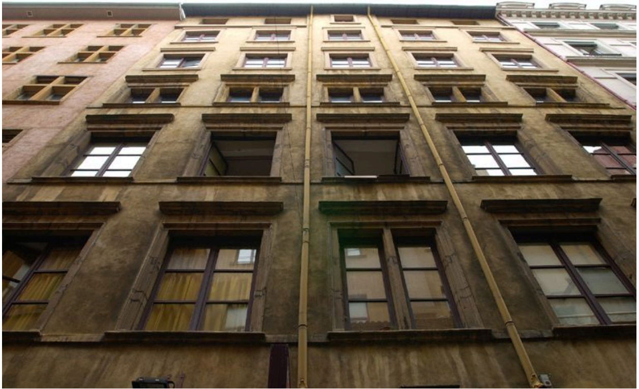
Élévation antérieure : les étages carrés