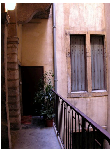
Palier et vue partielle de l'élévation est de la cour IVR82_20046905394NUCA