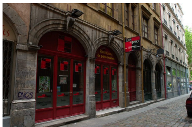
Le rez-de-chaussée IVR82_20046905387NUCA