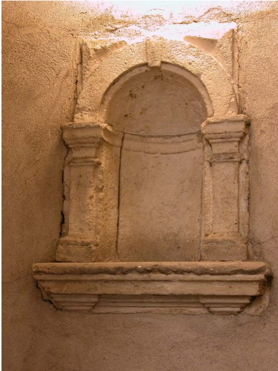
Escalier : niche à lumière permettant d'éclairer les repos