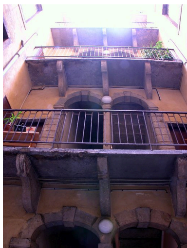
La cour : élévation nord IVR82_20046905393NUCA