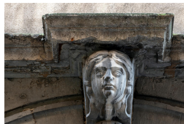
La porte : console où se lit difficilement l'inscription AU PETIT DAVID IVR84_20226900204NUCA