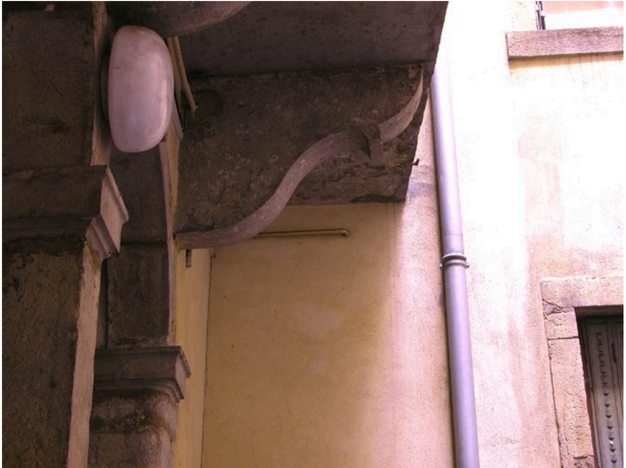
Détail d'une console soutenant les paliers de l'escalier