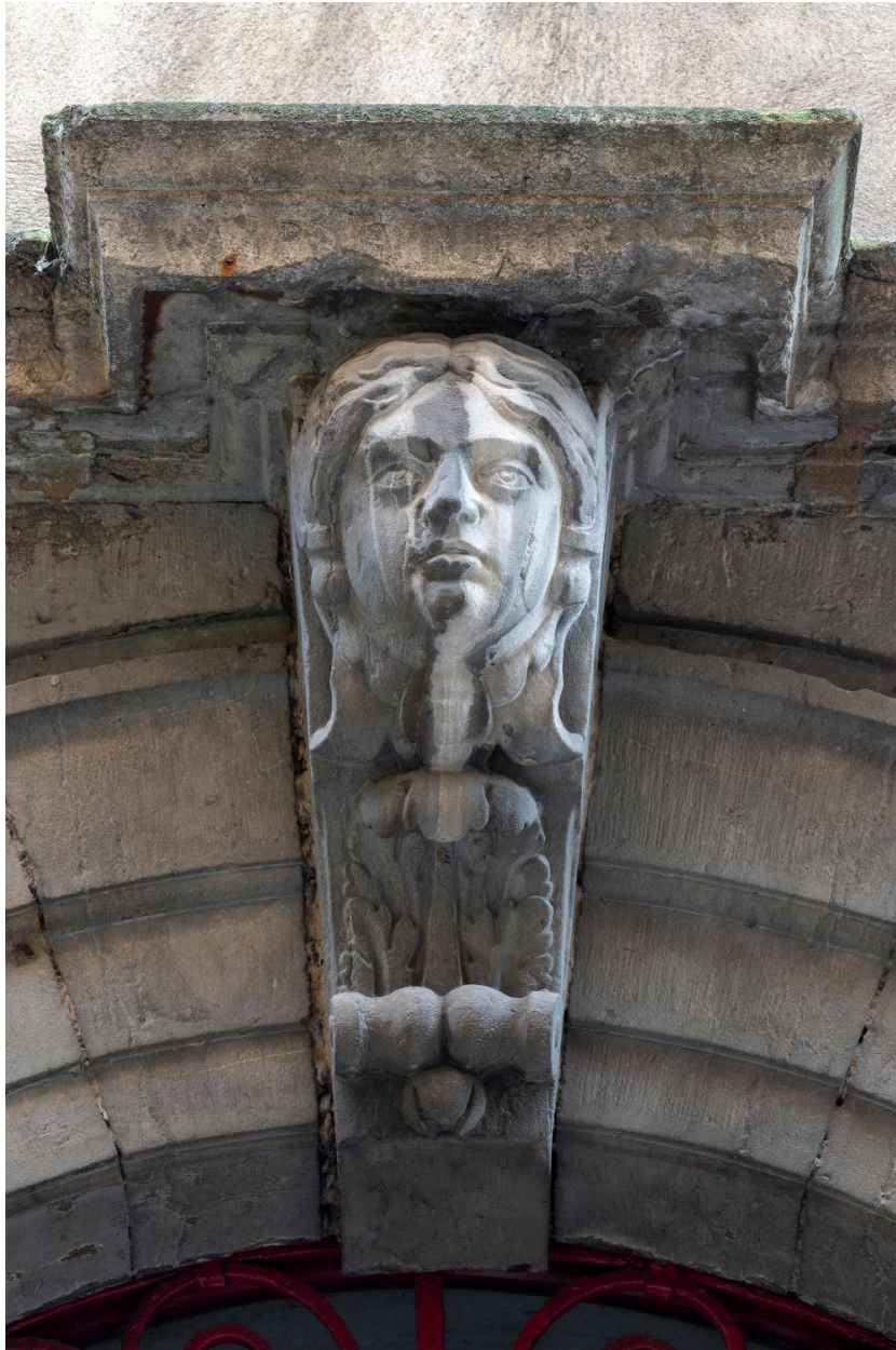
La porte : agrafe sculptée et console la surmontant