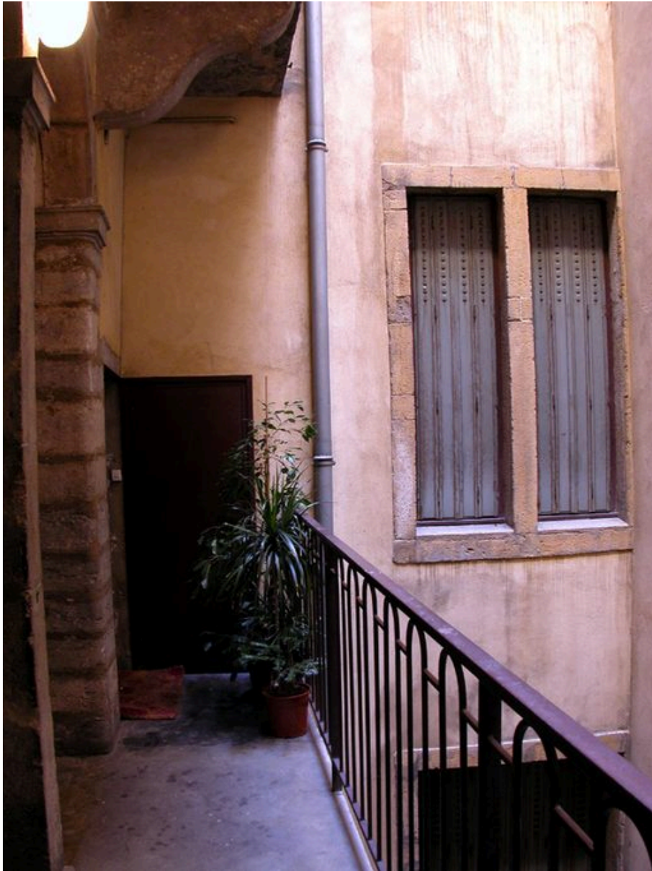
Palier et vue partielle de l'élévation est de la cour