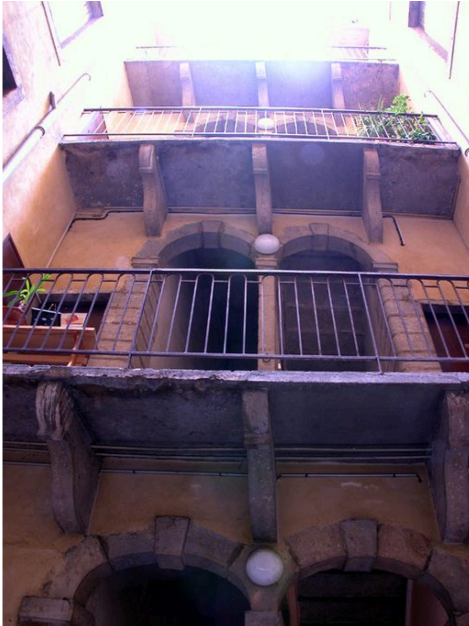
La cour : élévation nord