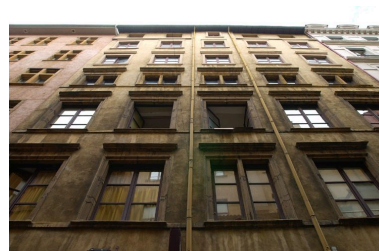
Élévation antérieure : les étages carrés IVR82_20046905388NUCA