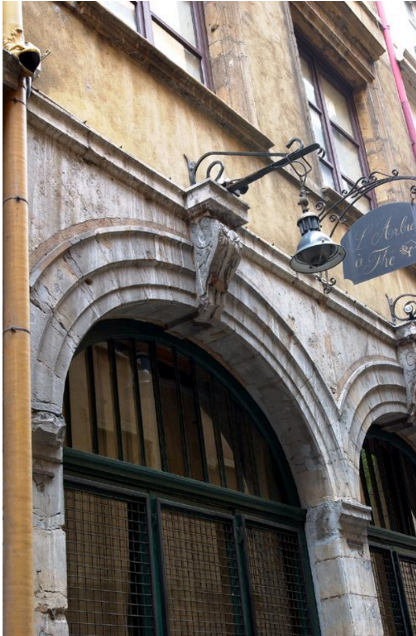
Elévation antérieure : arcades du rez-de-chaussée, détail d'une agrafe