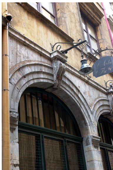
Elévation antérieure : arcades du rez-de-chaussée, détail d'une agrafe