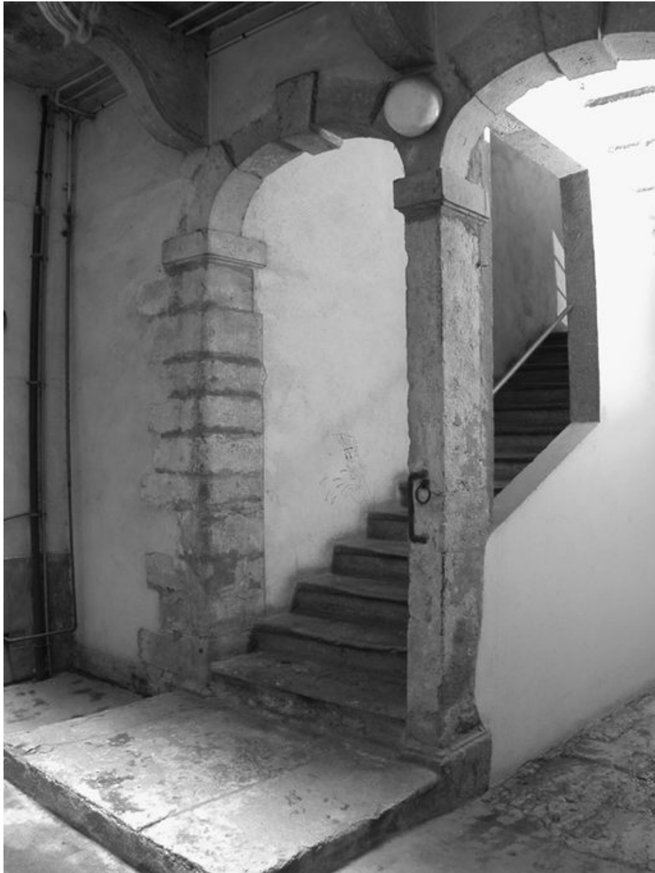
Le départ d'escalier depuis la cour