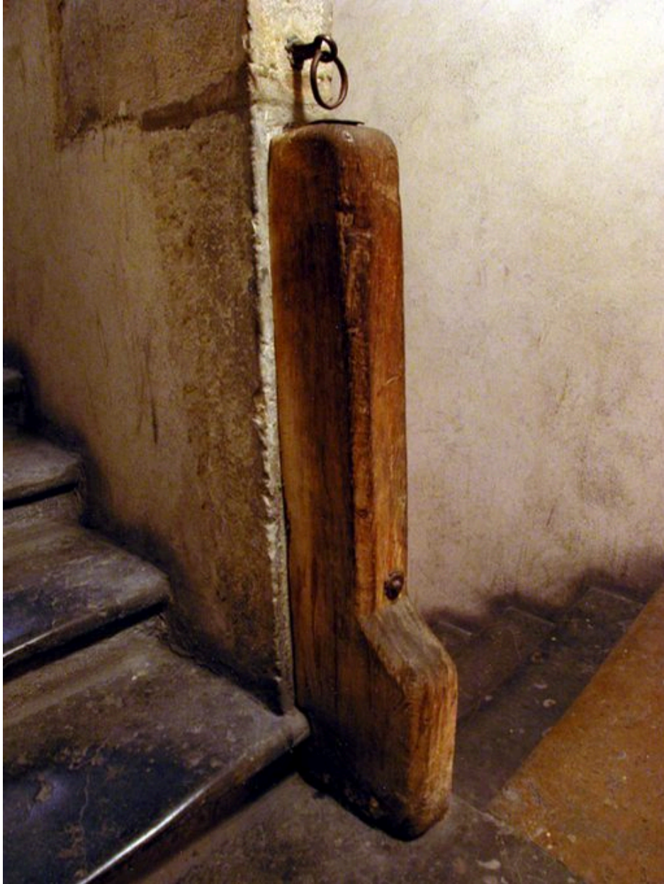
Premier repos de l'escalier : détail