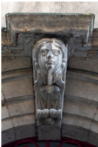
La porte : agrafe sculptée et console la surmontant IVR84_20226900203NUCA