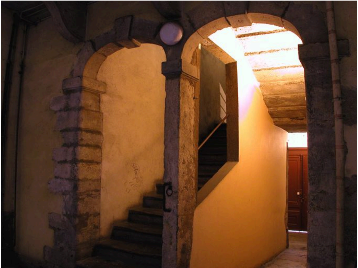
L'allée et les arcades de la cage d'escalier depuis la cour