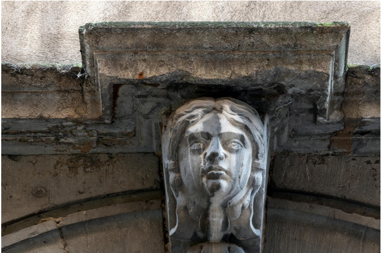
La porte : console où se lit difficilement l'inscription AU PETIT DAVID