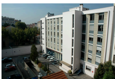
La parc de stationnement IVR82_20066903145NUCA