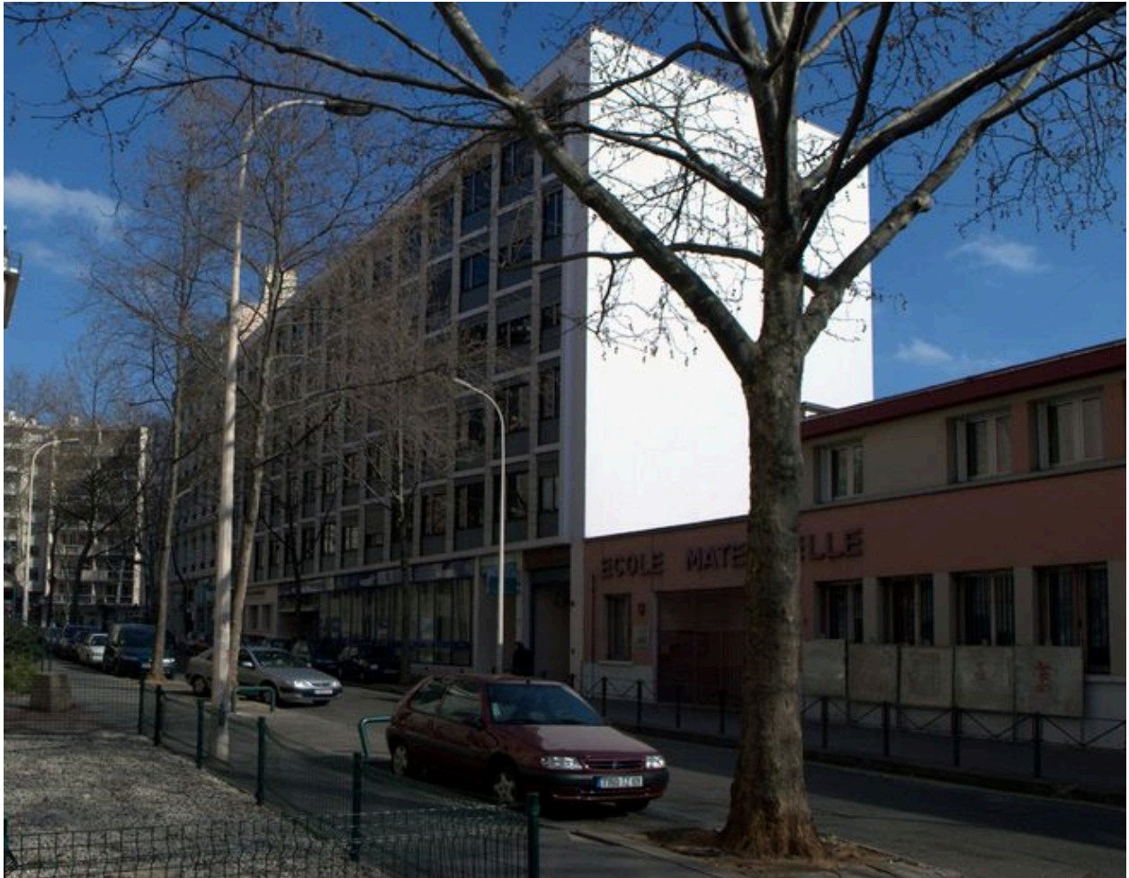
Elévation antérieure depuis le sud-ouest