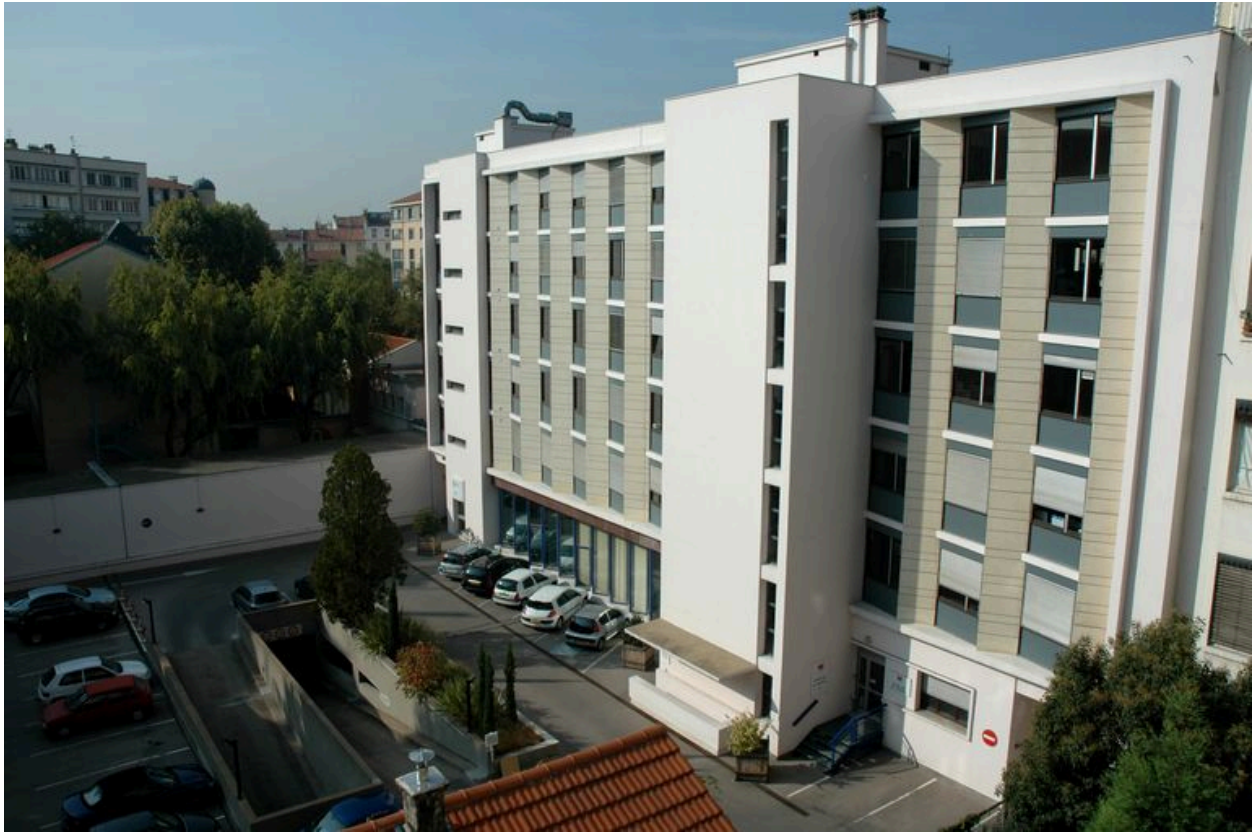
La parc de stationnement