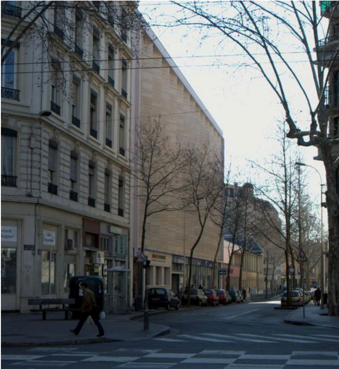
Elévation antérieure, depuis le nord