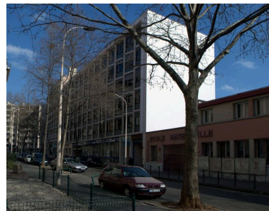
Elévation antérieure depuis le sud-ouest IVR82_20116904982NUCA