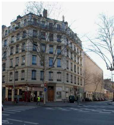
Vue générale depuis le nord IVR82_20116904980NUCA