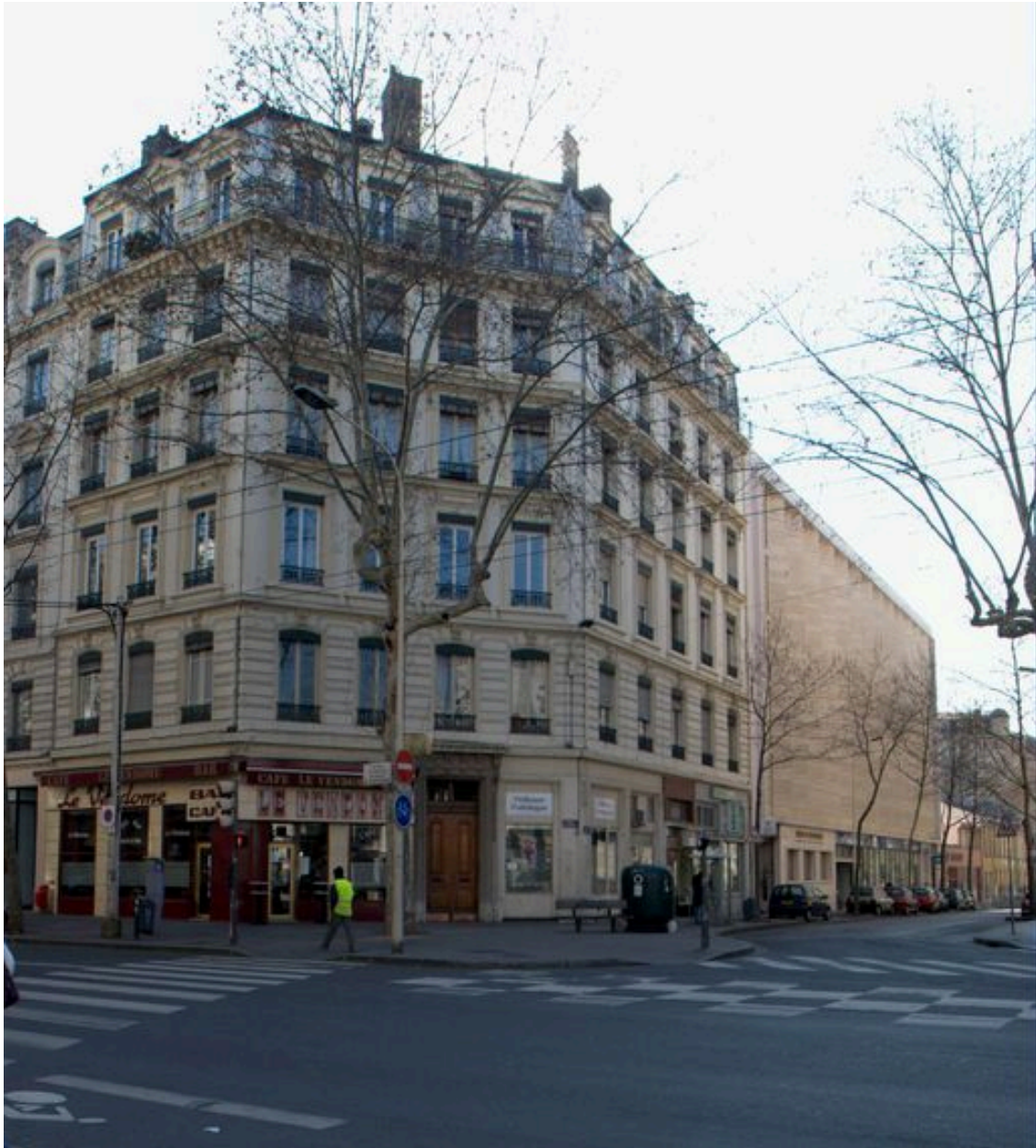
Vue générale depuis le nord