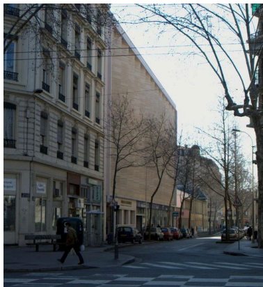
Elévation antérieure, depuis le nord IVR82_20116904981NUCA