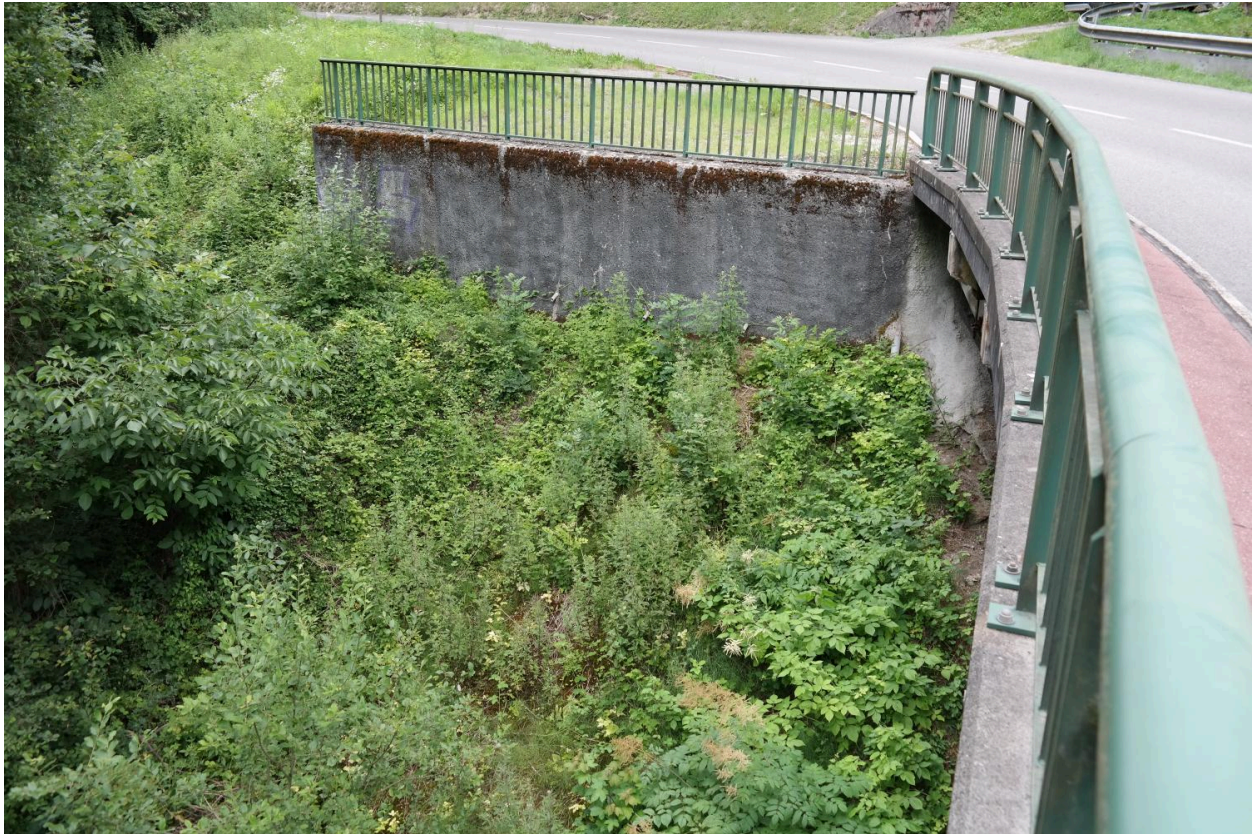
Pont de Vaulx, détail de la réfécion du talus