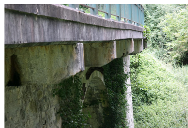
Pont de Vaulx, détail de l'élargissement en béton