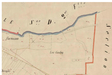
Extrait de la section C feuille n°2 du cadastre de la commune de Vaulx. 1905. IVR84_20207403183NUCA