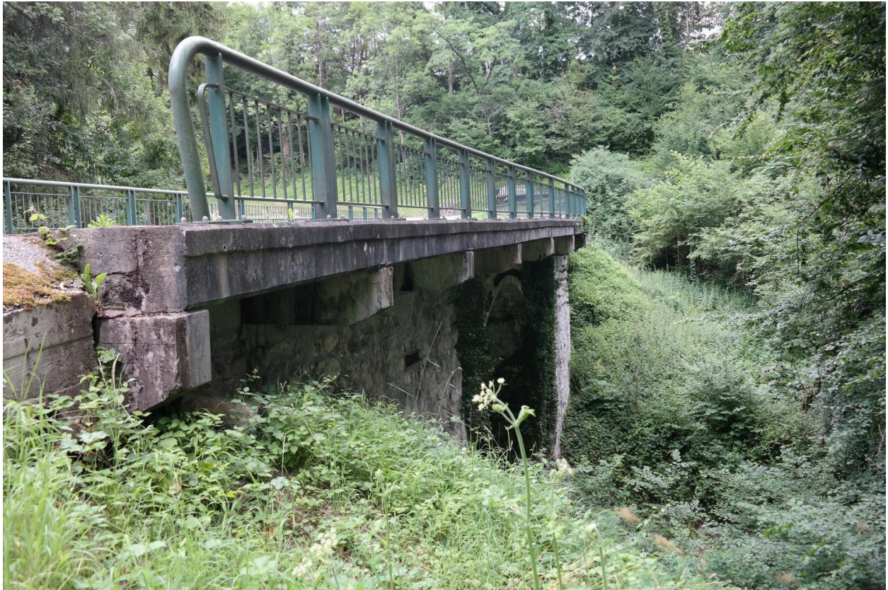
Pont de Vaulx, vue de la face aval