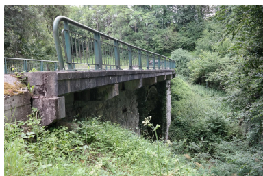
Pont de Vaulx, vue de la face aval IVR84_20207403180NUCA