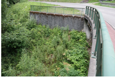
Pont de Vaulx, détail de la réfécion du talus IVR84_20207403994NUCA