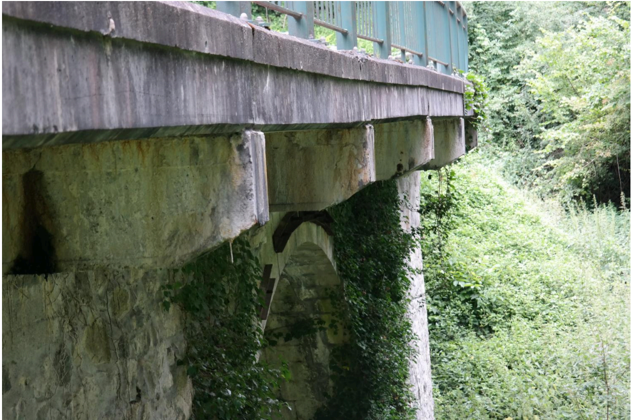
Pont de Vaulx, détail de l'élargissement en béton