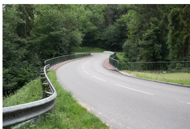
Pont de Vaulx, vue de la chaussée IVR84_20207403181NUCA