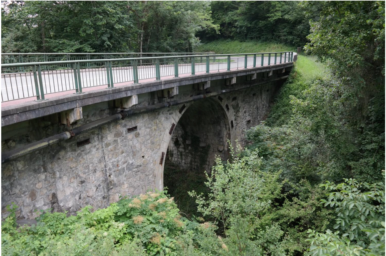
Pont de Vaulx, vue de la face amont