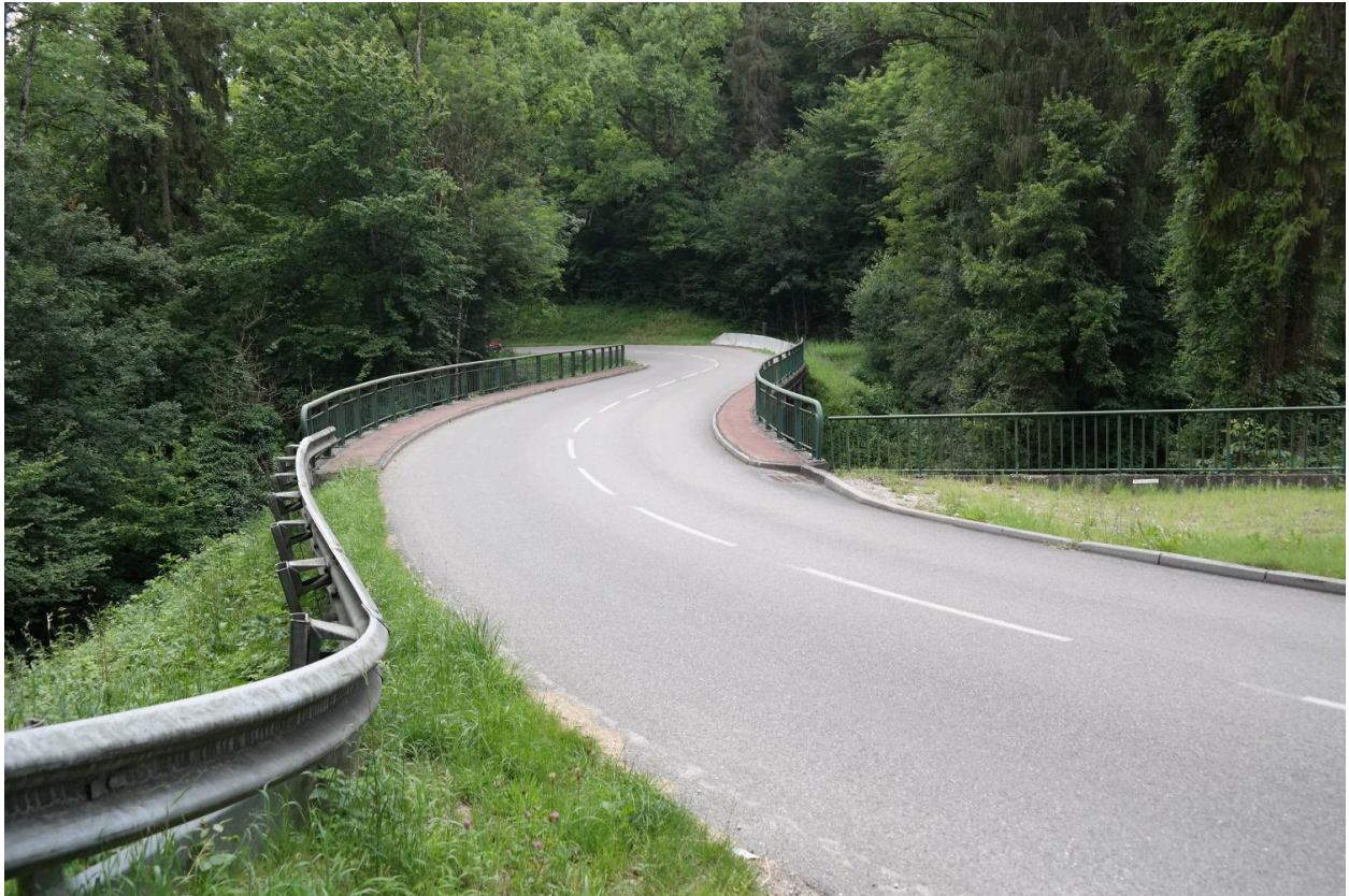
Pont de Vaulx, vue de la chaussée