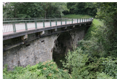
Pont de Vaulx, vue de la face amont