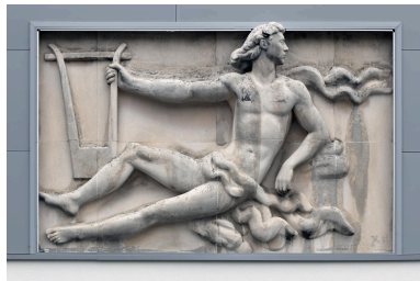
Vue d'ensemble. IVR84_20213800030NUCA