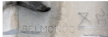
Détail : signature. IVR84_20213800031NUCA