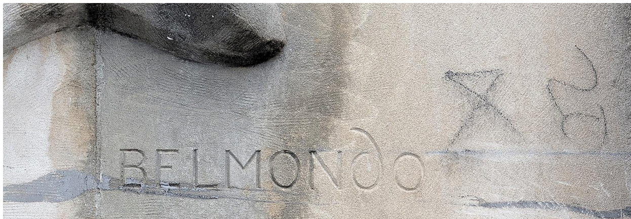
Détail : signature.