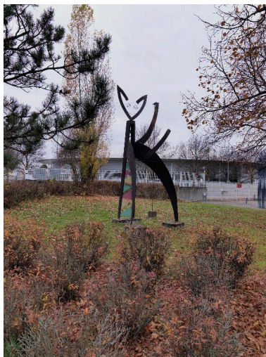
Vue de 3/4 arrière IVR82_20154200709NUCA