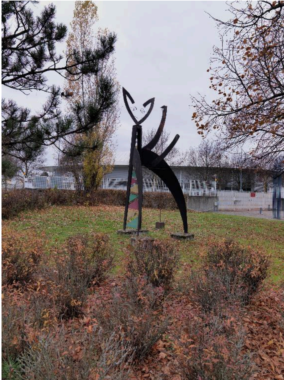
Vue de 3/4 arrière