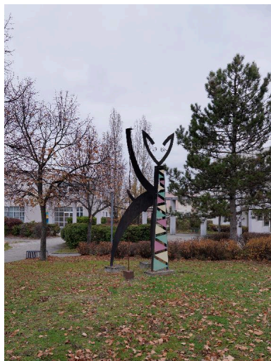
Vue d'ensemble IVR82_20154200710NUCA