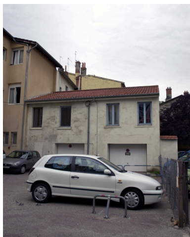
Elévation postérieure, sur la cour de la parcelle AE 136 IVR82_20116905031NUCA