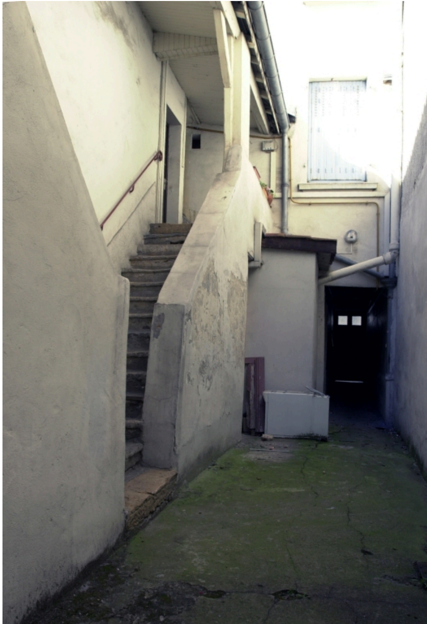
Vue d'ensemble de l'escalier depuis le nord