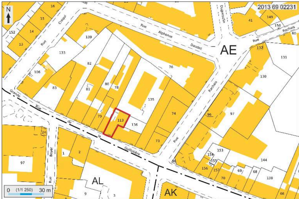
Plan masse et de situation