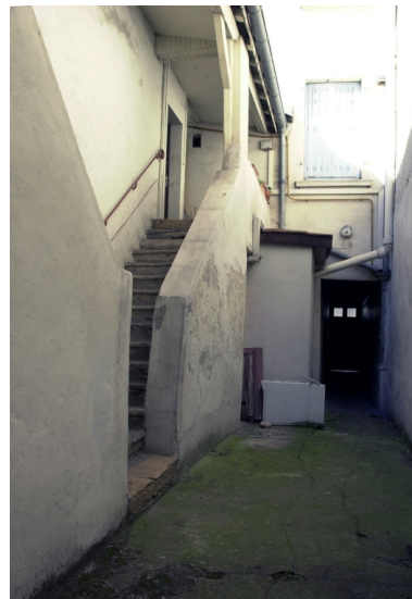
Vue d'ensemble de l'escalier depuis le nord IVR82_20116905028NUCA