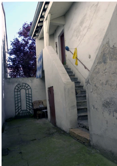
Vue d'ensemble de l'escalier depuis le sud IVR82_20116905139NUCA