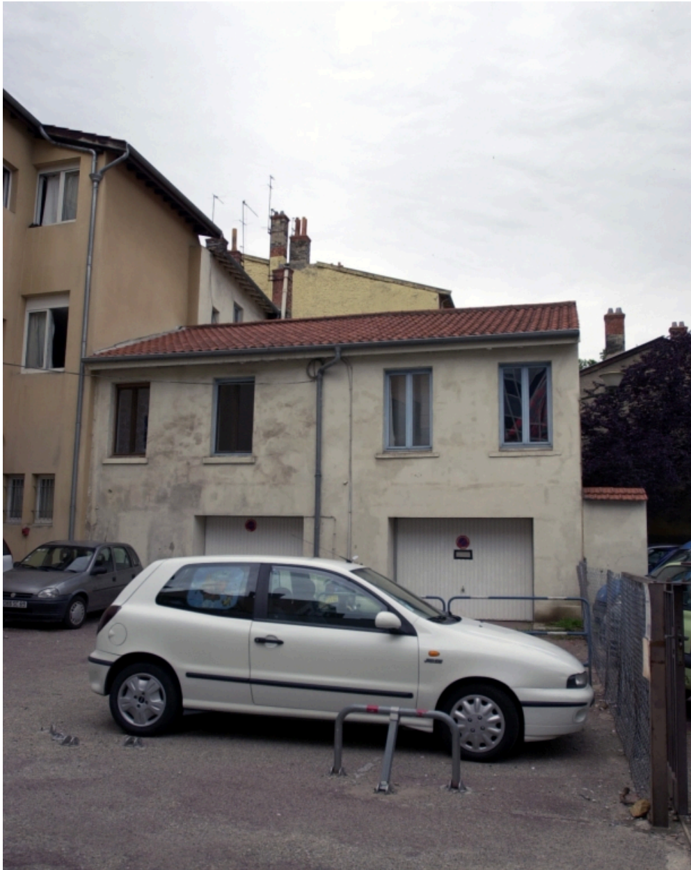
Elévation postérieure, sur la cour de la parcelle AE 136