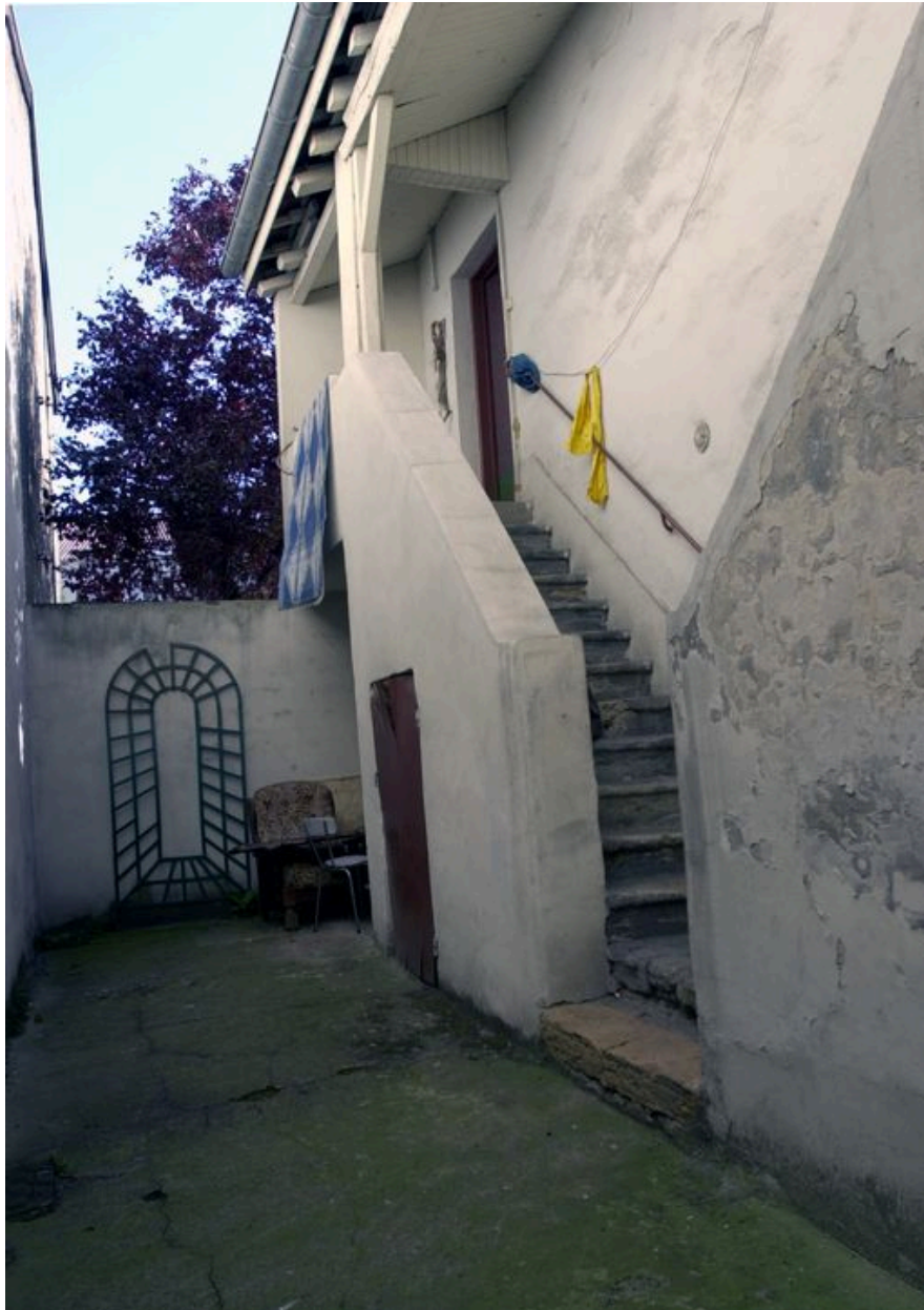
Vue d'ensemble de l'escalier depuis le sud