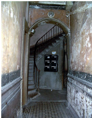
Allée et escalier IVR82_20016900852NUCA