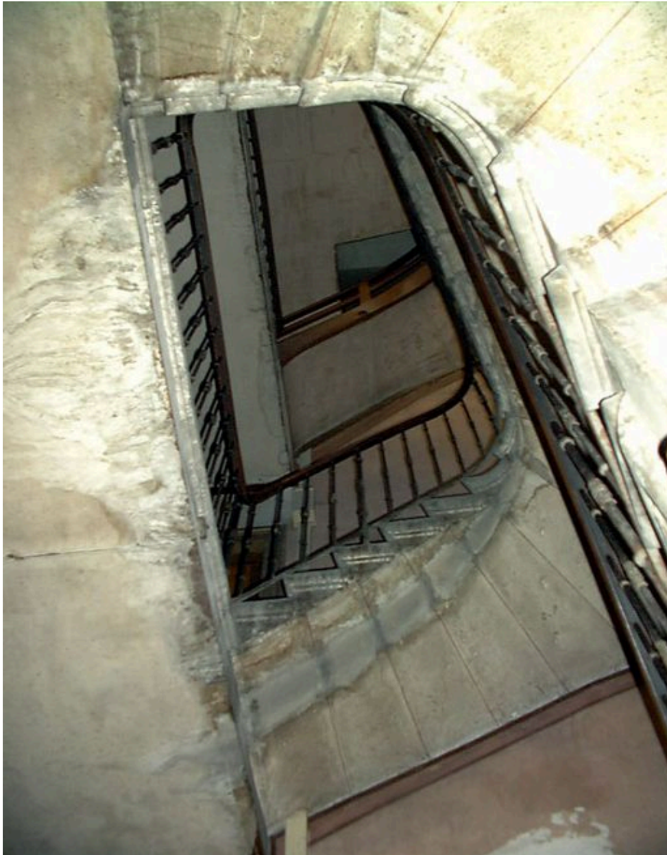
Escalier, jour vu depuis le rez-de-chaussée