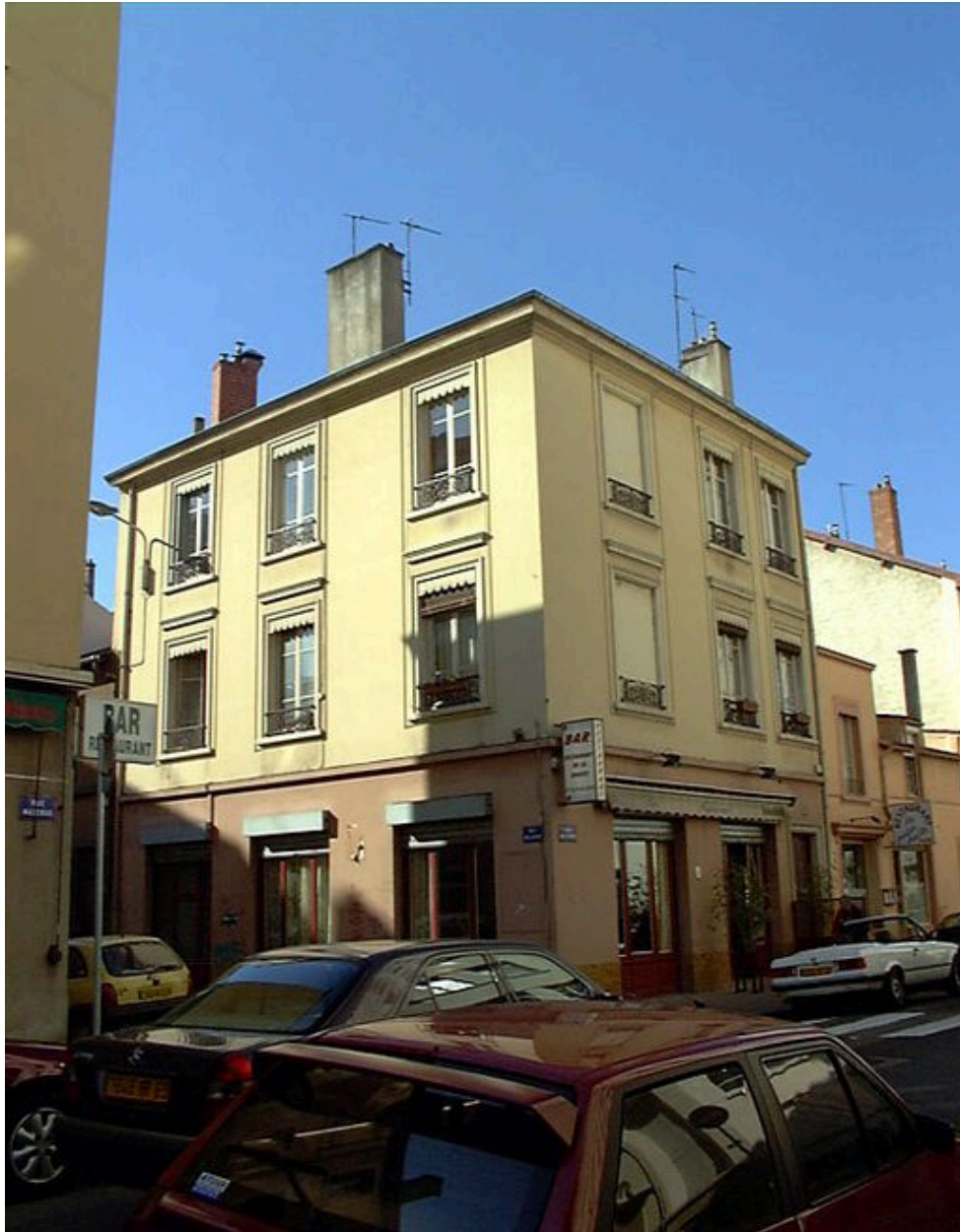
Vue générale des façades sur rue