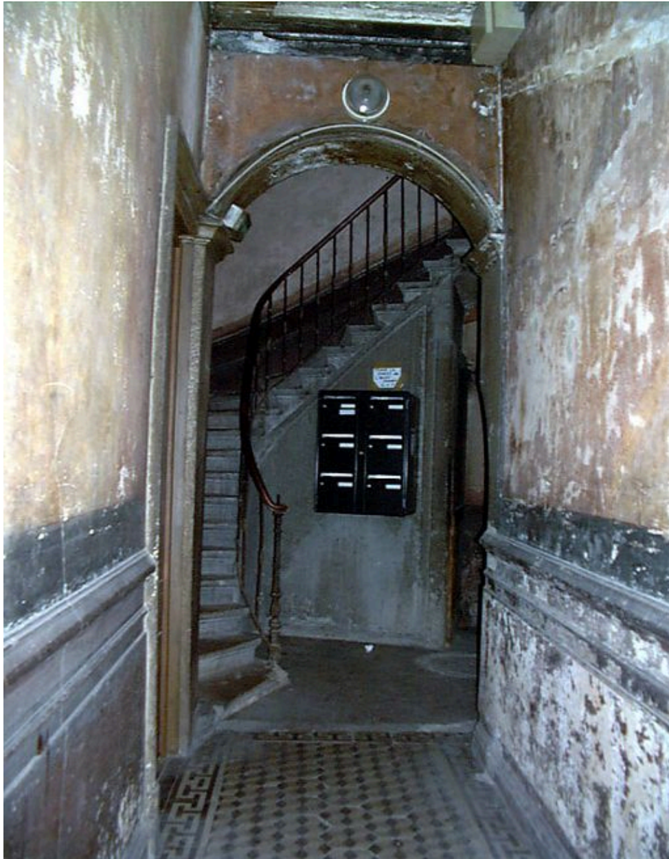
Allée et escalier