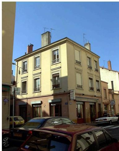
Vue générale des façades sur rue IVR82_20016900850NUCA