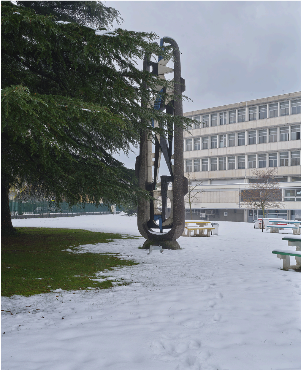
L'oeuvre dans son environnement, en 2022