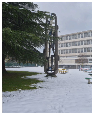
L'œuvre dans son environnement, en 2022