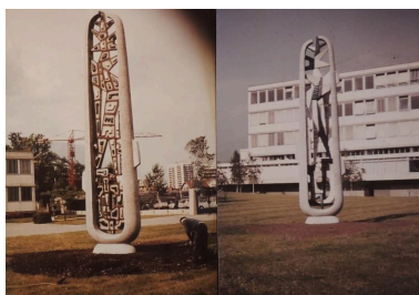
Œuvre installée, 1963 (AN 20020101/12). Autr. auteur inconnu IVR84_20203800054NUCA