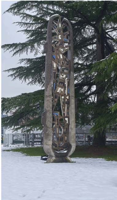
Vue rapprochée IVR84_20223800140NUCA