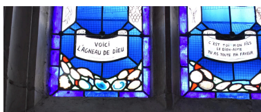
Verrière n°1, baie de la chapelle nord-ouest, détail des inscriptions.