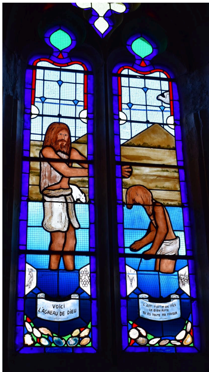
Verrière n°1, baie de la chapelle nord-ouest, vue générale.