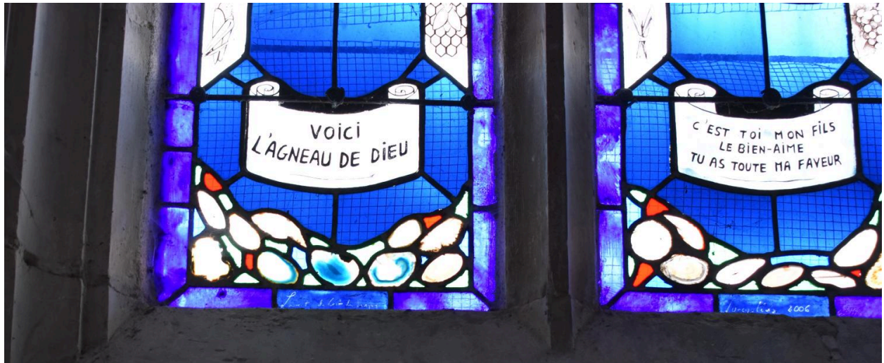
Verrière n°1, baie de la chapelle nord-ouest, détail des inscriptions.