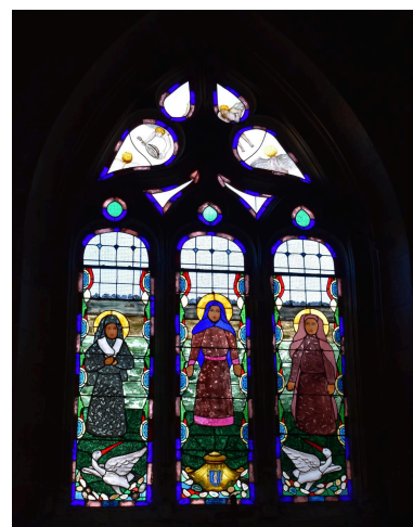
Verrière n°2, baie de la chapelle nord-est, vue générale. IVR84_20250300182NUCA