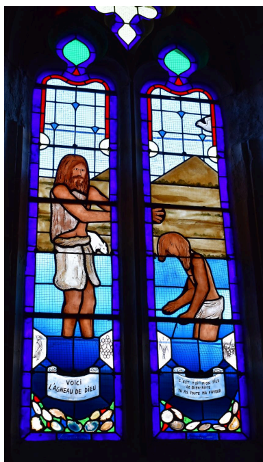
Verrière n°1, baie de la chapelle nord-ouest, vue générale.