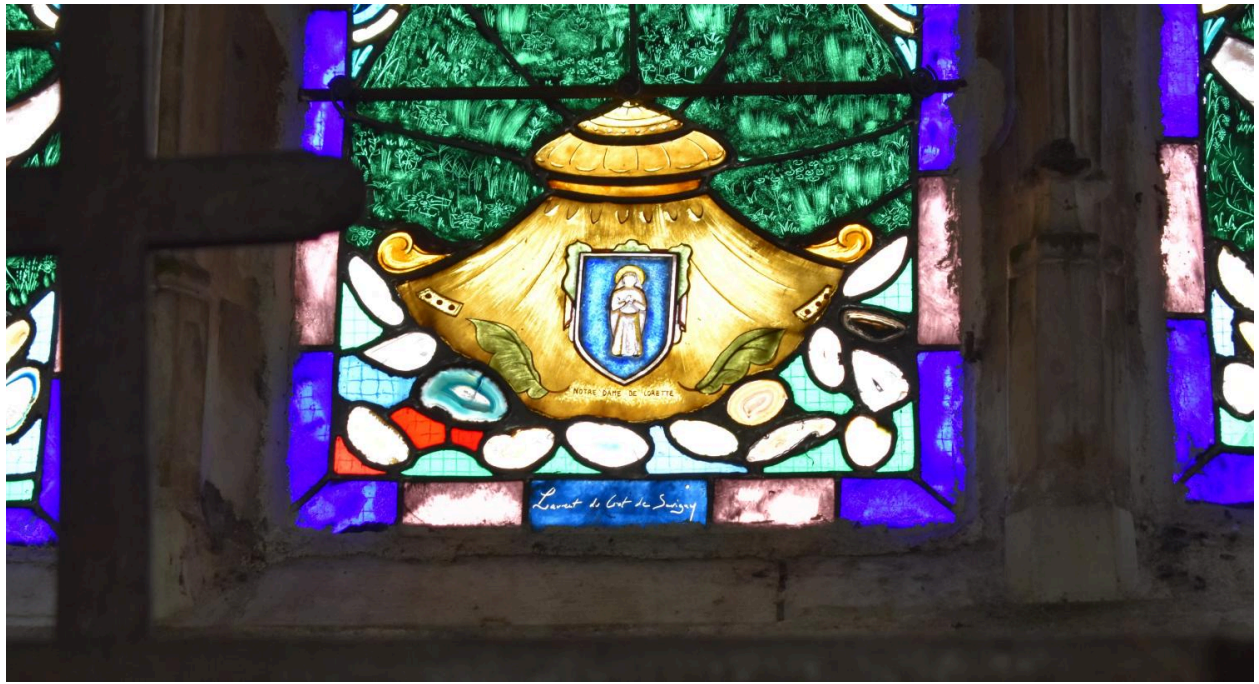
Verrière n°1, baie de la chapelle nord-ouest, détail des inscriptions.