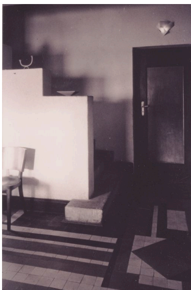
Le living-room et le départ de l'escalier