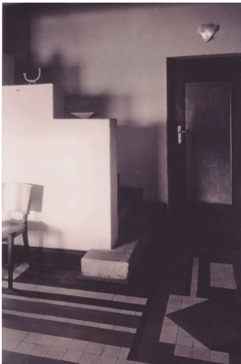
Le living-room et le départ de l'escalier