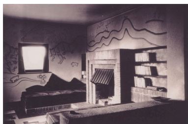
Le living-room et le coin feu IVR82_20127402104NUCAB