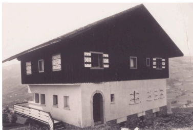
Vue générale IVR82_20127402103NUCAB