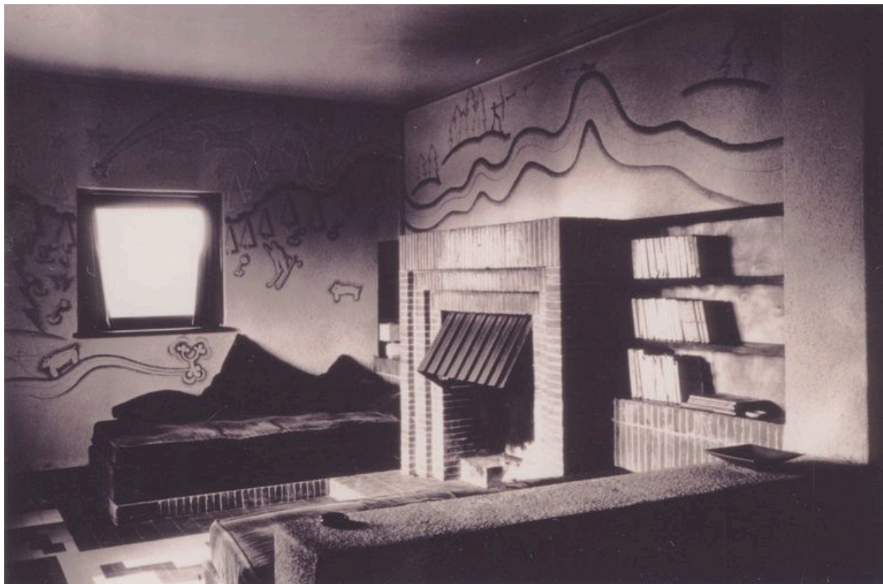
Le living-room et le coin feu