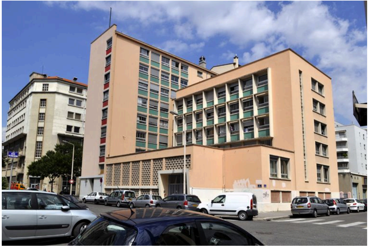
Vue d'ensemble depuis l'arrière