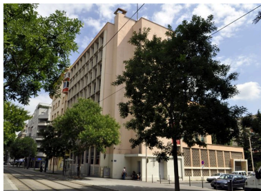
Vue d'ensemble IVR82_20096903498NUCA