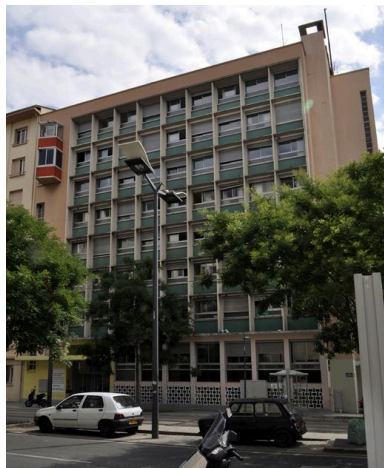
Vue générale IVR82_20096903497NUCA