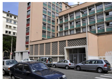
Chapelle IVR82_20096904302NUCA