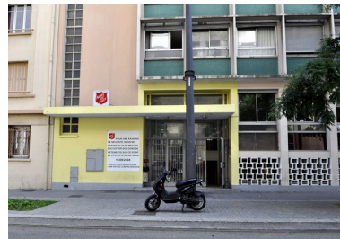
Entrée IVR82_20096903499NUCA