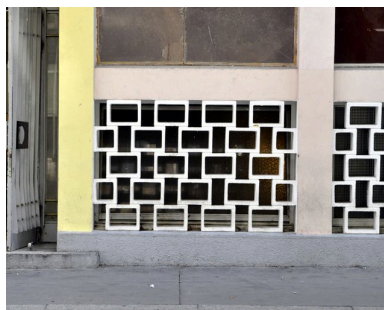
Détail de la claustra du rez-de-chaussée IVR82_20096903500NUCA