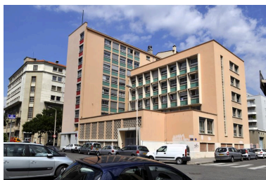
Vue d'ensemble depuis l'arrière IVR82_20096904301NUCA