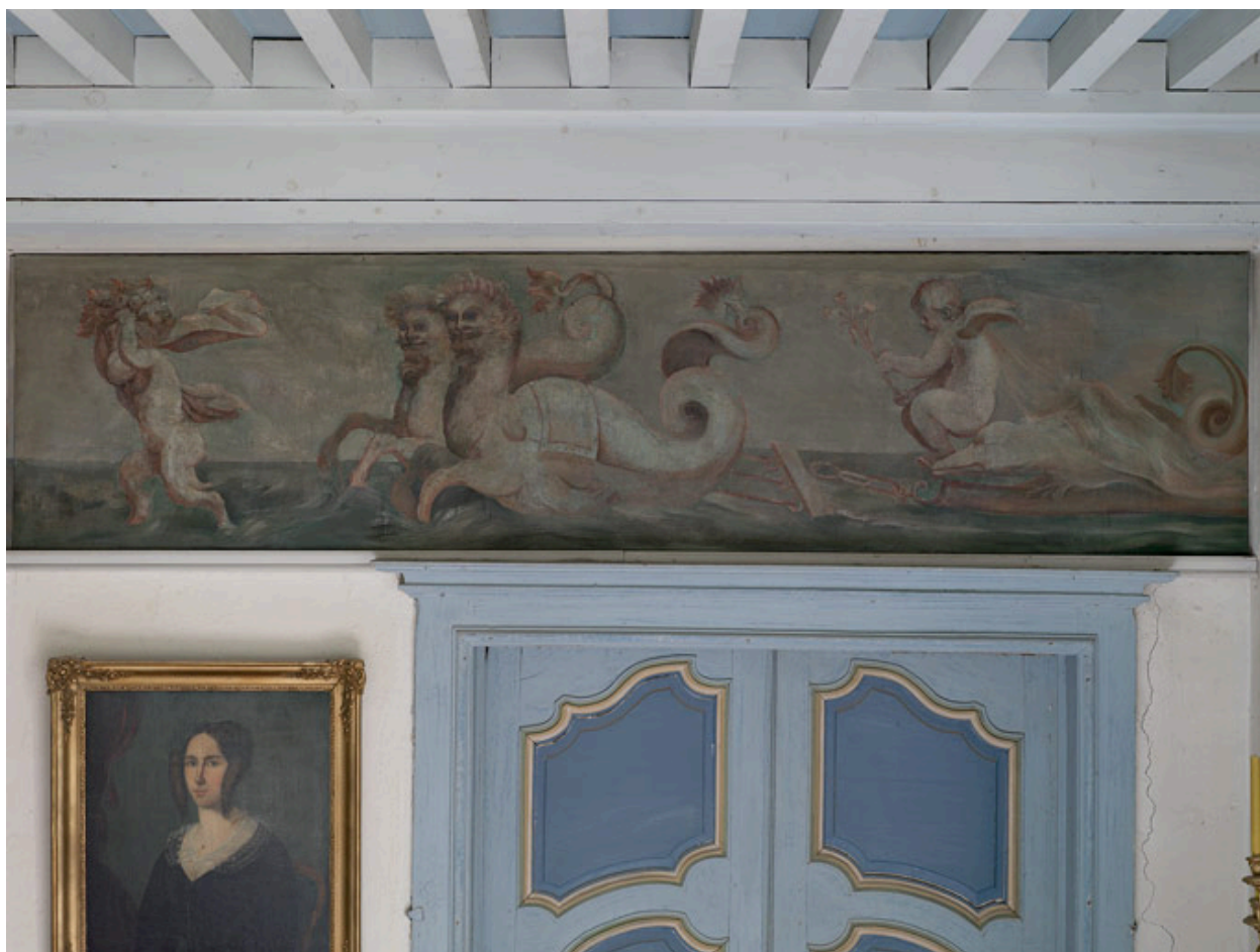
Corps central, 1er étage, chambre du milieu : cortège de tritons et de créatures marines.