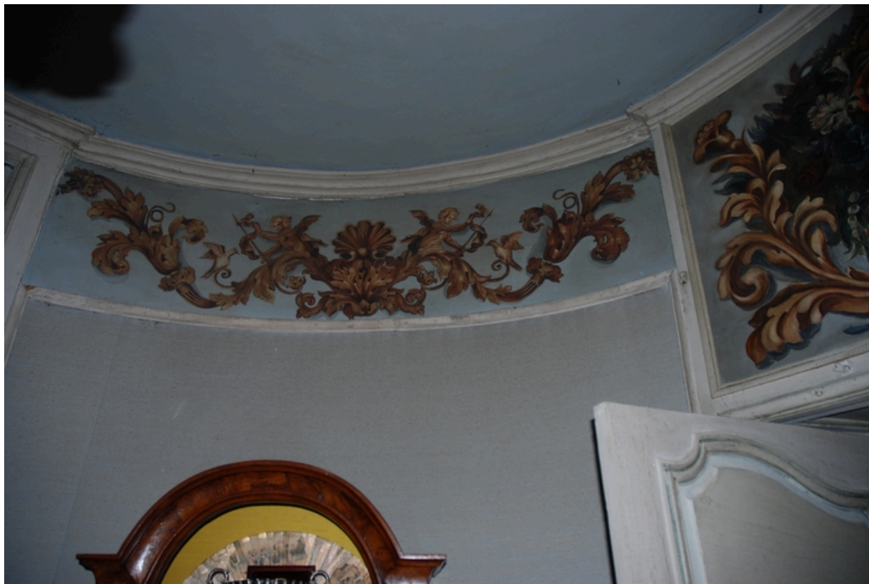
Tour d'angle sud-ouest, 1er étage : frise peinte sur toile marouflée.