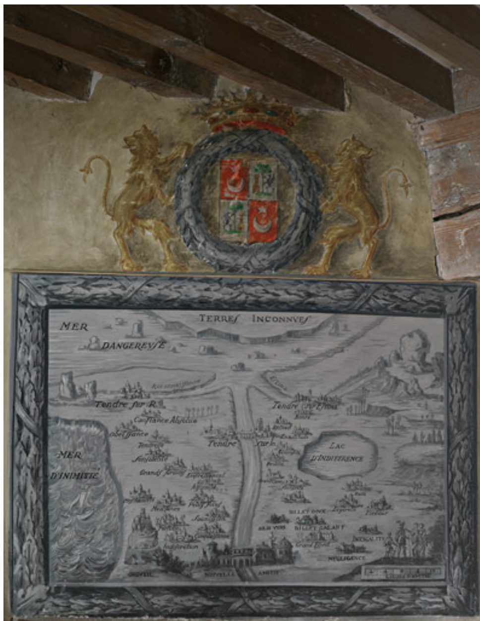
Vue de la Carte de Tendre peinte sur la tour d'escalier.