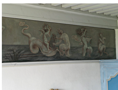
Corps central, 1er étage, chambre du milieu : cortège de tritons et de créatures marines.