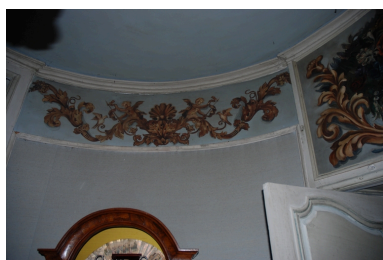
Tour d'angle sud-ouest, 1er étage : frise peinte sur toile marouflée.