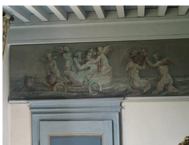
Corps central, 1er étage, chambre du milieu : cortège de tritons et de créatures marines.