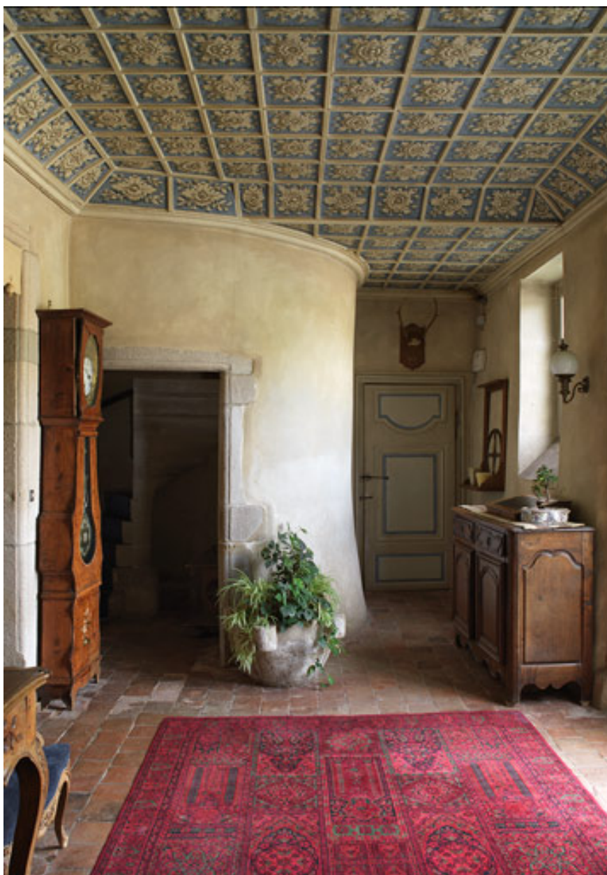
Vue du vestibule du château : plafond à petits caissons.