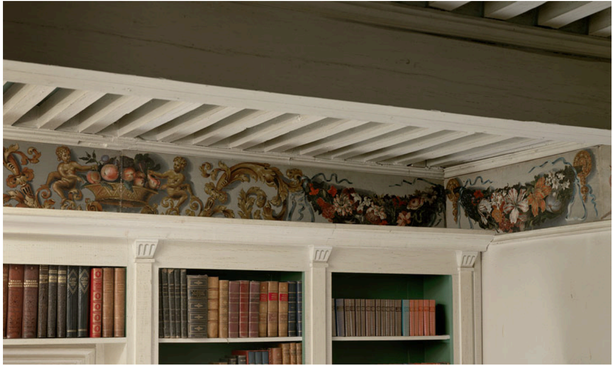
Aile sud, 1er étage, bibliothèque : décor peint sur les poutres de rive.