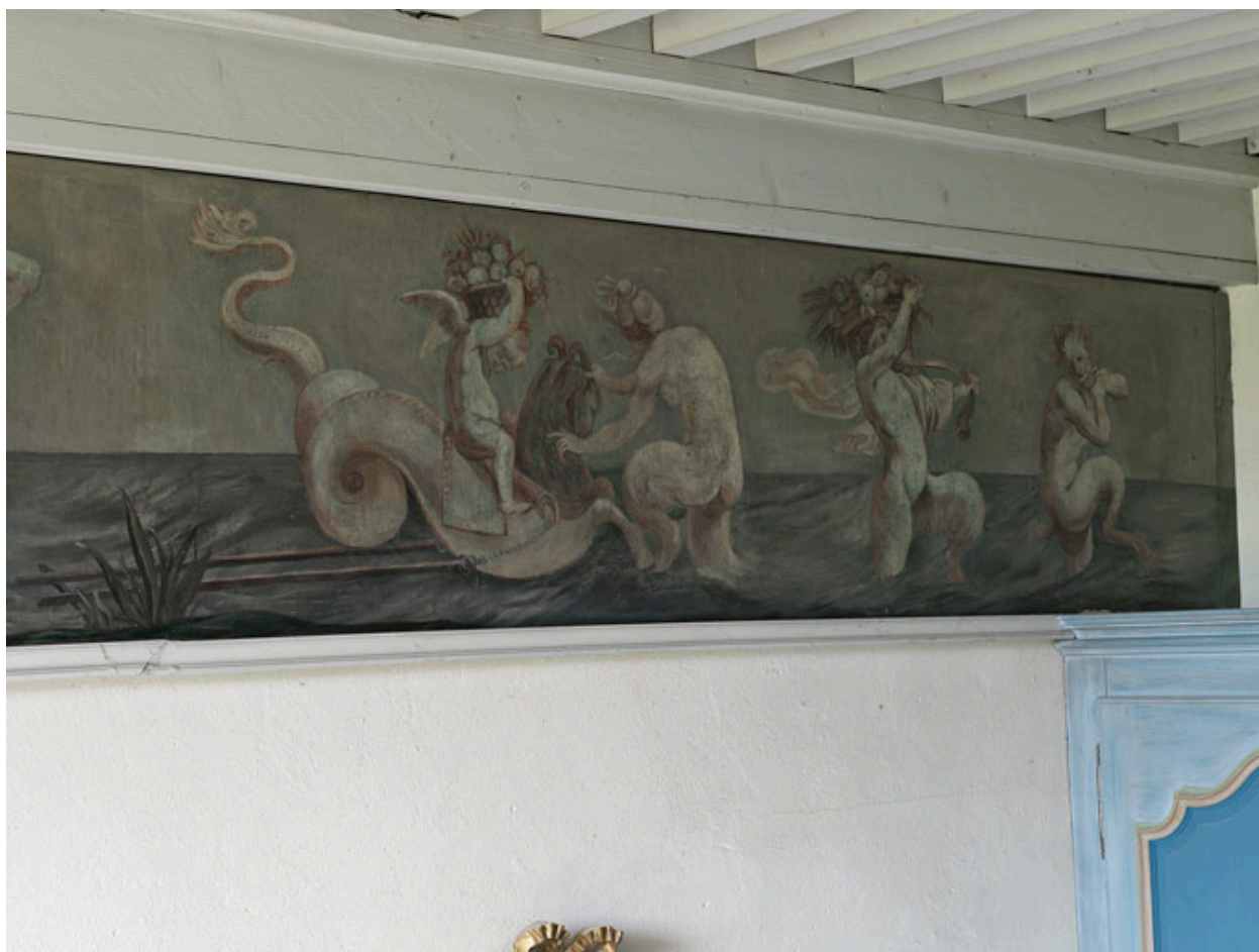
Corps central, 1er étage, chambre du milieu : cortège de tritons et de créatures marines.