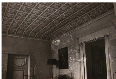
[Vestibule du château] Dossier de recensement MH établi en 1973. Photographie argentique en noir et blanc.