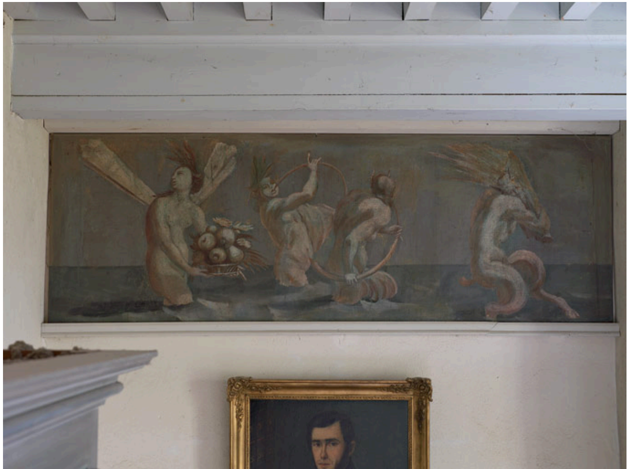
Corps central, 1er étage, chambre du milieu : cortège de tritons et de créatures marines.