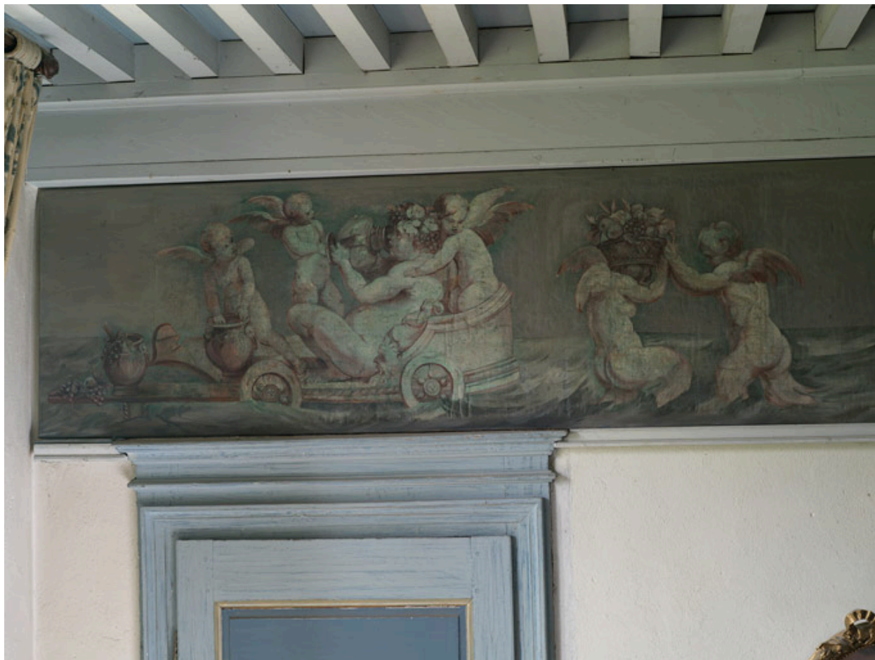
Corps central, 1er étage, chambre du milieu : cortège de tritons et de créatures marines.