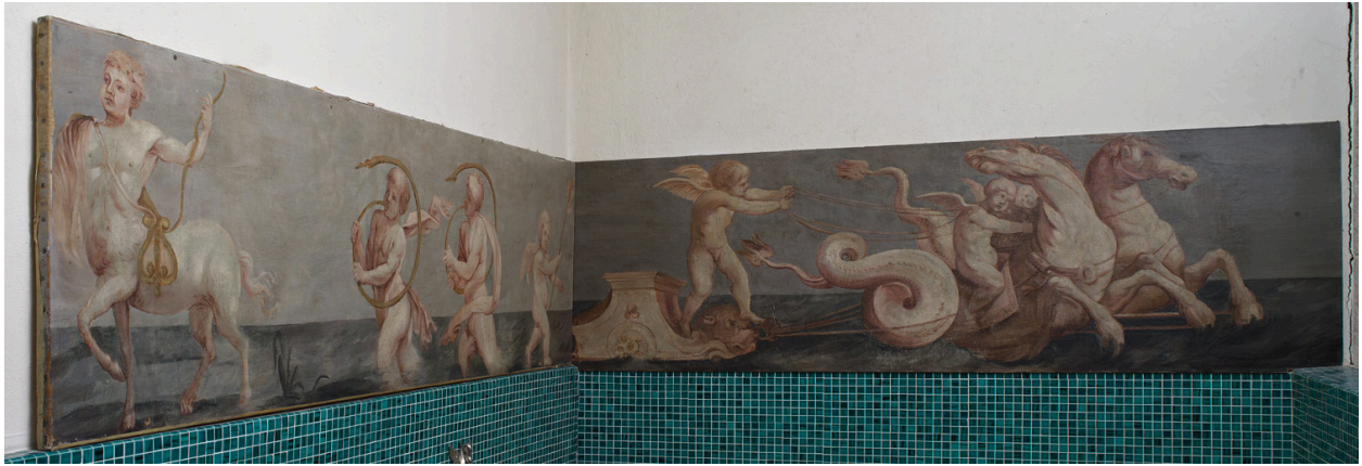
Corps central, 1er étage, chambre du milieu : cortège de tritons et de créatures marines.