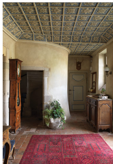
Vue du vestibule du château : plafond à petits caissons. IVR82_20094200683NUCA