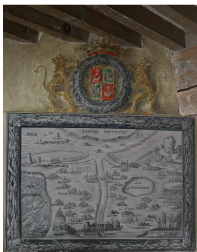
Vue de la Carte de Tendre peinte sur la tour d'escalier.