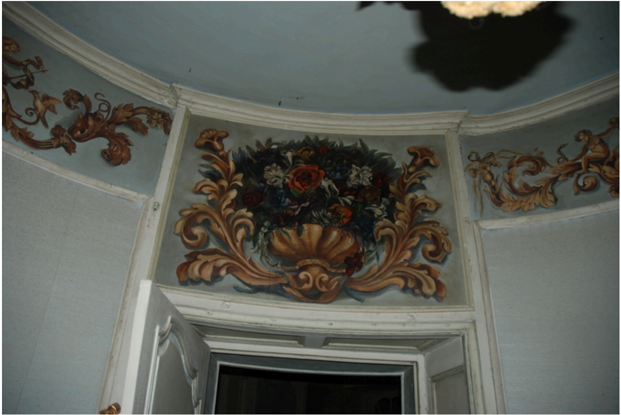
Tour d'angle sud-ouest, 1er étage : dessus-de-porte.