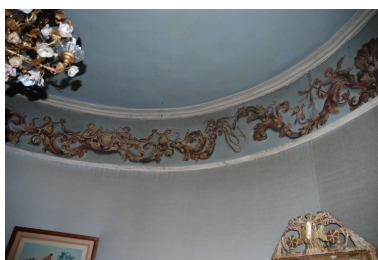
Tour d'angle sud-ouest, 1er étage : frise peinte sur toile marouflée.