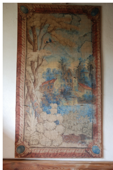
Couloir : toiles peintes imitant les verdure d'Aubusson.