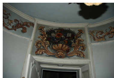
Tour d'angle sud-ouest, 1er étage : dessus-de-porte.