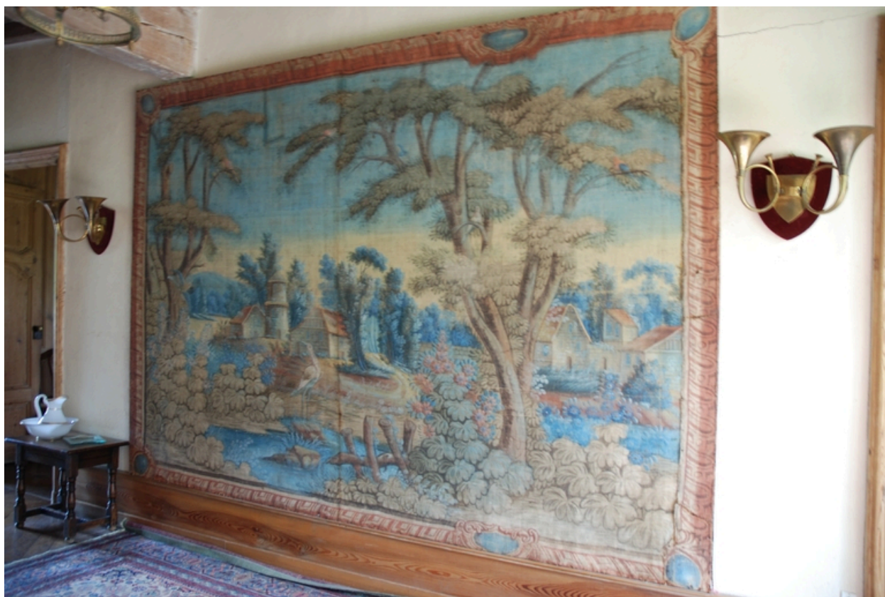
Couloir : toiles peintes imitant les verdure d'Aubusson.