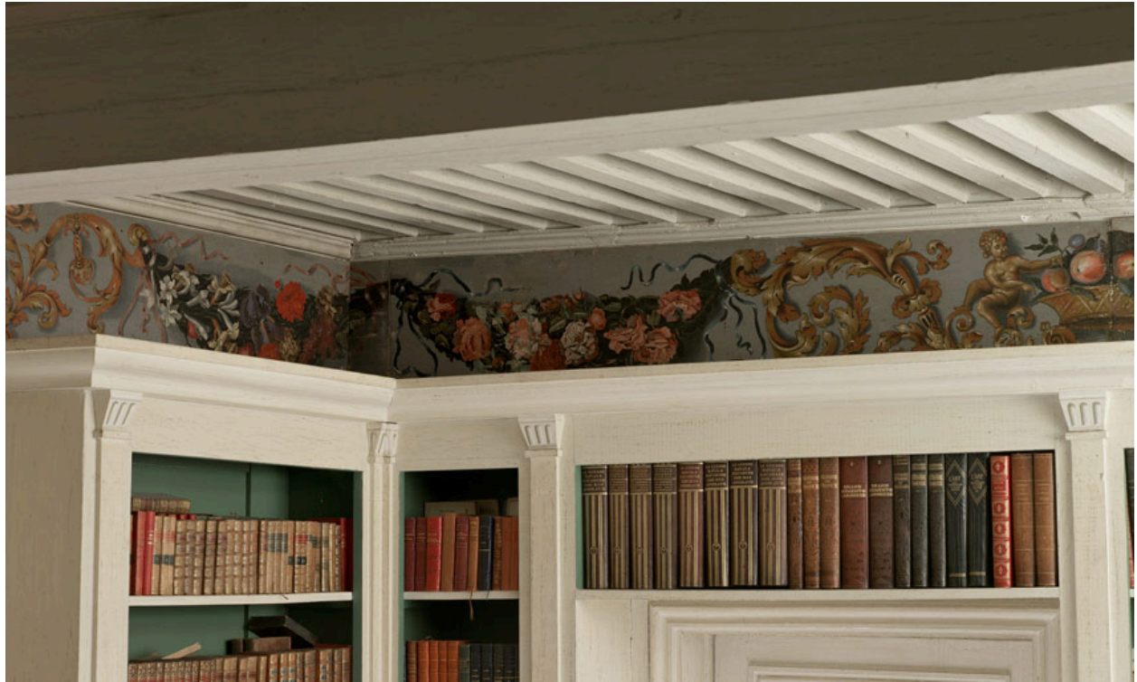
Aile sud, 1er étage, bibliothèque : décor peint sur les poutres de rive.