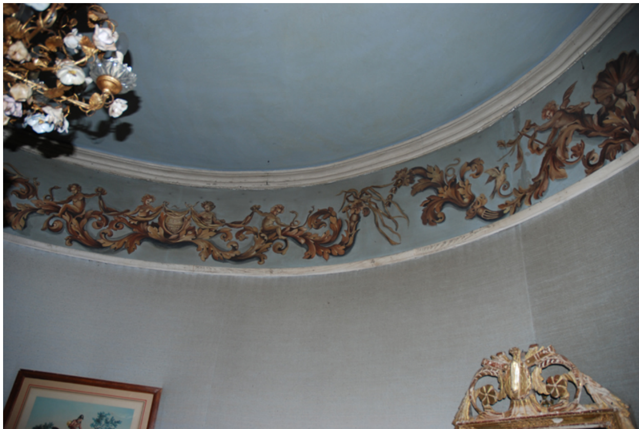
Tour d'angle sud-ouest, 1er étage : frise peinte sur toile marouflée.