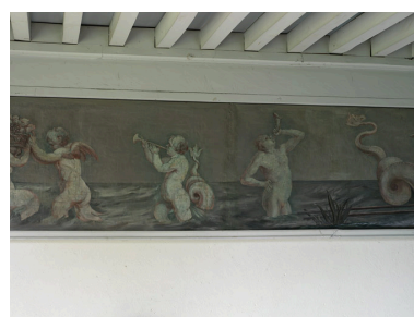
Corps central, 1er étage, chambre du milieu : cortège de tritons et de créatures marines. IVR82_20094200698NUCA