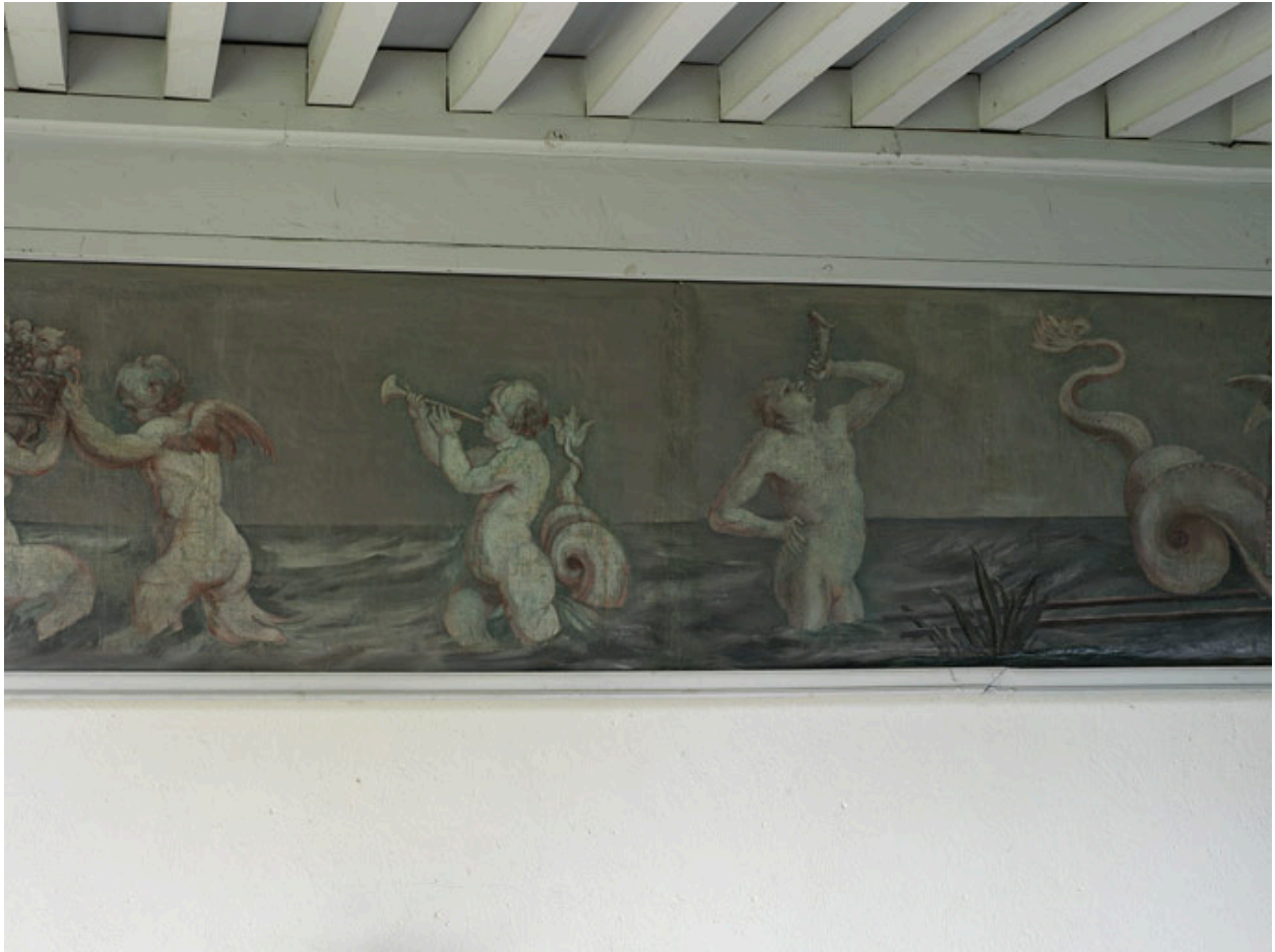
Corps central, 1er étage, chambre du milieu : cortège de tritons et de créatures marines.