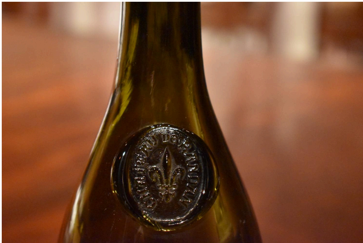
Vue de détail de la seconde bouteille