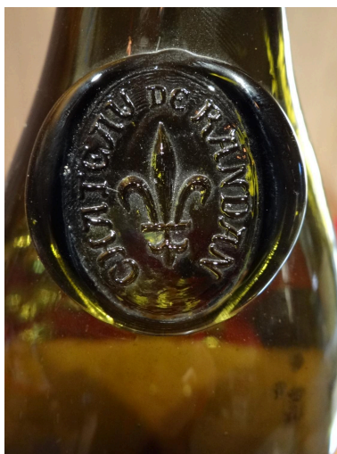
Détail de l'inscription IVR84_20216300603NUC4A