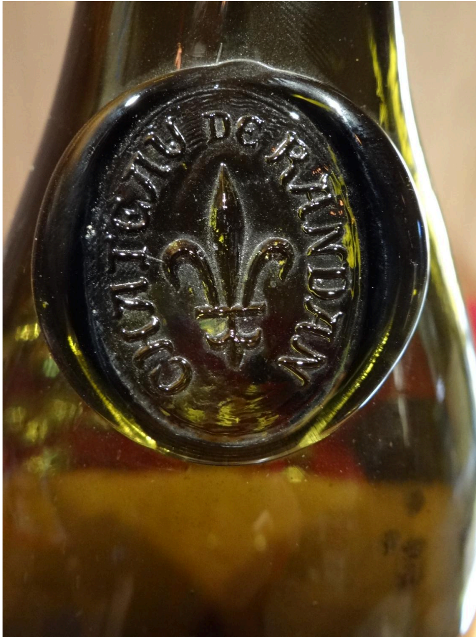
Détail de l'inscription