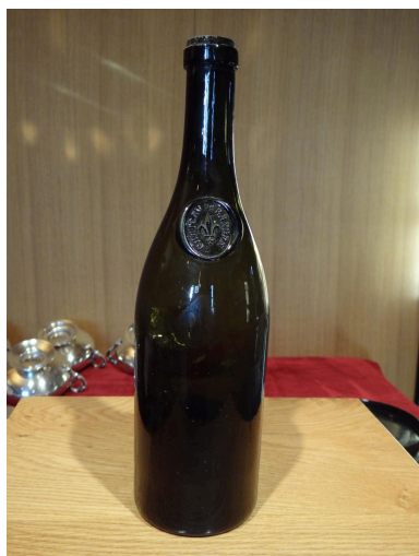
Vue générale IVR84_20216300602NUC4A