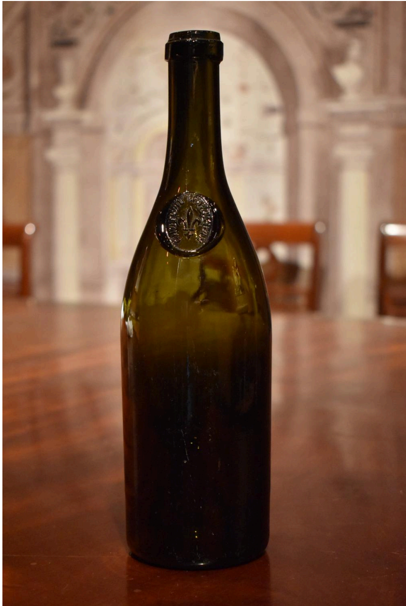
Vue générale d'une seconde bouteille