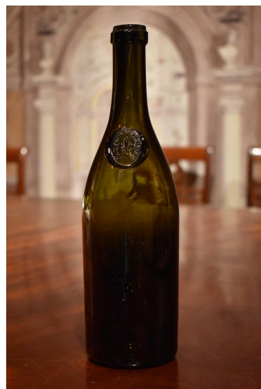
Vue générale d'une seconde bouteille IVR84_20216301431NUC4A