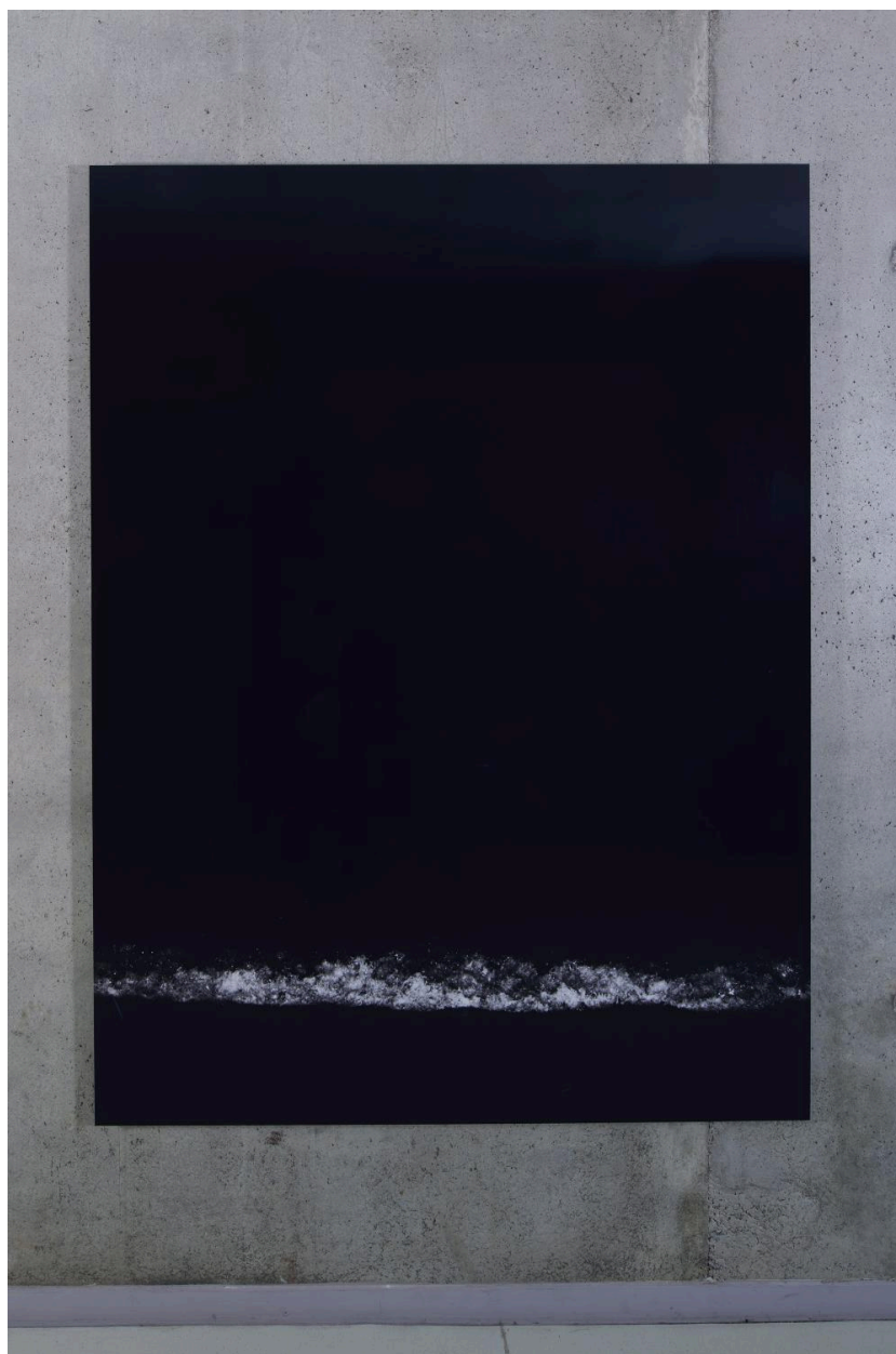
La Mer à Fort de l'Eau (niveau 2).