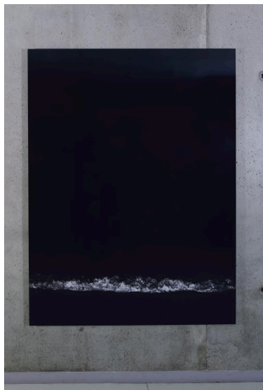
La Mer à Fort de l'Eau (niveau 2).