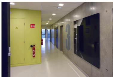
L'arrêt (niveau 3) : vue d'ensemble.