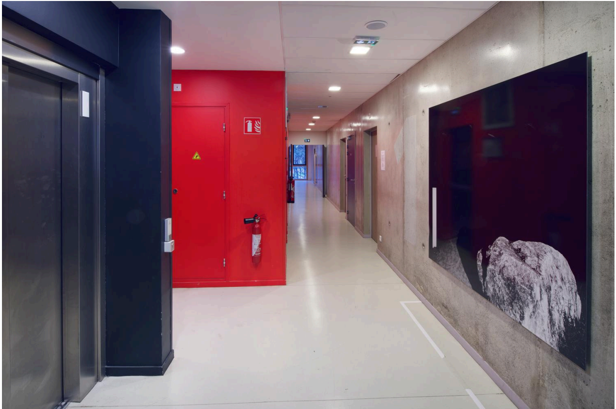
Le Caillou (niveau 1) : vue d'ensemble.