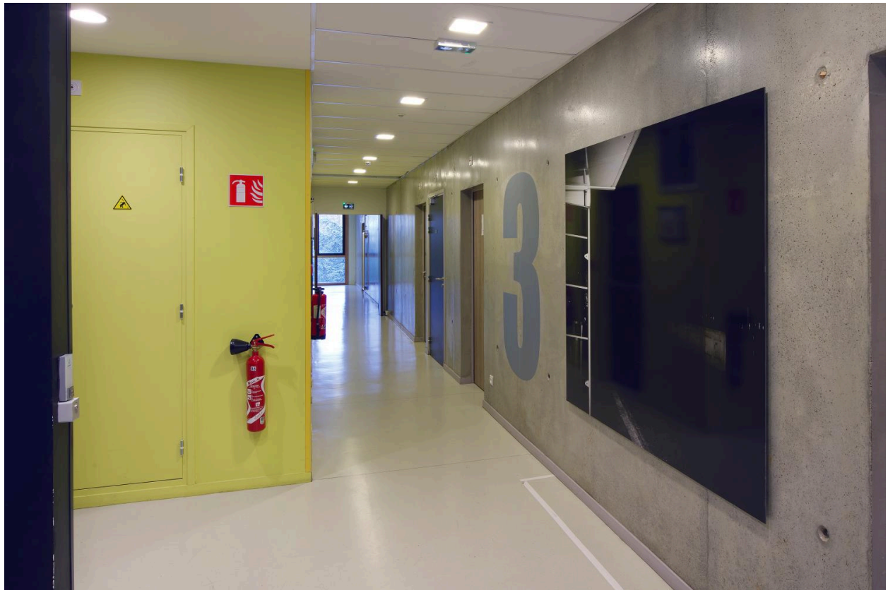
L'arrêt (niveau 3) : vue d'ensemble.