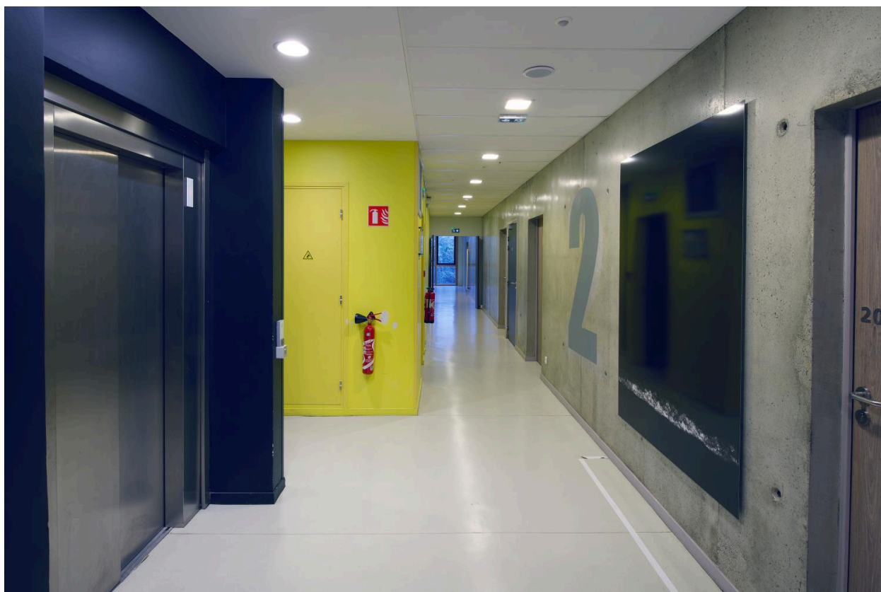
La Mer à Fort de l'Eau (niveau 2) : vue d'ensemble.