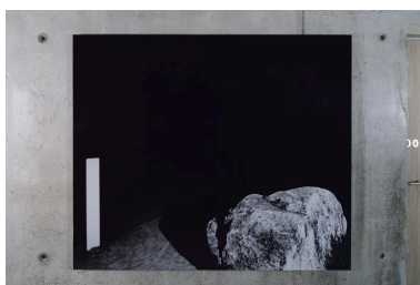
Le Caillou (niveau 1).