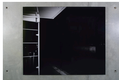
L'arrêt (niveau 3).