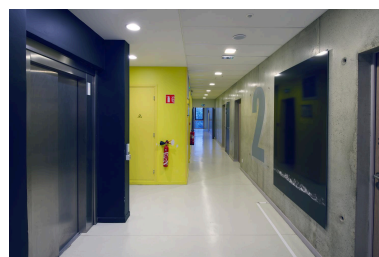
La Mer à Fort de l'Eau (niveau 2) : vue d'ensemble.