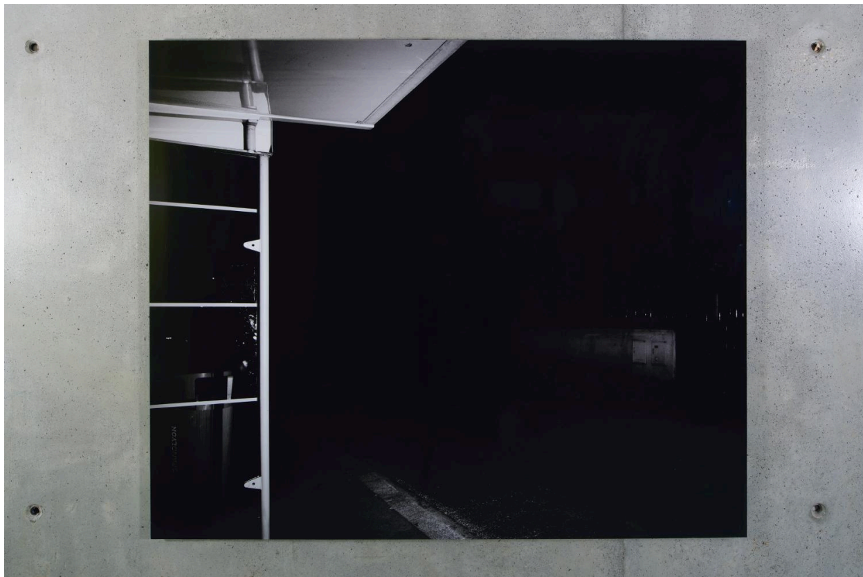
L'arrêt (niveau 3).