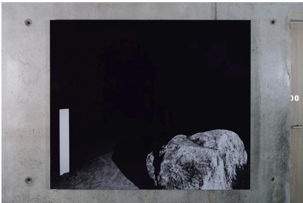
Le Caillou (niveau 1).