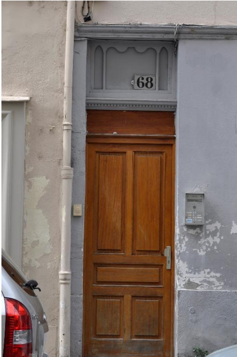
Vue rapprochée de la porte, imposte à colonnettes bois