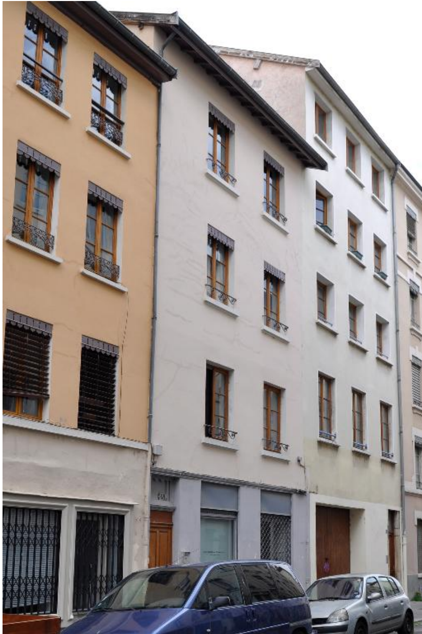
Vue générale, élévation sur rue