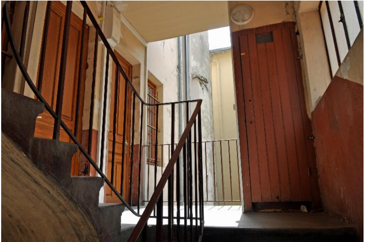
Vue du premier palier de l'escalier, dont la cage est ouverte au-delà du rez-de-chaussée