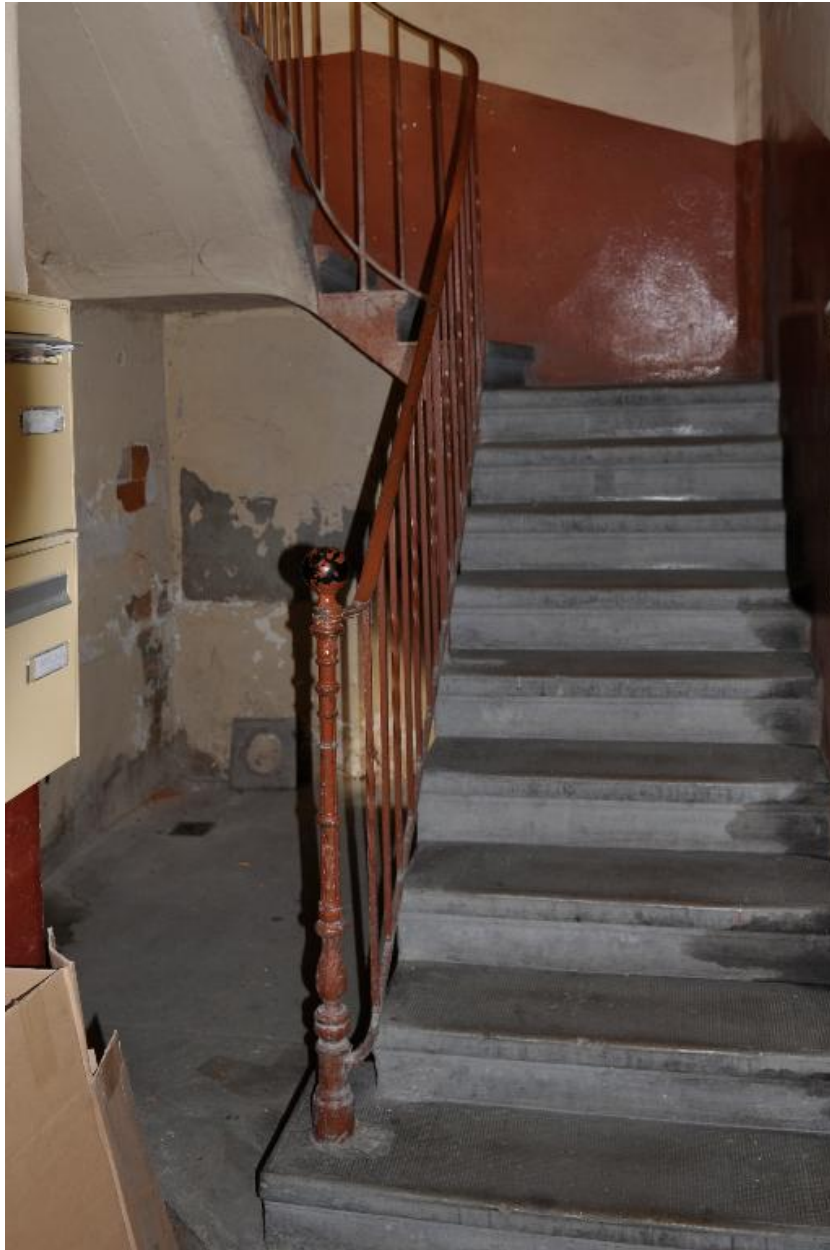
Vue du départ de l'escalier