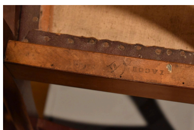
Vue de l'estampille IVR84_20216301418NUC4A