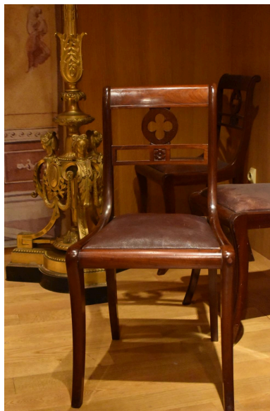
Vue générale d'une chaise IVR84_20216301415NUC4A