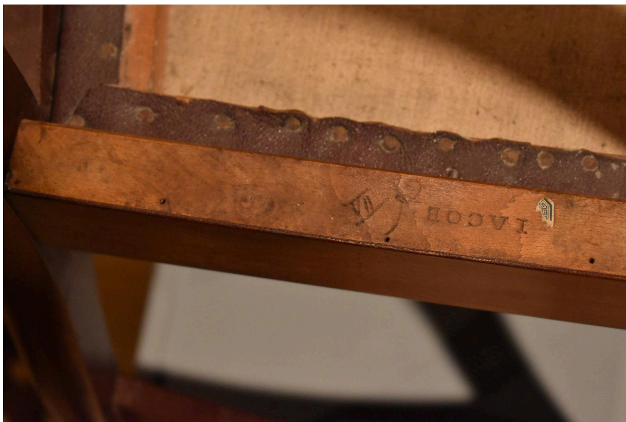
Vue de l'estampille