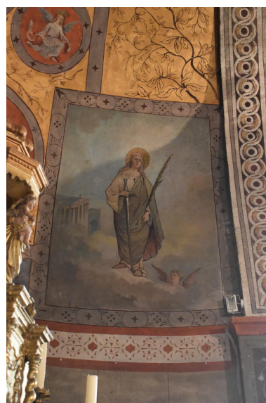
Sainte non identifiée, sainte Philomène (?)