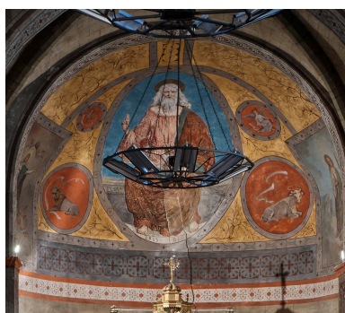
Vue générale. IVR84_20250300179NUC4A