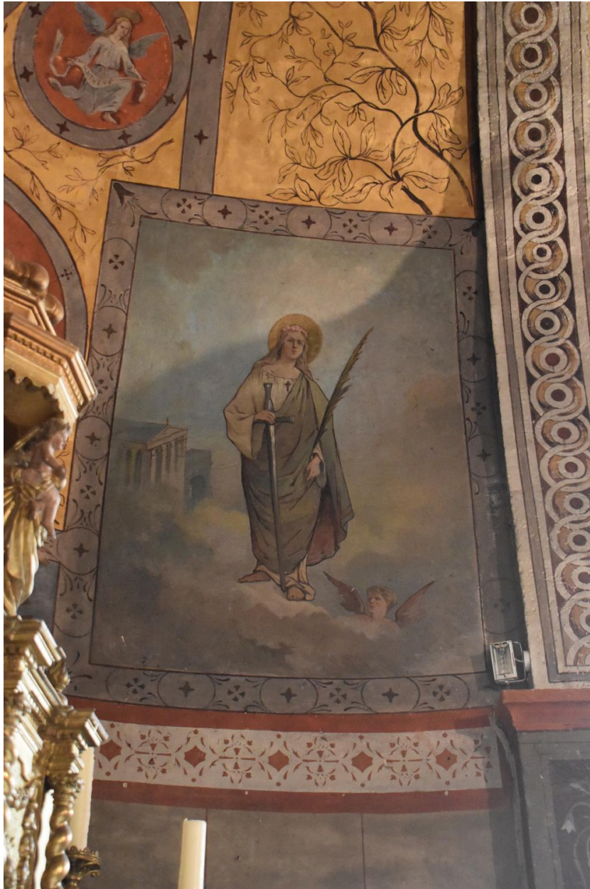
Sainte non identifiée, sainte Philomène (?)