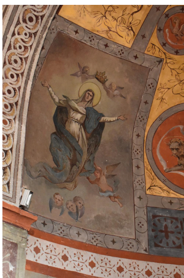
L'assomption de la Vierge d'après Pierre-Paul Prud'hon. IVR84_20250300176NUCA