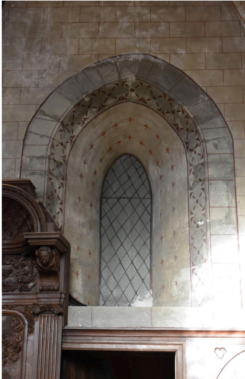
Peinture décorative ( baie obturée au dessus de la porte de la sacristie, au nord du chœur).