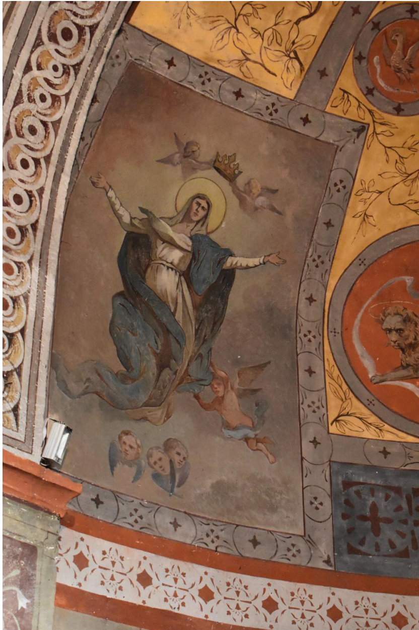
L'assomption de la Vierge d'après Pierre-Paul Prud'hon.