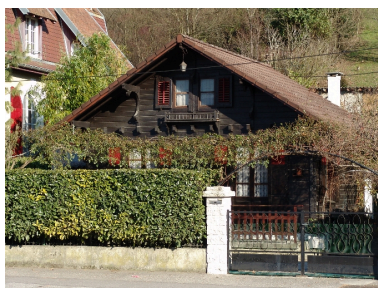
Vue générale IVR82_20077300956NUCA