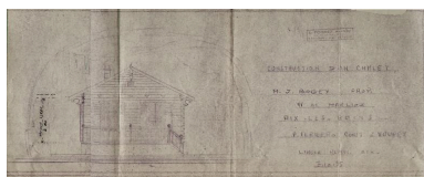
Elévation occidentale, 1935 IVR82_20147301192NUCB