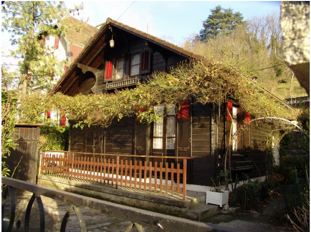
Vue de trois-quart droit