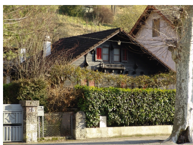
Façade occidentale