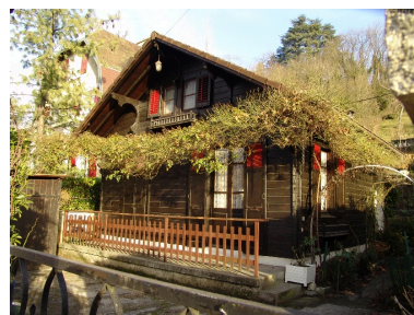
Vue de trois-quart droit IVR82_20087300118NUCA