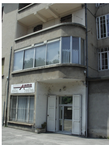
façade sud