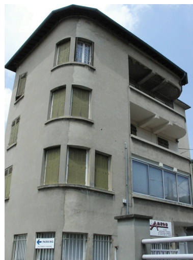
façade est