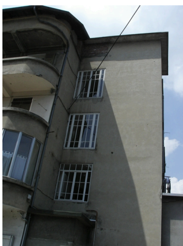
façade sud