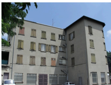
façade ouest