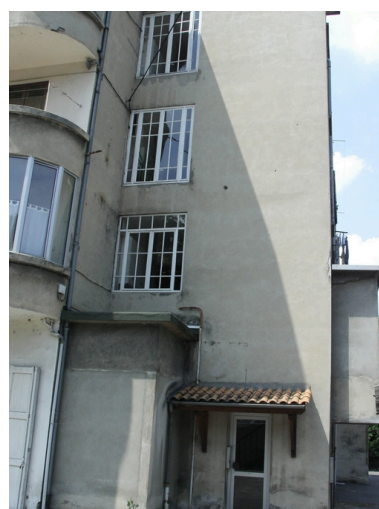
façade sud IVR82_20073800139NUCA