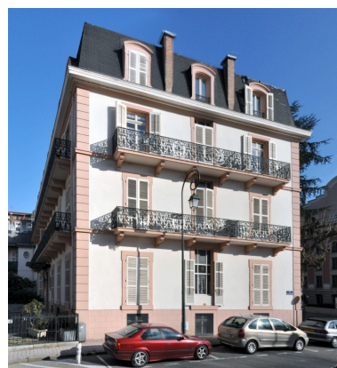
Façade latérale droite IVR82_20107300973NUCA