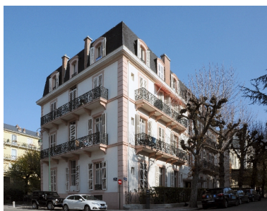
Vue de trois-quart depuis le sud-ouest