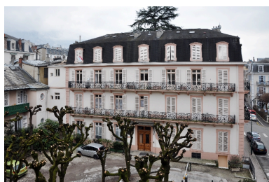
Façade nord