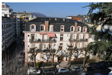
Façade sud