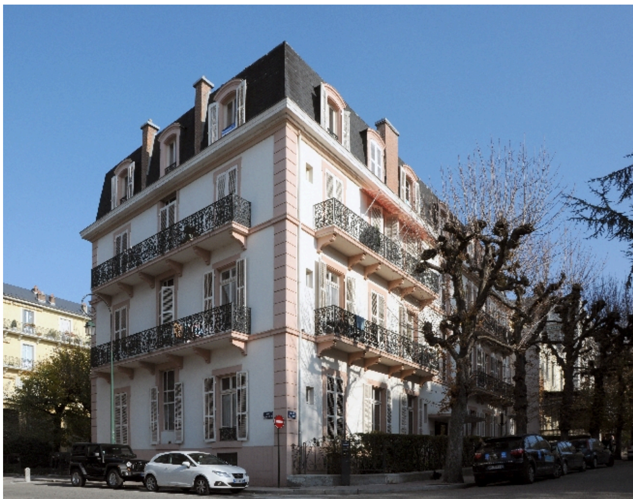
Vue de trois-quart depuis le sud-ouest