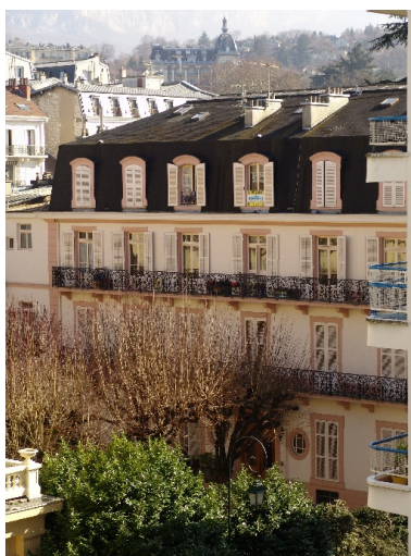
Façade nord, détail IVR82_20097300070NUCA