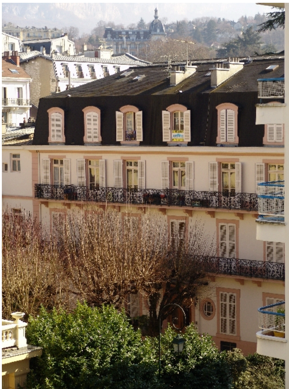
Façade nord, détail