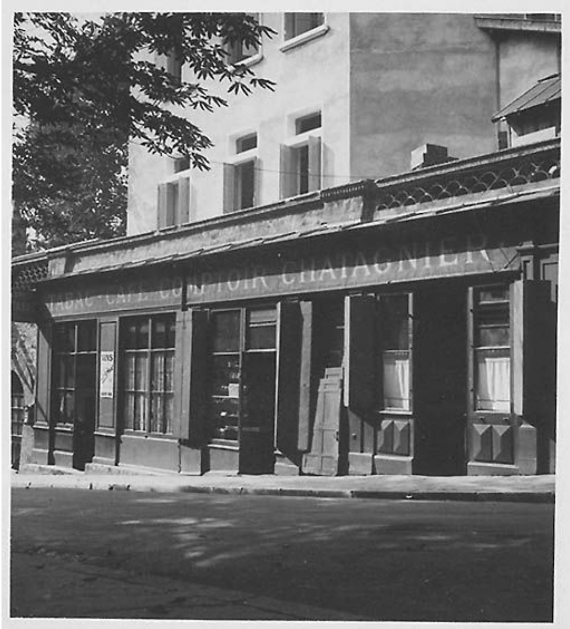
Devanture du café Chatagnier, ca 1930-1940