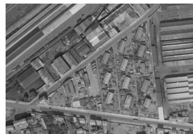
Vue aérienne de la cité, 19/05/1953.

Dess. Guylaine Beauparland-Dupuy IVR84_20216301271NUDA