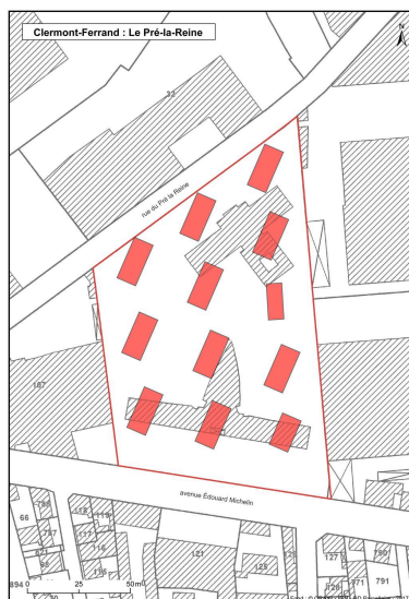
Plan des différents bâtiments d'origine de la cité.

Dess. Brigitte Ceroni, Autr. Service du cadastre IVR84_20196300305NUDA