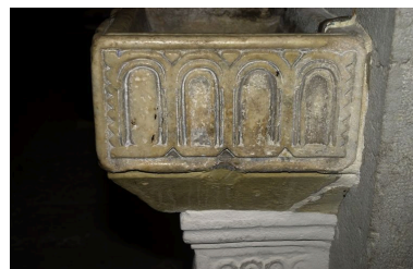
Face sud du bénitier au losange : détail IVR82_20026902881NUCA