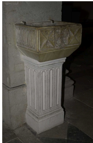
Vue générale, IVR82_20026902878NUCA