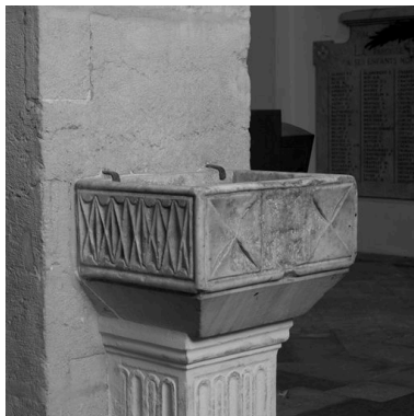
Vue générale IVR82_20046906108NUC