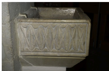
Face nord du bénitier au losange : détail, IVR82_20026902879NUCA