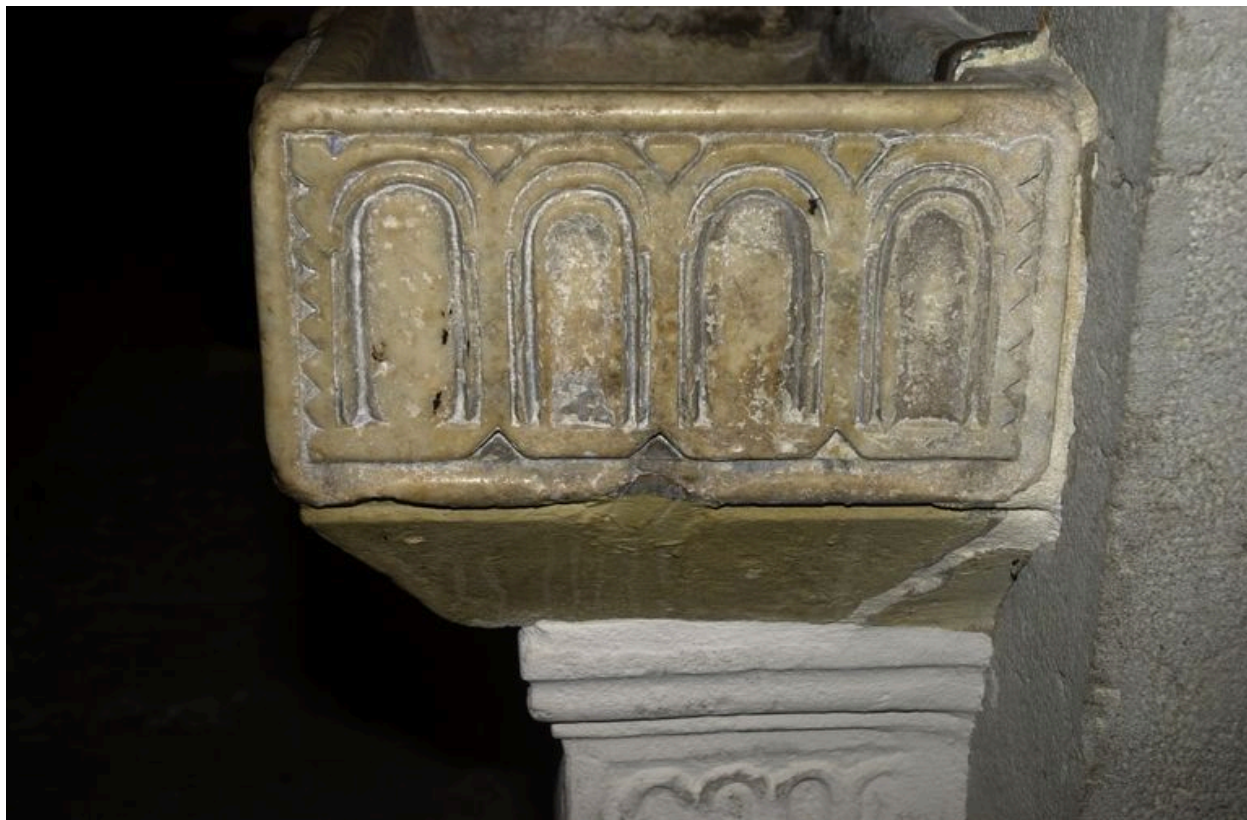
Face sud du bénitier au losange : détail