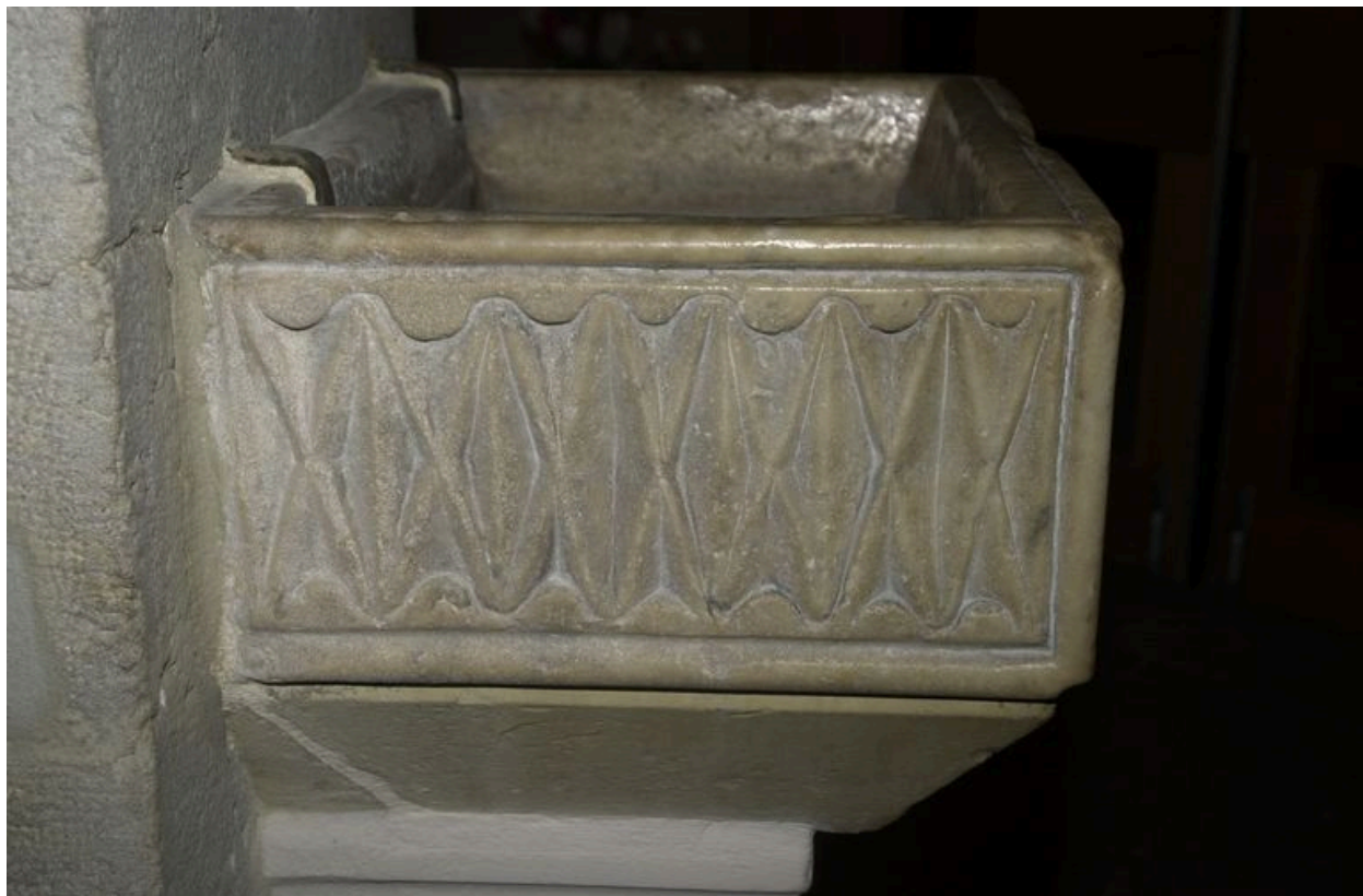
Face nord du bénitier au losange : détail