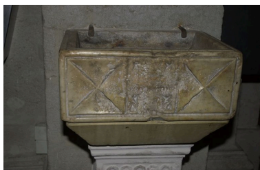
Face principale du bénitier au losange : détail IVR82_20026902880NUCA