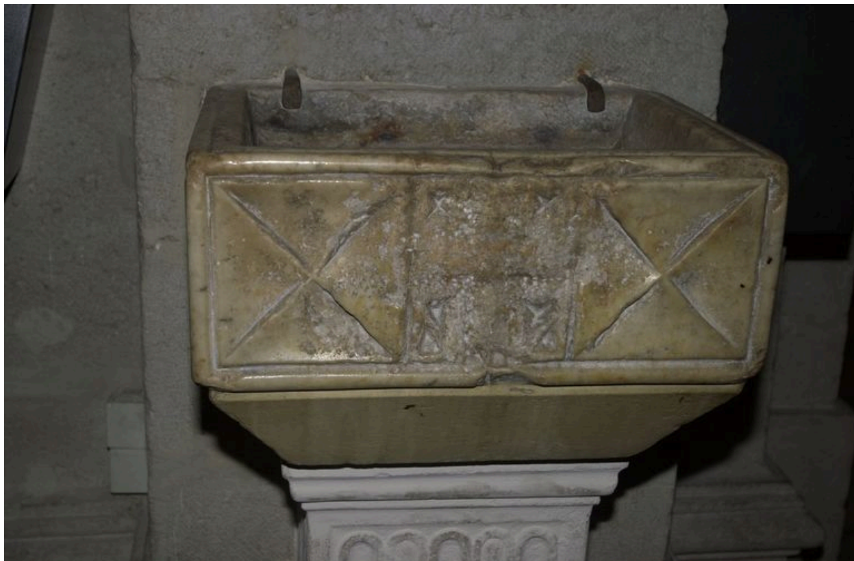
Face principale du bénitier au losange : détail