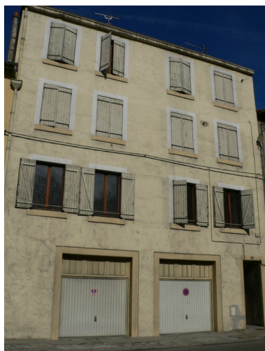
Façade sur rue IVR82_20093800315NUCA