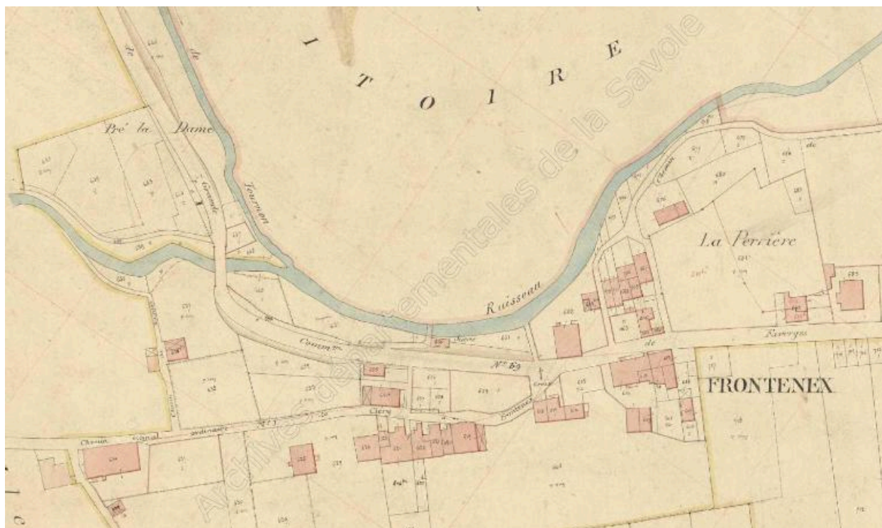
Premier cadastre français, Rochette (1a), 1870, Section unique, feuille 3 (FR.AD073, 3P 7434).