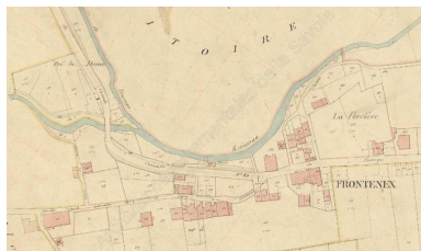
Premier cadastre français, Rochette (la), 1870, Section unique, feuille 3 (FR.AD073, 3P 7434). IVR82_20147303865NUCA