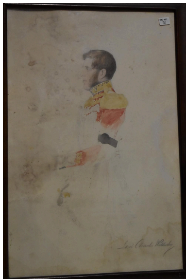
Vue générale IVR84_20216300561NUCA