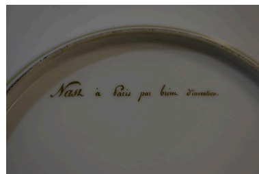
Détail des inscriptions