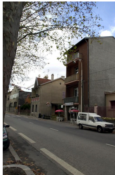
Vue de situation IVR82_20026901555NUCA