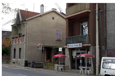
Vue générale IVR82_20026901556NUCA