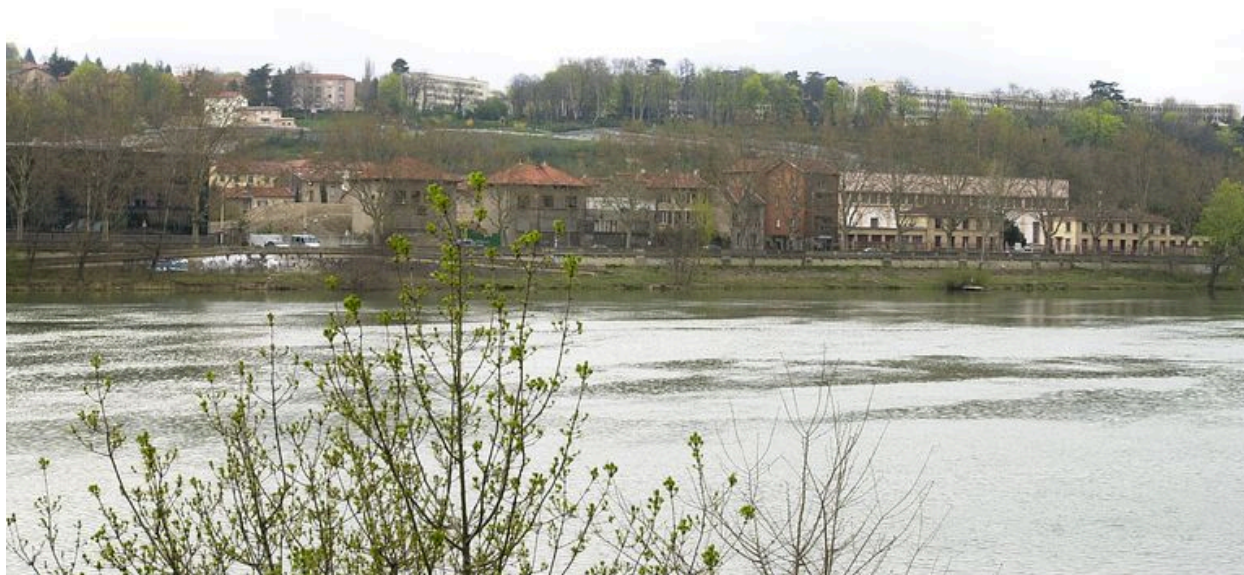
Vue de situation depuis la rive gauche de la Saône