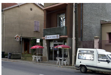
Vue rapprochée