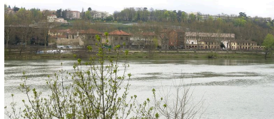
Vue de situation depuis la rive gauche de la Saône IVR82_20046902057NUCA